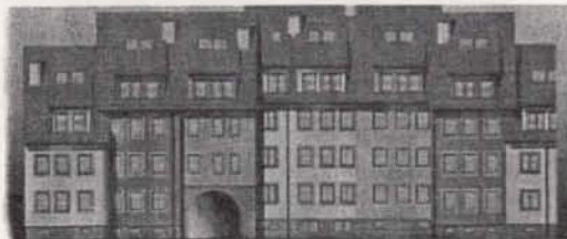
Budynki przy ul. Szpitalnej, która zmieni nazwę na imienia Wacława Kowalskiego zostaną zasiedlone w maju.