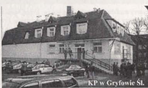
KP w Gryfowie Śl.

Do Komisarjatu Policji w Gryfowie należy