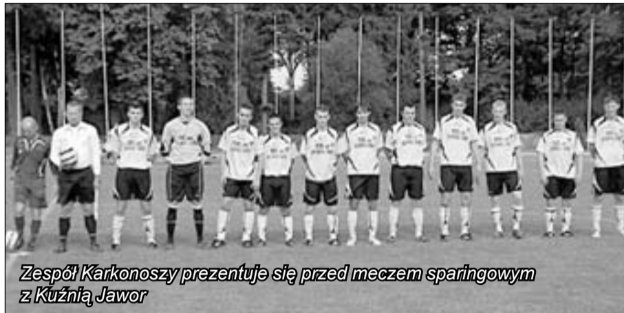
Zespół Karkonoszy prezentuje się przed meczem sparingowym z Kuźnią Jawor

W poniedziałek (14 lipca) drużyna seniorów Karkonoszy rozpoczęła treningi z udziałem tylko 12 zawodników. Potem przychodziło 17 i znacznie więcej. Wydawało się jednak, że w drużynie seniorów, która niebawem przystąpi do rozgrywek o mistrzostwo dolnośląskiej IV ligi dzieje się nie najlepiej. Całe szczęście to się nie potwierdza.