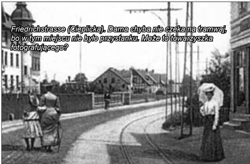
Friedrichstrasse (Cieplicka). Dama chyba nie czeka na tramwaj, bo w tym miejscu nie było przystanku. Może to towarzyszką fotografującego?