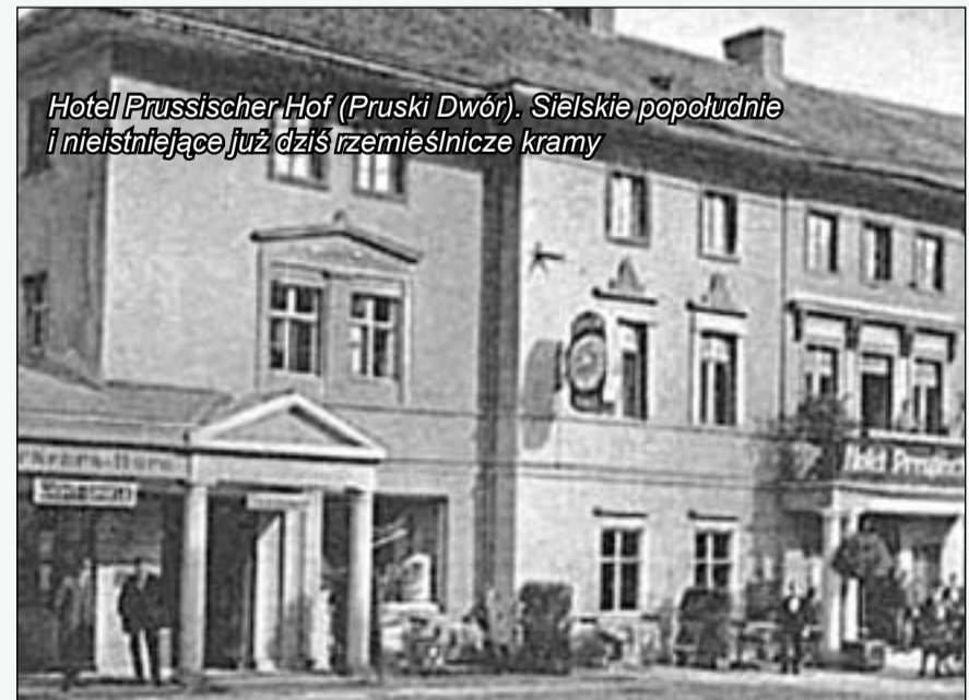
Hotel Prussischer Hof (Pruski Dwór). Sielskie popołudnie i nieistniejące już dziś rzemieślnicze kramy