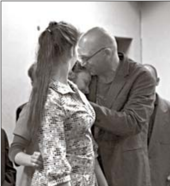
Ed. Konrad Przeważnik