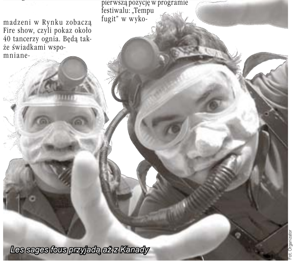
Les sages fous przyjadą aż z Kanady

naniu Compagnia Teatralne Corona z Korsyki (Włochy). (tejo)