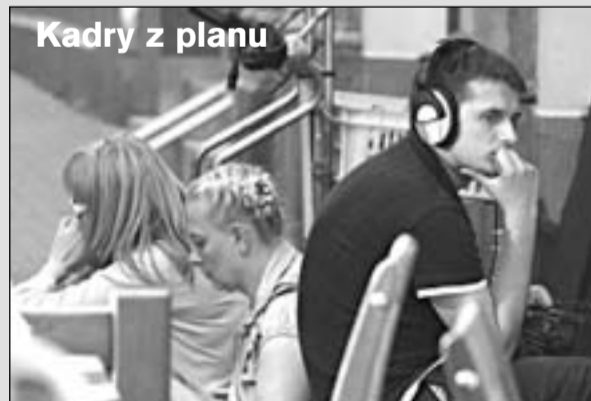
Kadry z planu

Wprawdzie do Hollywood nam jak stąd do wieczności, ale jeleniogórskie plenery są magnesem dla wielu filmowców, którym podobają się nie tylko zakątki stolicy Karkonoszy, lecz także inne, magiczne miejsca w regionie. W Jeleniej Górze powstał, między innymi, odcinek serialu Bogusława Wołoszańskiego, który z kolei w zamku Czocha i okolicznych plenerach kręcił film „Tajemnice twierdzy szyfrów”. W Szklarskiej Porębie przy wodospadzie Kamieńczyk powstały sceny do światowego hitu „Opowieści z Narnii – księżę Kaspian”. O filmowych epizodach Lubomierza wiedzą chyba wszyscy. To chyba najbardziej znane z ekranu miasteczko dzięki zdjęciom do trylogii Sylwestra Chęcińskiego z Kargulem i Pawlakiem „Sami swoi”.