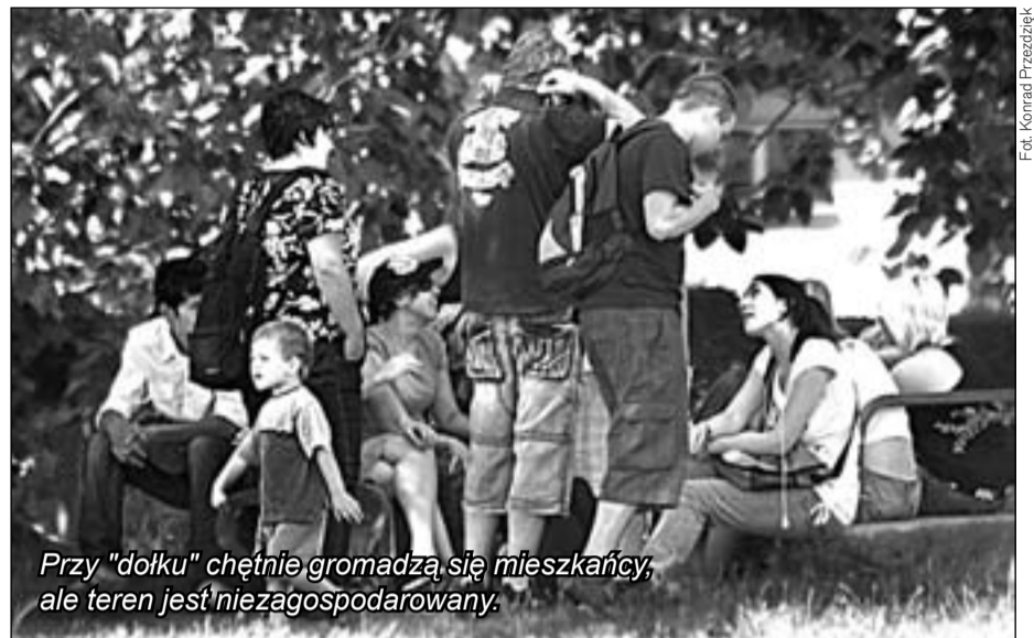
Przy "dołku" chętnie gromadzą się mieszkańcy, ale teren jest niezagospodarowany.

Później zabobrzański dołek przy ulicy Różyckiego zaczął podupadać. Był tu tor jazdy dla gokartów i lodowisko. Zimą 2006 roku przychodziły na dołek tłumy: dopisywał mróz i śnieg. Ale kolejna najzimniejsza pora roku powiała wiosną. Podobnie tegoroczna. W końcu ostał się tylko obskurny bar pod namiotem, na którego bywałców narzekali sąsiedzi. Zlikwidowano go na początku tego roku.