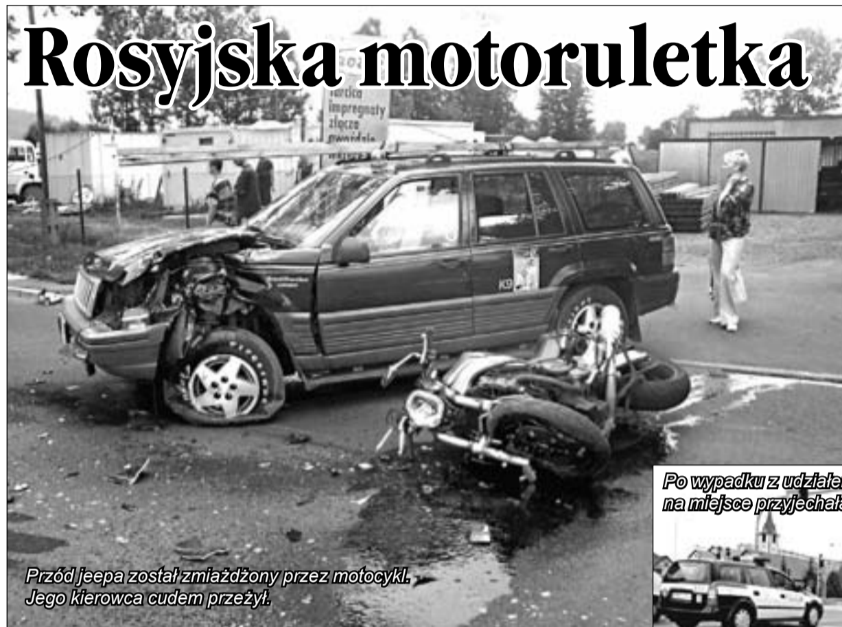
Przed jeepa został zmiądzony przez motocykl. Jego kierowca cudem przeżył.

Znacznie bardziej dramatyczny przebieg miało zdarzenie z minionego piątku z Cieplic z ulicy Lubańskiej. - Nieopodal tartaku samochód dostawczy zatrzymał się, żeby przepuścić jeepa. Za nim jechało kilka samochodów. Motocyklista pedził jak szalony lewą stroną ulicy mijając wszystkie auta. Z naprzeciwka podążał