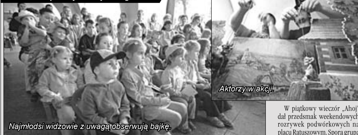
Najmłodsi widzowie z uwagą obserwują bajkę.

Niemal 17 dni bez przerwy trwała akcja „Skok w blok” podczas której Czeski teatr marionetkowy „Ahoj” z Chrudima i rodzimy Teatr Odnaleziony odwiedzili kilkanaście podwórek w całej Jeleniej Górze. Pomysłodawcy dali rozrywkę najmłodszym, którzy bawili się tak, jak ich dziadkowie.