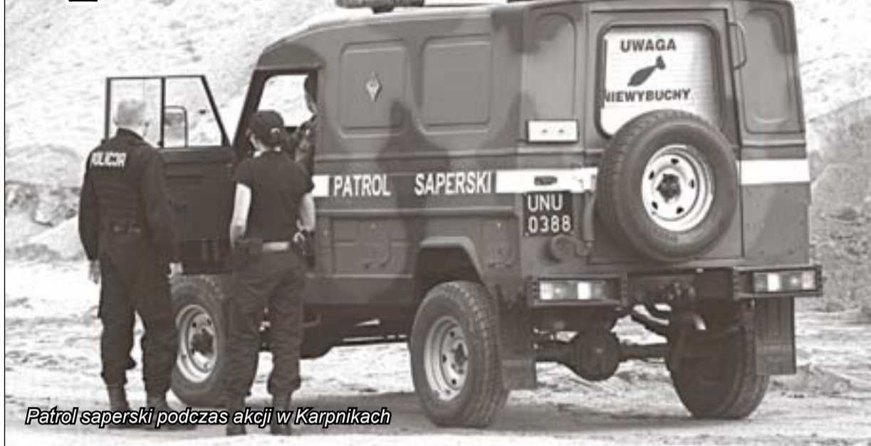
Patrol saperowski podczas akcji w Karpnikach

Skorodowany pocisk artyleryjski z lat drugiej wojny światowej znaleziono w piątek w Bobrowie pod Jelenią Górą. To już kolejna wybuchowa pamiątka po czasach sprzed 60 lat. Takich niespodzianek pozostawionych przez hitlerowców i sowieców ziemie regionu jeleniogórskiego kryją jeszcze znacznie więcej, choć – paradoksalnie – stolicę Karkonoszy i jej otoczenie ominęły działania wojenne. Skąd niewybuchy i niewypały?