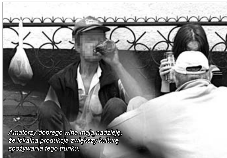
Amatorzy dobrego wina mają nadzieję, że lokalna produkcja zwiększy kulturę spożywania tego trunku.