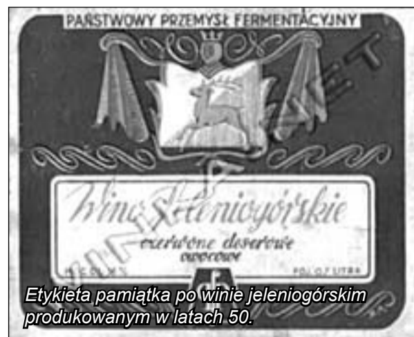
Etykieta pamiątka po winie jeleniogórskim produkowanym w latach 50.