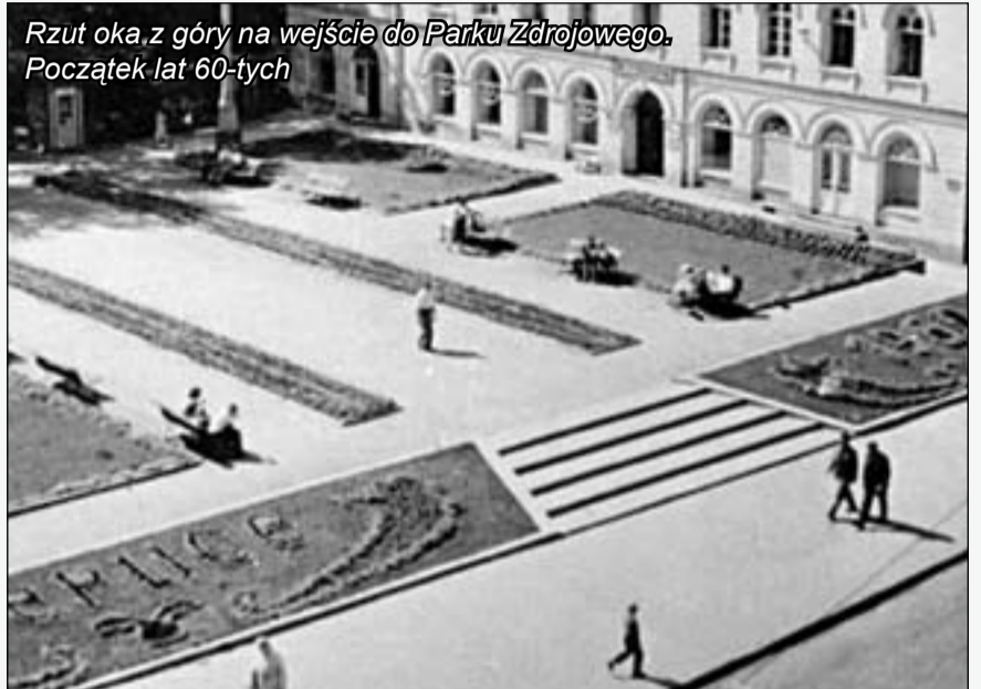
Rzut oka z góry na wejście do Parku Zdrojowego. Początek lat 60-tych

werze milicjant z raportówką. Za parą – motorower, popularny środek transportu, być może należy do właściciela aparatu? Mającą się szyny tramwajowe... A w tle nieistniejąca już narożna kamieniczka, wyburzona pod koniec lat 60-tych minionego wieku.