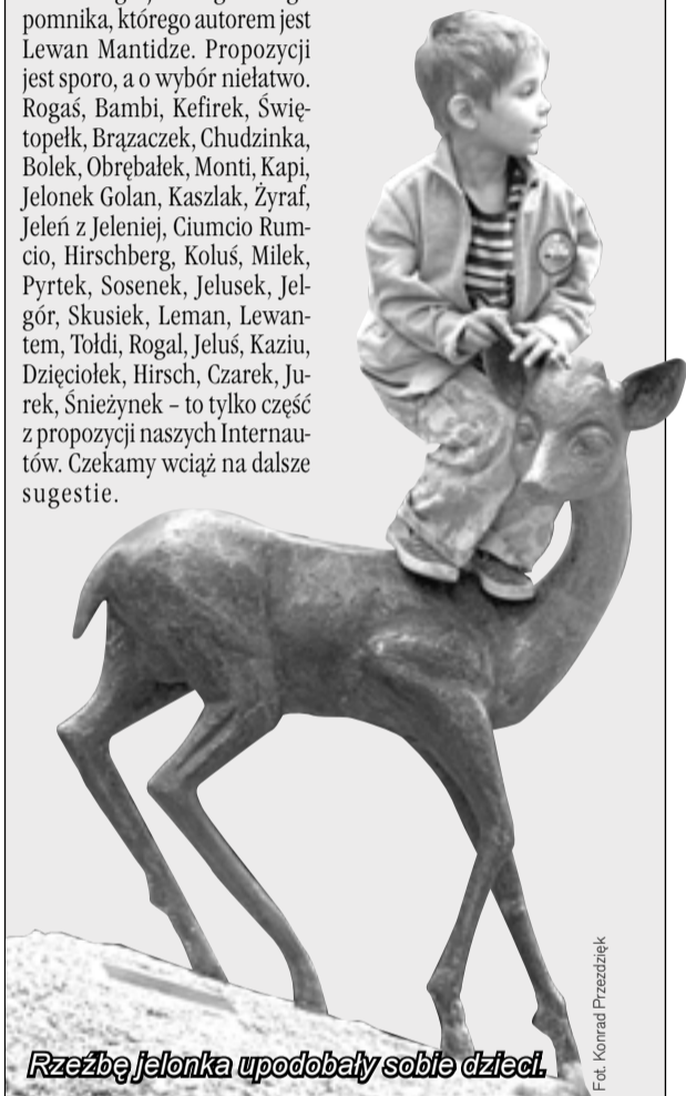
Rzeźbę Jelonka upodobały sobie dzieci.