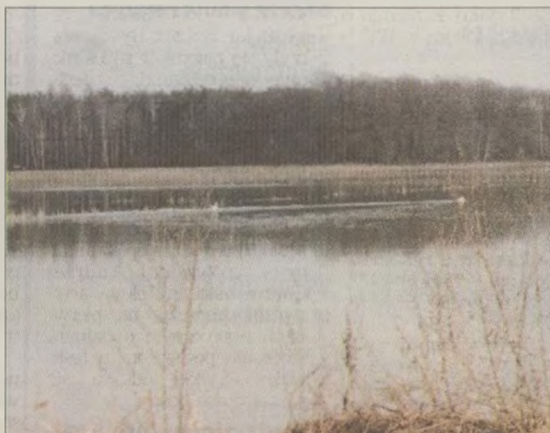
Na polach pływają łabędzie.