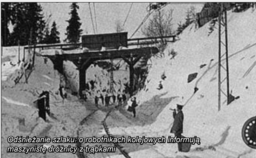
Odśnieżanie szlaku: o robotnikach kolejowych informują maszynistów dróżnicy z trąbkami

Całość projektu najlepiej widać z pokładu... samolotu.