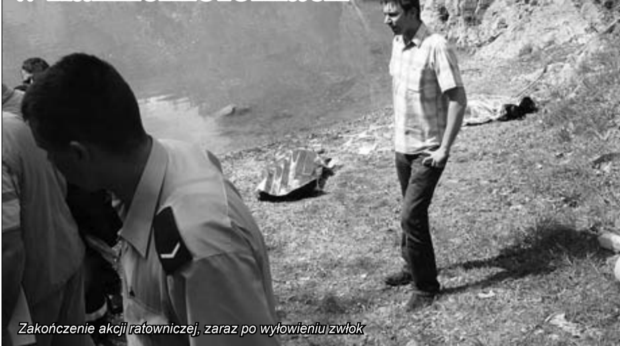
Zakończenie akcji ratowniczej, zaraz po wyłowieniu zwłok

dramat. Dwaj chłopcy i instruktor trafili na głębiny, a ciężkie buty i wojskowe ubrania „moro” błyskawicznie namokły wodą. Wszyscy toną, ale instruktor ma przy sobie nóż, rozcina sznurówka i uwalnia się z butów ważących wiele kilogramów. Wypływa na powierzchnię. Niestety, dwaj chłopcy nie zdołali uwolnić się od ciągnących ich na dno ubrań.