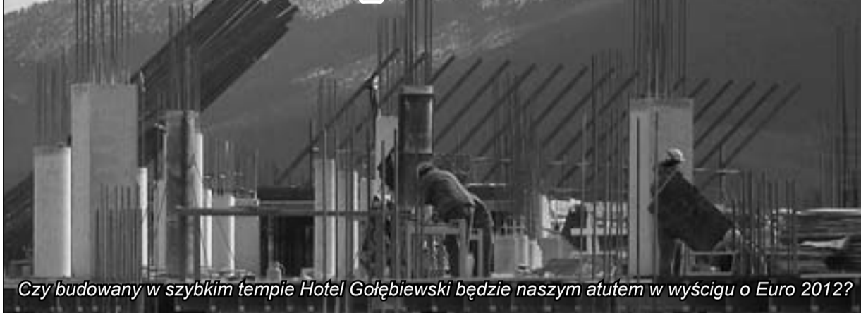
Czy budowany w szybkim tempie Hotel Gołębiewski będzie naszym atutem w wyścigu o Euro 2012?

Uczestnicy mistrzostw Europy będą mieszkać w Karpaczu a trenować w Jeleniej Górze – to nowy pomysł obu samorządów. Miasta te chcą połączyć siły i wspólnie stworzyć centrum treningowo-pobytowe dla jednej z drużyn. – Mają duże szanse – oceniają fachowcy.