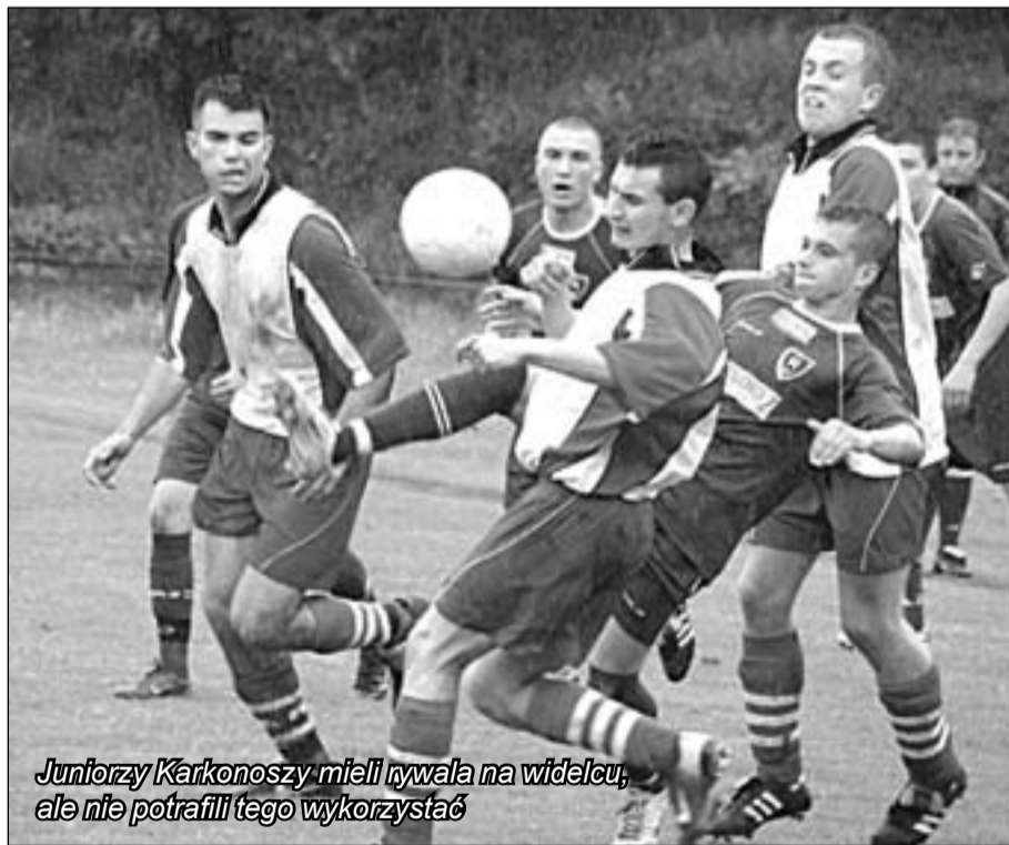
Juniorzy Karkonoszy mieli rywala na widelcu, ale nie potrafili tego wykorzystać

Juniorzy starsi Karkonoszy przegrali na własnym boisku z Motobi Kąty Wrocławskie 1:4 i ich szanse na utrzymanie w Dolnośląskiej Lidze Juniorów znacznie zmalały.