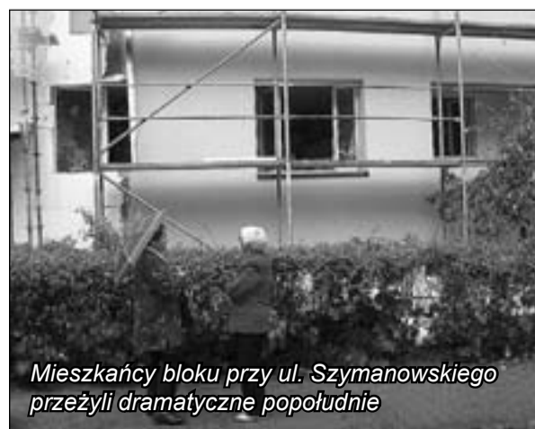
Mieszkańcy bloku przy ul. Szymanowskiego przeżyli dramatyczne popołudnie