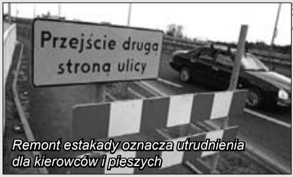
Remont estakady oznacza utrudnienia dla kierowców i pieszych