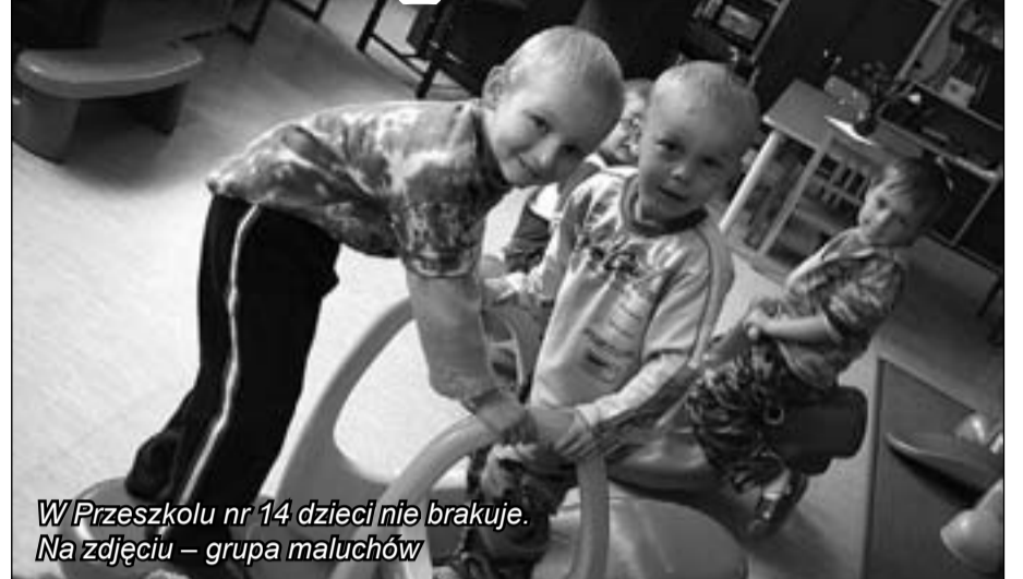
W Przedszkolu nr 14 dzieci nie brakuje. Na zdjęciu – grupa maluchów

jący. – Do tego czasu rodzice muszą uzbroić się w cierpliwość – apeluje.