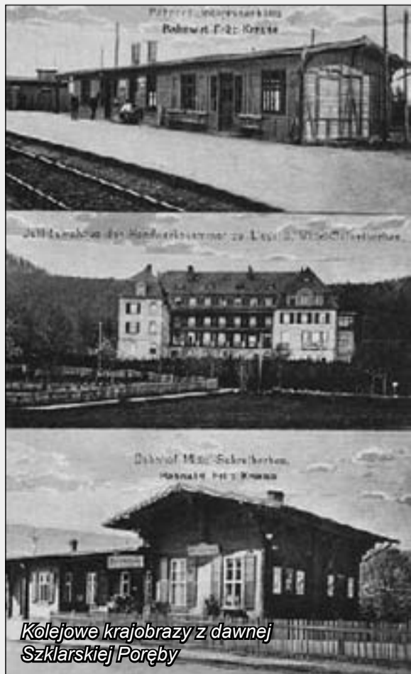
Kolejowe krajobrazy z dawnej Szklarskiej Poręby

Rekompensatą za nieco dłuższą podróż są wspaniałe widoki, jakie oczom podróżnych wznoszącego się ku szczytom, sapiącego ledwo dyszącą lokomotywą pociągu, ukażą się z niewielkich jeszcze okien wagonów trzeciej klasy.