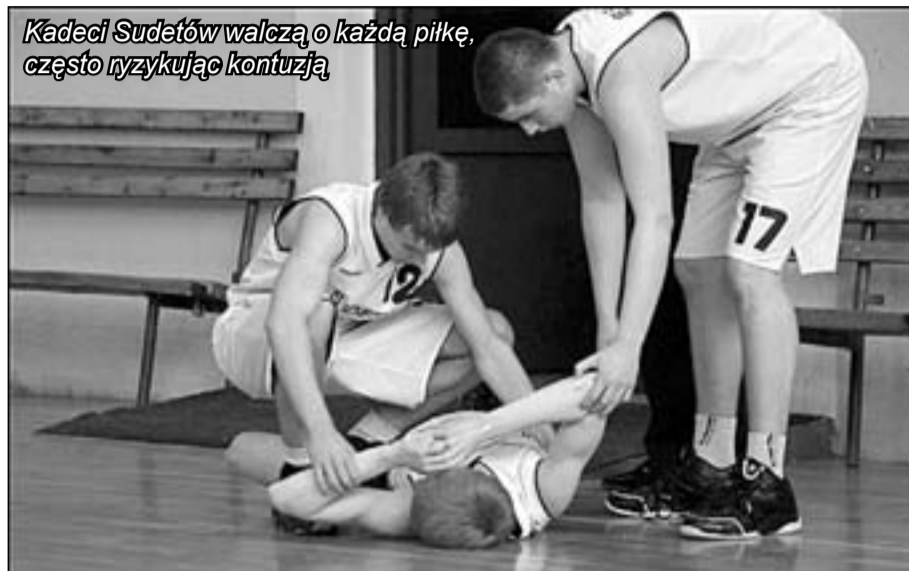
Kadeci Sudetów walczą o każdą piłkę, często ryzykując kontuzją

Już jednak po pierwszym meczu, kiedy jeleniogórzanie „po-