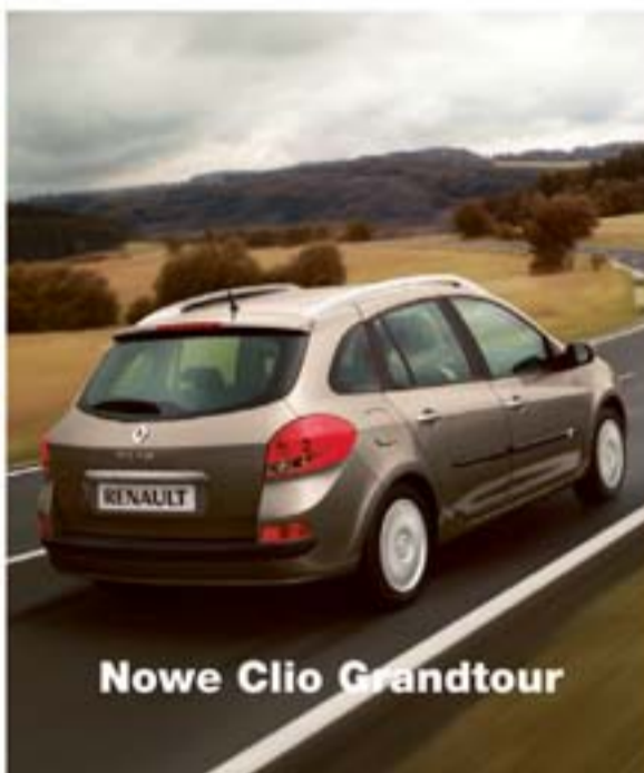
Nowe Clio Grandtour