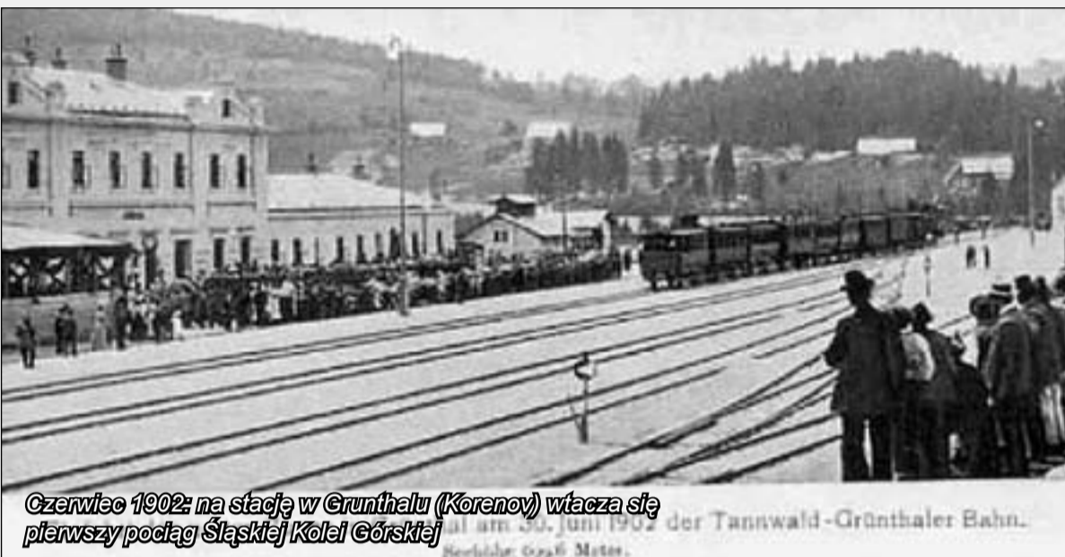
Czerwiec 1902: na stację w Grunthalu (Korenov) wtacza się pierwszy pociąg Śląskiej Kolei Górskiej

– Nowoczesna kolej żelazna dowiezie kuracjuszy i turystów do Schreiberhau, górskiego kurortu, który w całej Rzeszy rozslawia wschodnie Prusy. Kolej żelazna da