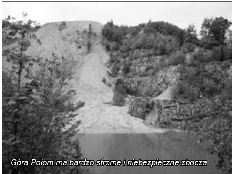
Góra Połom ma bardzo strome i niebezpieczne zbocza