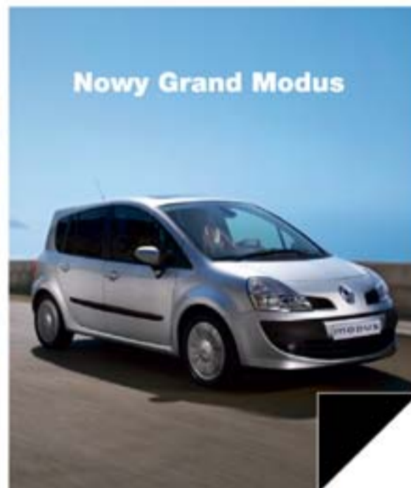
Nowy Grand Modus