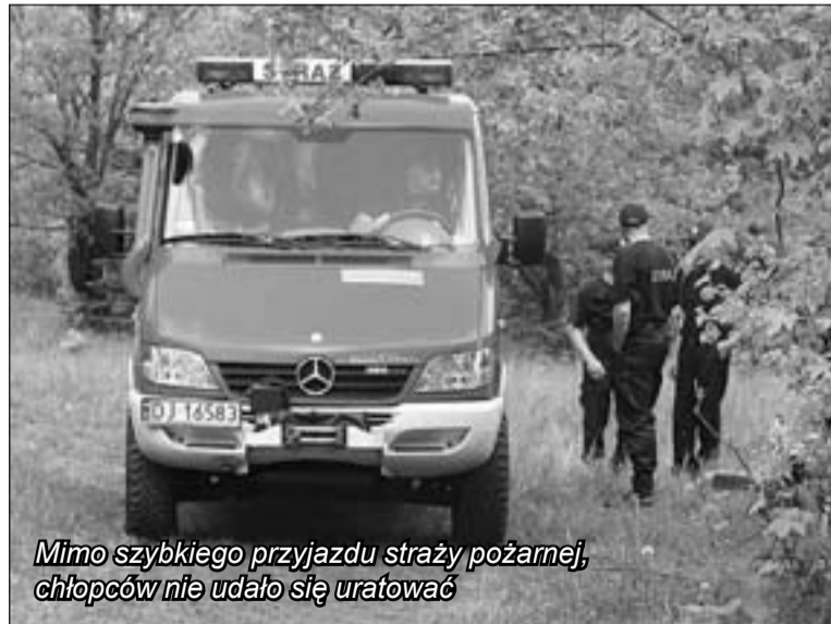
Mimo szybkiego przyjazdu straży pożarnej, chłopców nie udało się uratować