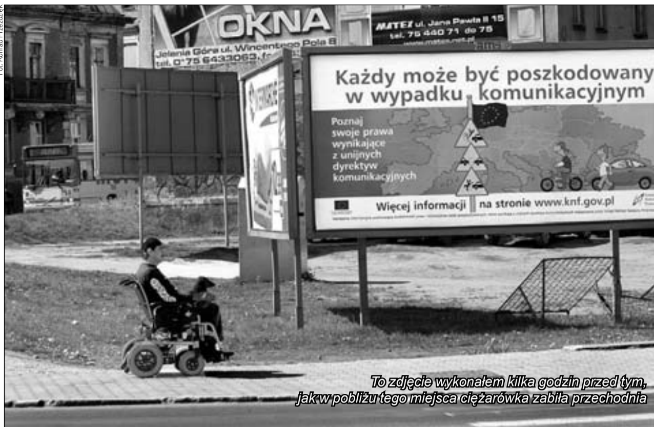
To zdjęcie wykonałem kilka godzin przed tym, jak w pobliżu tego miejsca ciężarówka zabiła przechodnia

Co takiego ma w sobie zdjęcie, że potrafi połączyć ludzi? Takie pytanie zadałem sobie przeglądając internetową galerię, dzięki której każdy może pokazać swoją wizję świata zamkniętą w kadrze. I przy okazji poznać kogoś, zaprzyjaźnić się i wymienić doświadczeniami. A przede wszystkim: miłością do polowania na chwile.