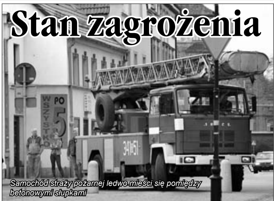
Samochód straży pożarnej ledwo mieści się pomiędzy betonowymi słupkami