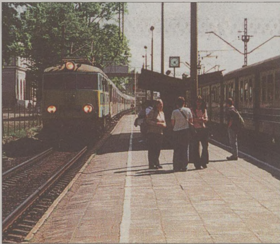
W polityce PKP tkwi pewien paradoks: przedsiębiorstwo stawia na połączenia dalekobieżne i w nie inwestuje. Tymczasem bilety są droższe na liniach lokalnych i na tych trasach jest więcej pasażerów.