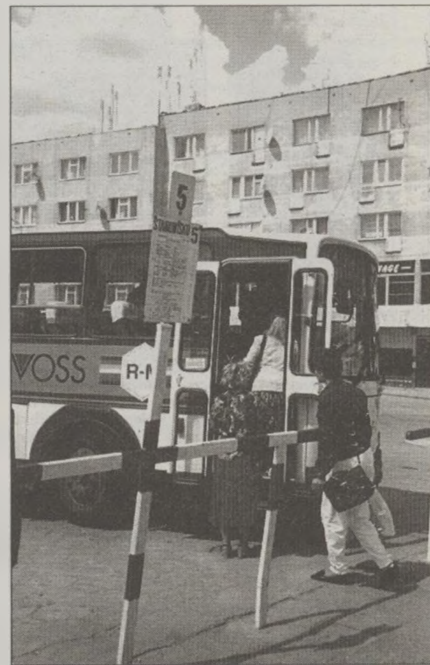
W soboty, niedziele i święta PKS będzie obsługiwał pasażerów tak, jak do tej pory, tzn. sporadycznie.