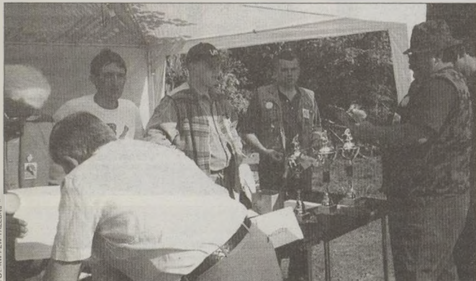
Przed ogłoszeniem wyników.