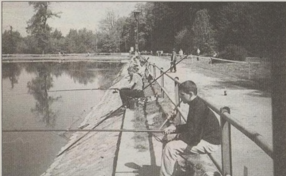
Wzdłuż brzegu kilkunastu wędkarzy próbowało złowić taaką rybę, tymczasem brały tylko płotki.

(TRZEBNICA) Jedna kobieta i trzydziestu czterech mężczyzn moczyło kiję w ub. niedzielę na łowisku leśnym w Trzebnicy podczas corocznych zawodów wędkarskich o Puchar Baryczy.