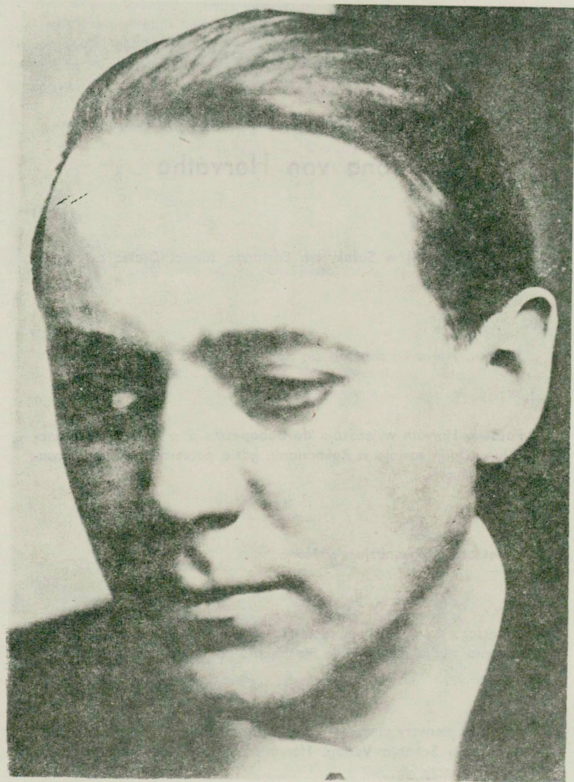
Odön von Horváth