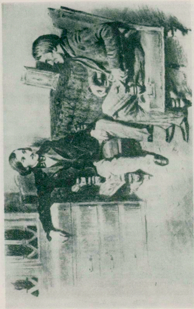
B. Lebediew: BIELIŃSKI U GOGOLA. (Olej, 1947).