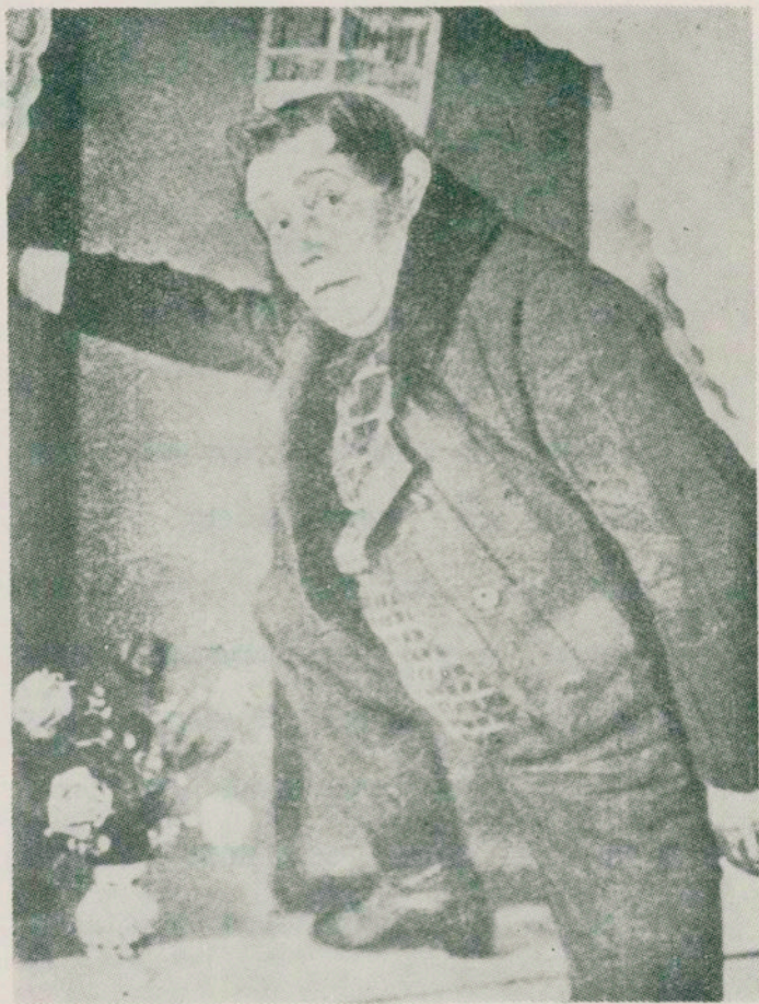
STEFAN JARACZ jako Podkolesin w „Ożenku”.