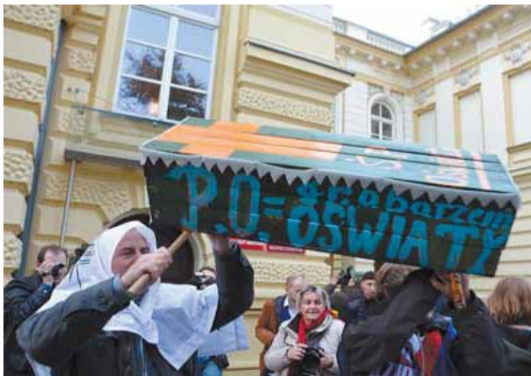
Przedstawiciele związków wspólnie wnieśli symboliczną trumnę pod siedzibę rządu