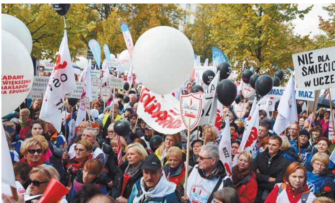
Kilkadziesiąt tysięcy pracowników oświaty zgromadzonych przed Urzędem Rady Ministrów nie zrobiło wrażenia na wielu mediach. Tę historyczną pikietę przemilczano.

Nigdy jeszcze w Dzień Edukacji Narodowej nie było takiego protestu. Dwa najważniejsze związki oświatowe, NSZZ „Solidarność” i ZNP, wspólnie manifestowały swoje oburzenie wobec polityki rządu.