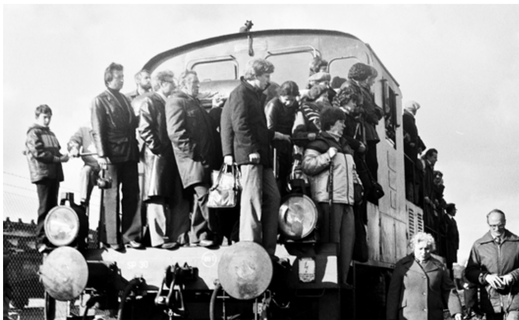
Przed świetlicą lokomotywowni tłum był ogromny. Ludzie zajmowali wszystkie dostępne miejsca.