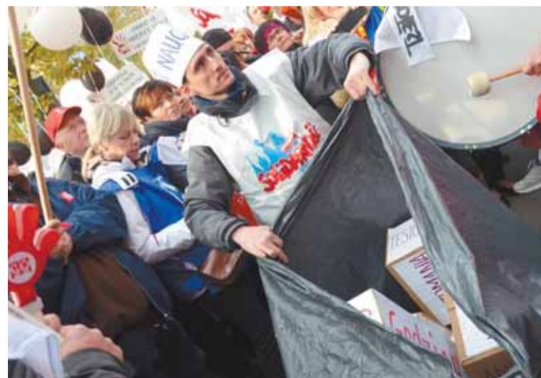
Wór zapelnia się szybko. A wszystko to spada na barki każdego nauczyciela.