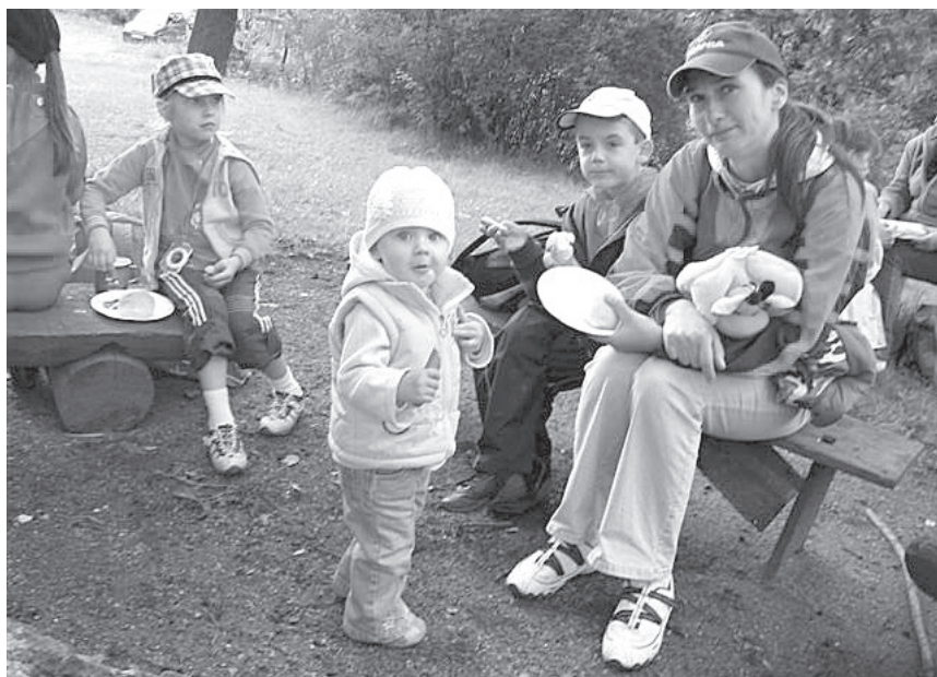
XXV Rajd (2009) – Rajdowicze i osoby towarzyszące