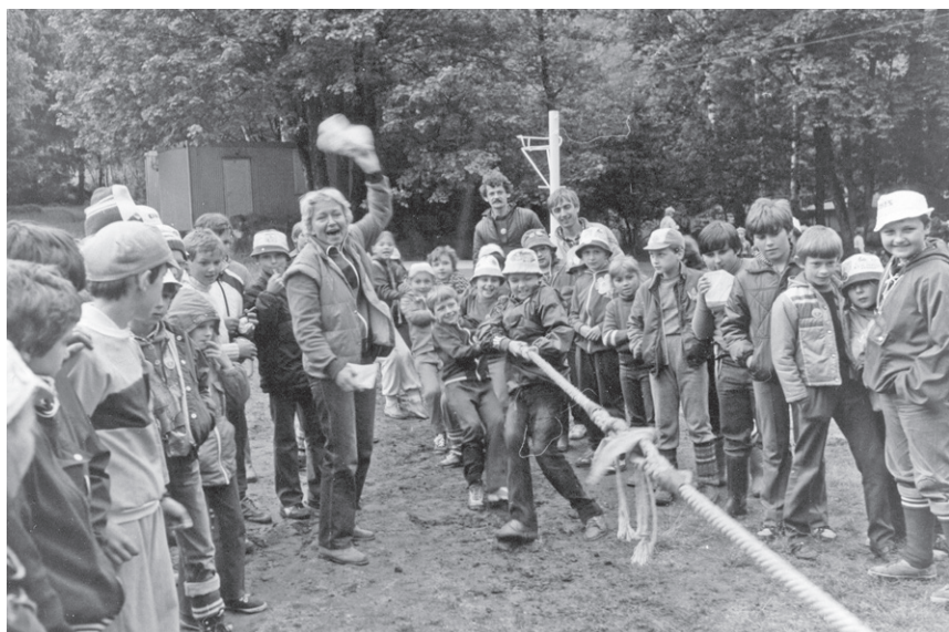
II Rajd ('86) – Radość opiekunki z SP 2 Piechowice