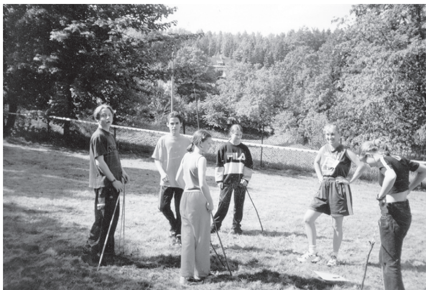
XV Rajd ('99) – Konkursy zręcznościowe (organizatorzy)