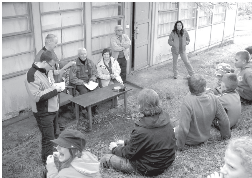
XXV Rajd (2009) – Konkurs wiedzy o Piechowicach, PTSM i LOP