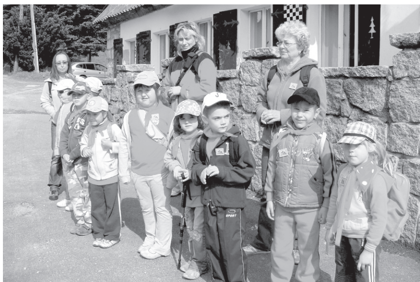
XXV Rajd (2009) – Przedszkole nr 2