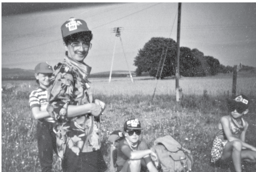
VIII Rajd ('92) – Odpoczynek na trasie