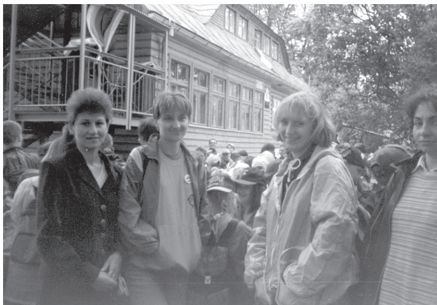
XVI Rajd (2000) – Ekipa z SP Porajów