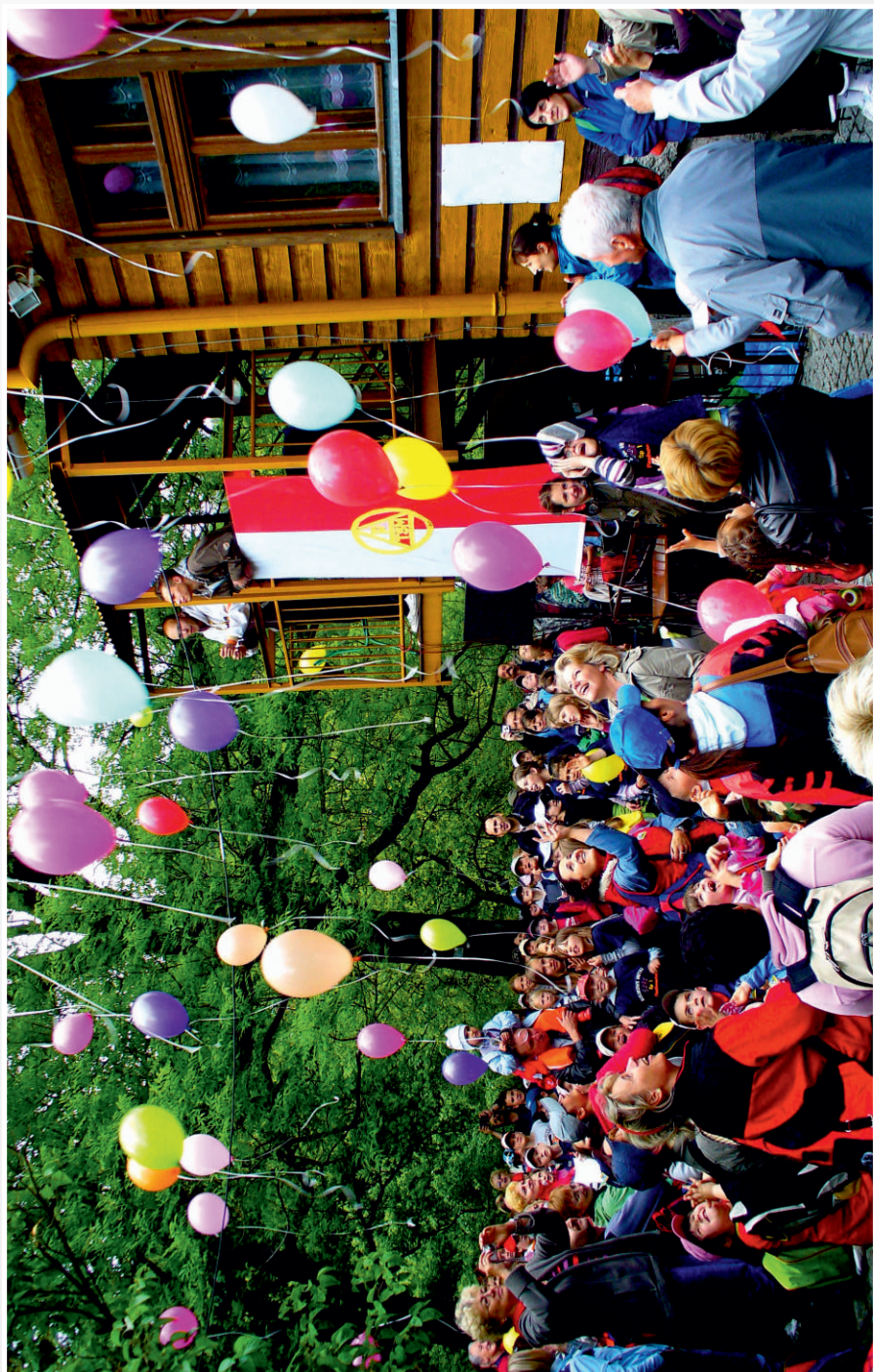
XXV Rajd (2009) – Balony – symbol radości z okazji Jubileuszu „Piechotki”