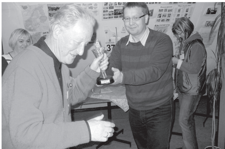
Spotkanie jubileuszowe – Nagroda burmistrza Bogatyni dla ZO PTSM w Jeleniej Górze