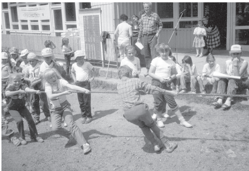
VI Rajd ('90) – Walczymy kto mocniejszy