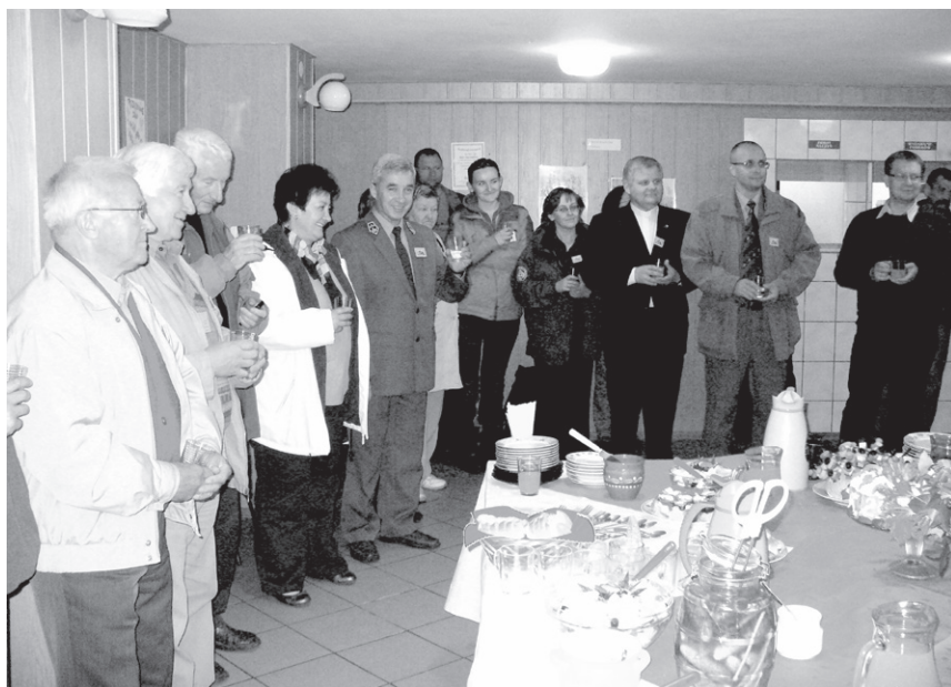
Spotkanie jubileuszowe – Mała feta w jadalni schroniska