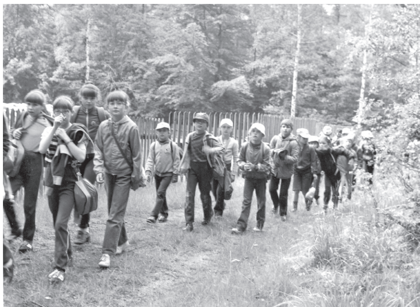
I Rajd ('85) – Do mety