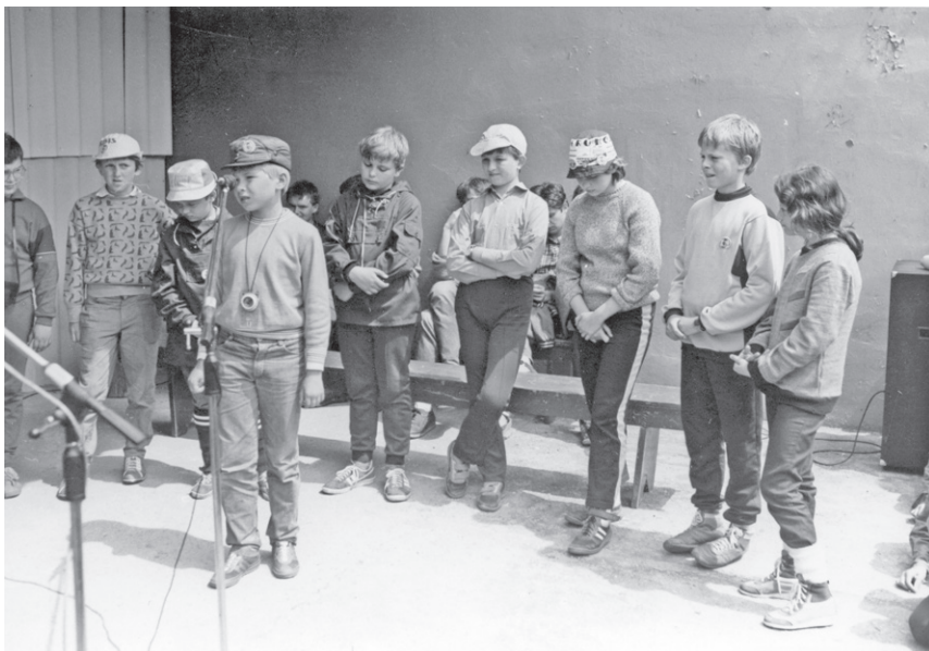
III Rajd ('87) – Konkurs wiedzy o Piechowicach i PTSM