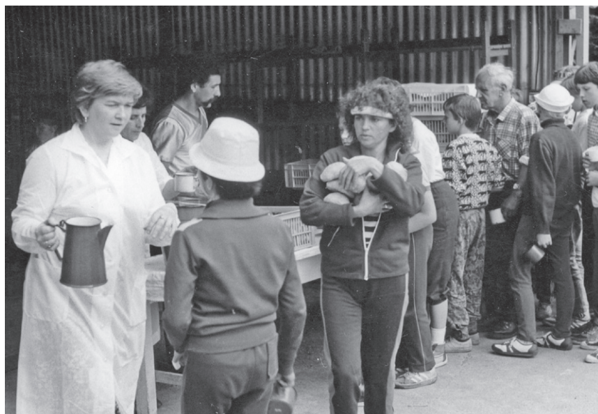
IV Rajd ('88) – Po kietbaski