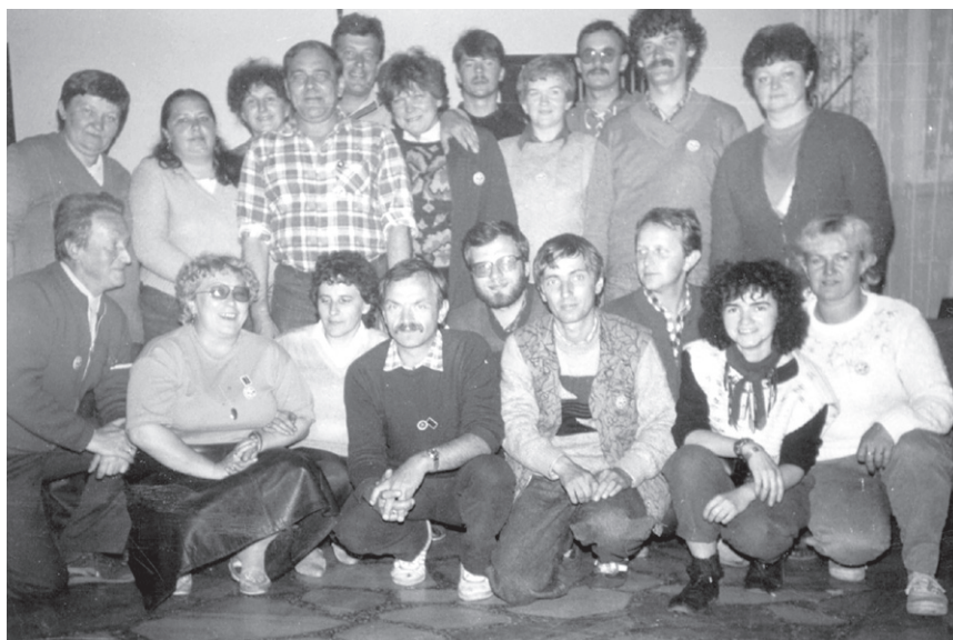
V Rajd ('89) – Zdjęcie „rodzinne” organizatorów