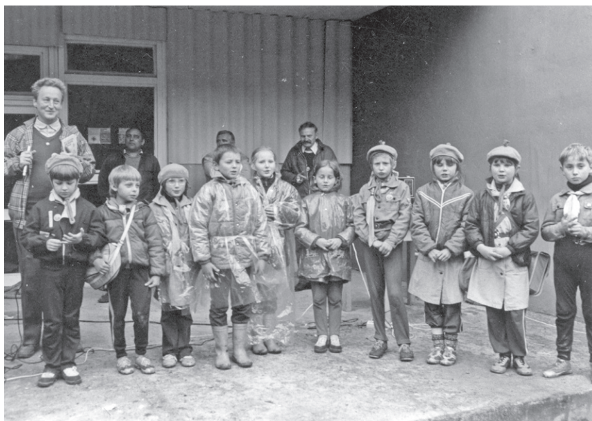
II Rajd ('86) – Cała szkoła w jednej drużynie (SP Michałowice)