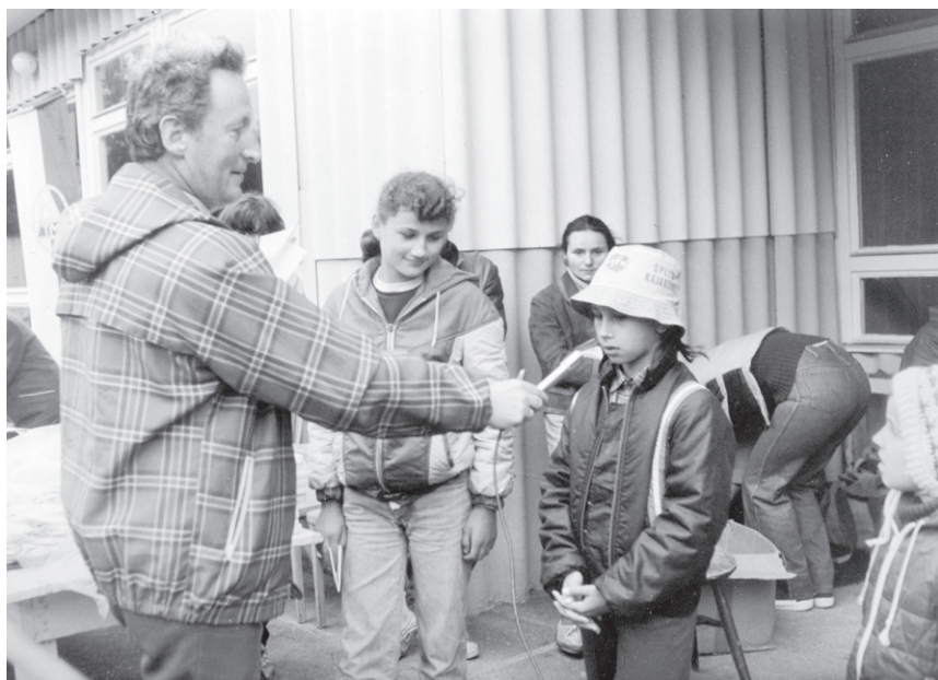
II Rajd ('86) – Konkurs wiedzy o Piechowicach