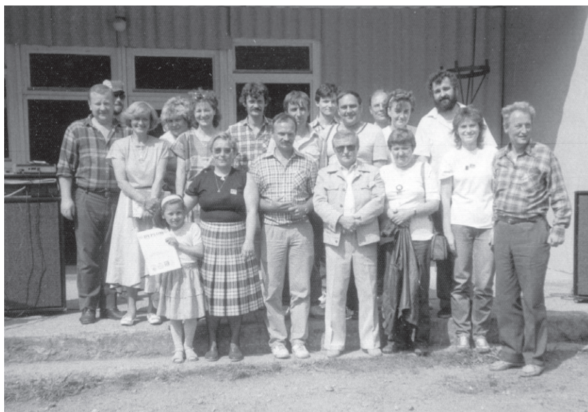
VI Rajd ('90) – Organizatorzy wreszcie razem