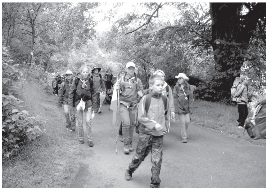
XXV Rajd (2009) – Do mety