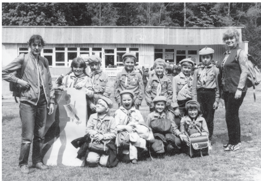
III Rajd ('87) – Drużyna z SP Michałowice