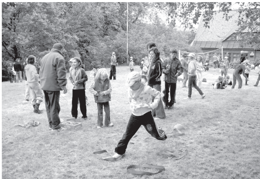
XXV Rajd (2009) – Konkursy zręcznościowe