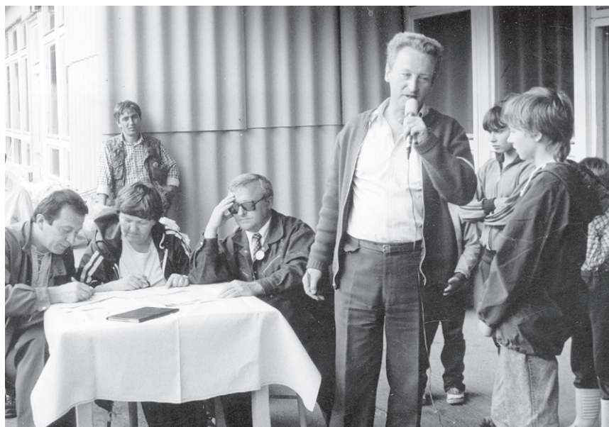
IV Rajd ('88) – Jurorzy konkursu wiedzy o...