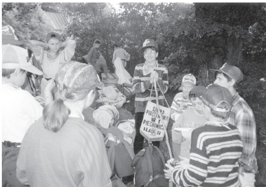
VIII Rajd ('92) – Drużyna z SP 1 Piechowice