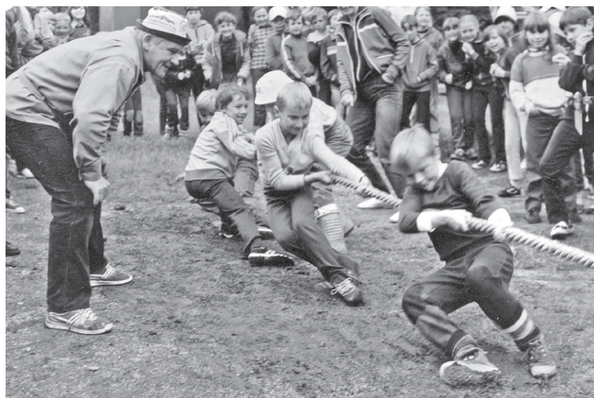
I Rajd ('85) – Konkurs przeciągania liny