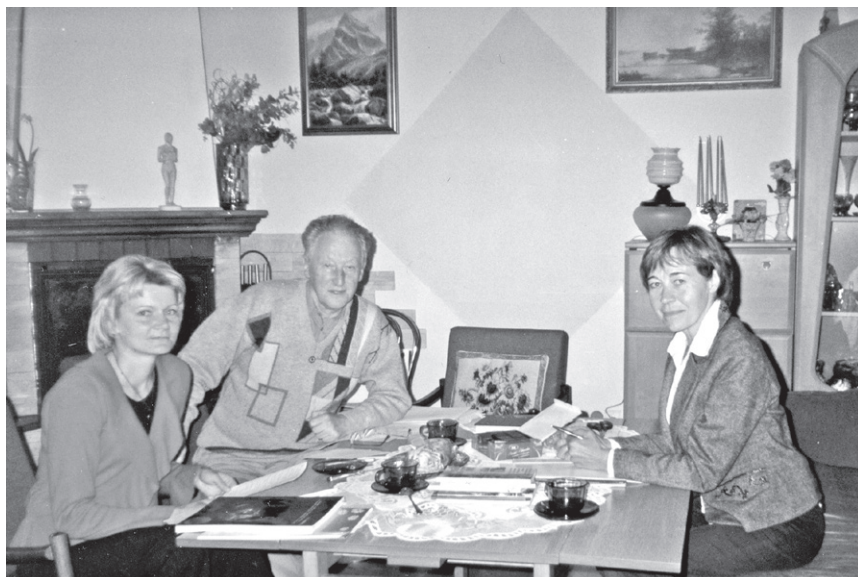
II Zebranie rady redakcyjnej „Kroniki”, 7 maja 2009