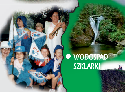
● WODOSPAD SZKLARKI