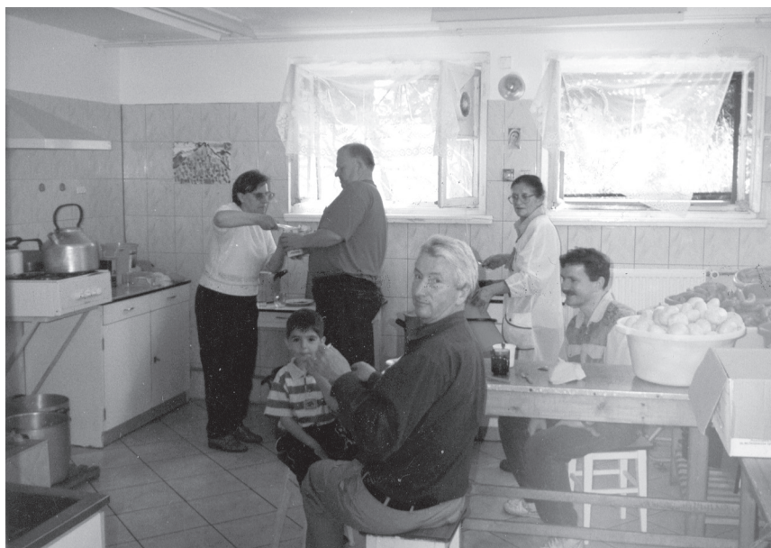
XV Raid ( '99) – Organizatorzy uzupełniają siły