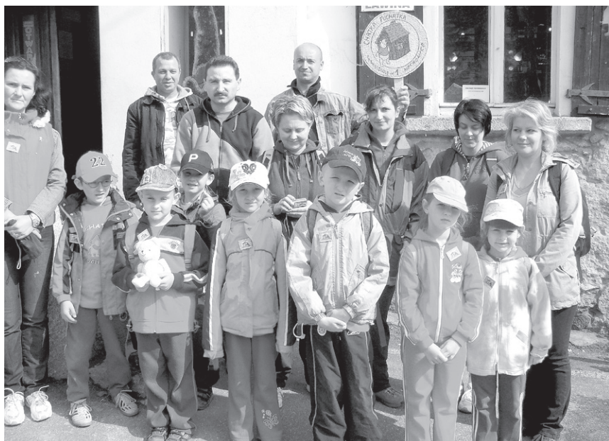
XXV Rajd (2009) – Przedszkolaki na trasie (Przedszkole nr 1)