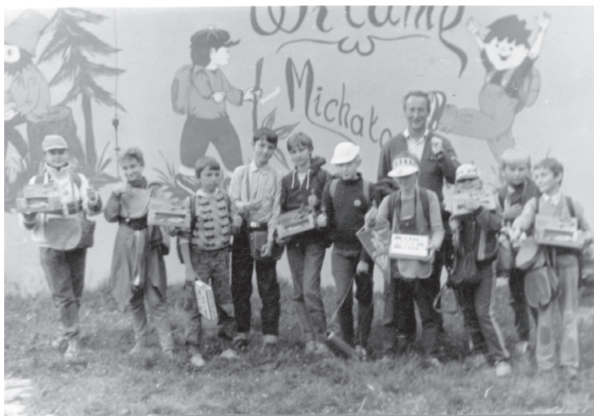
IV Rajd ('88) – Laureaci