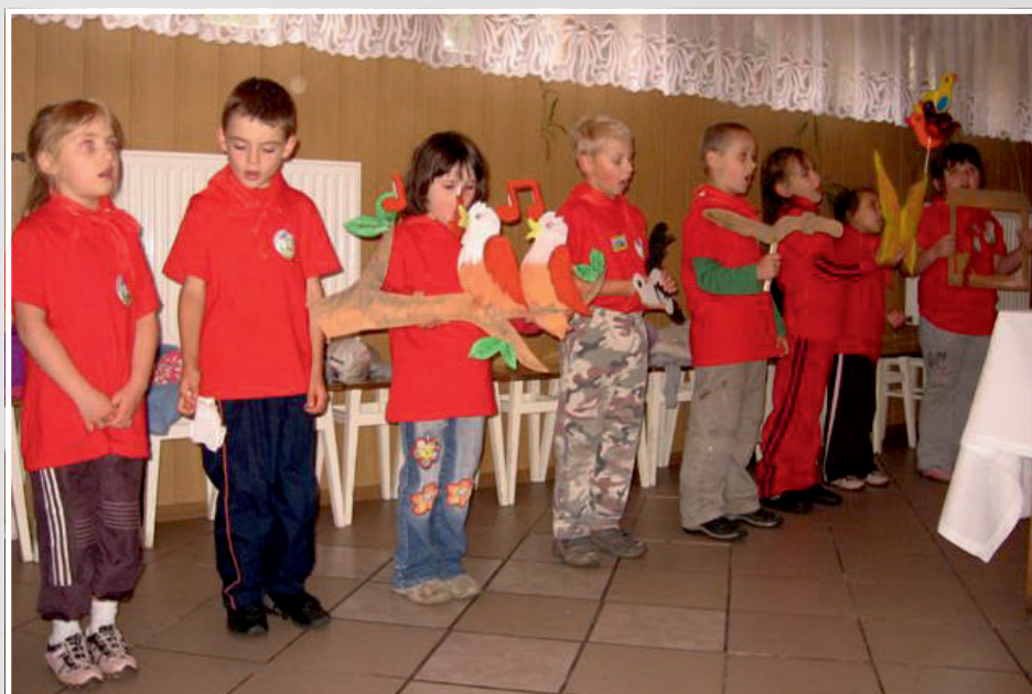
XXV Rajd (2009) – Młodzi artyści w konkursie inscenizacji