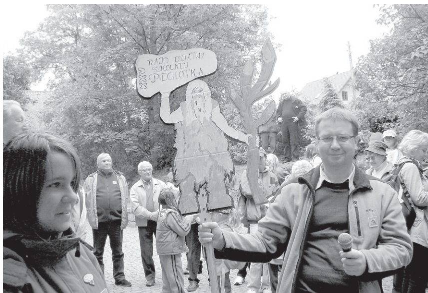
XXV Rajd (2009) – Najciekawszy totem