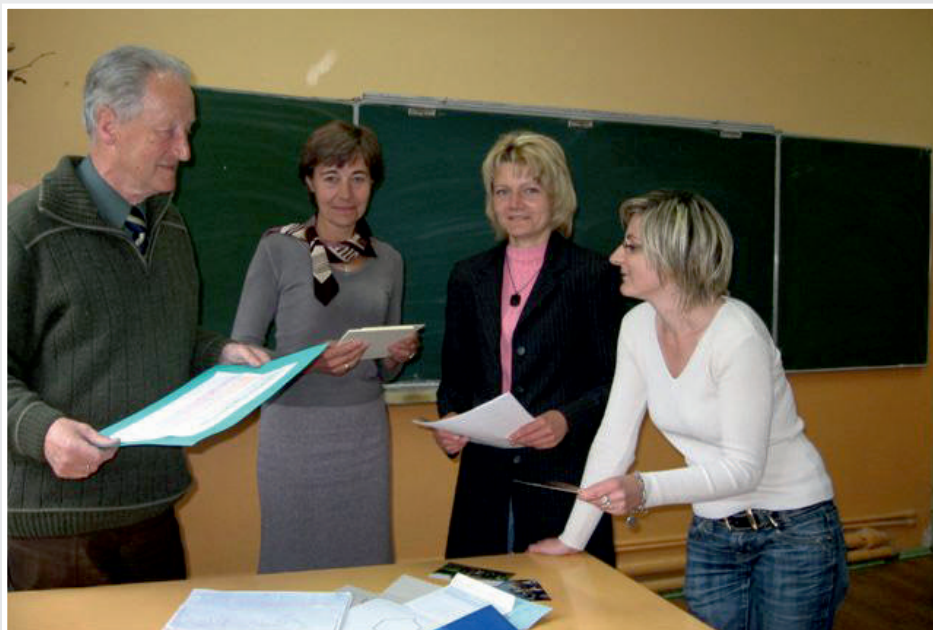
Spotkanie rady redakcyjnej 28 V 2009 w SP 1 w Piechowicach