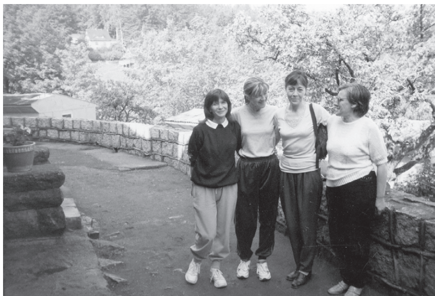
XV Rajd ('99) – Uroczce organizatorki