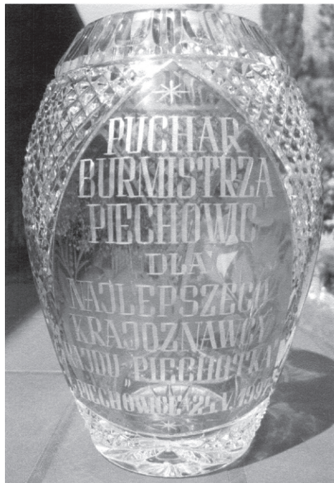
XIII Raid ('97) – Puchar Natalii Kozdry z SP 1 w Piechowicach