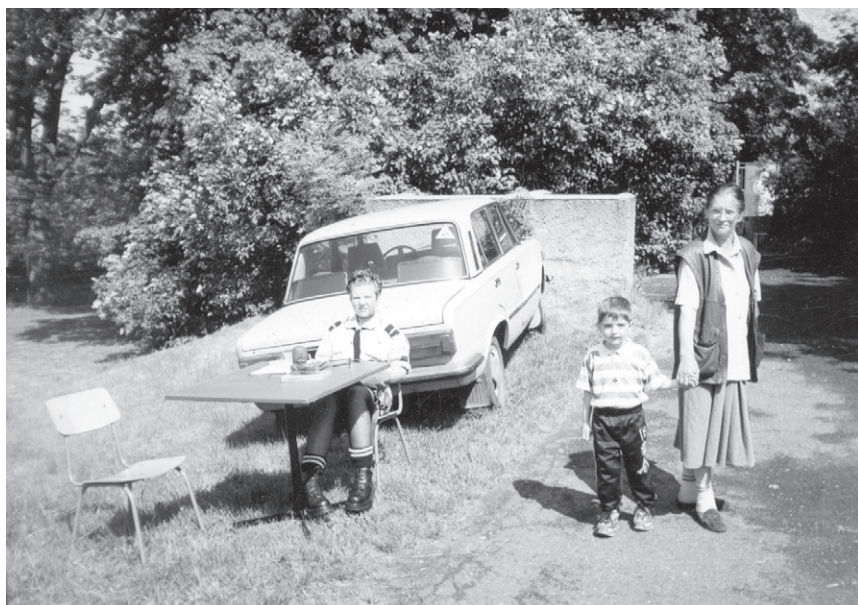
XV Rajd ('99) – Punkt przyjęć na mecie