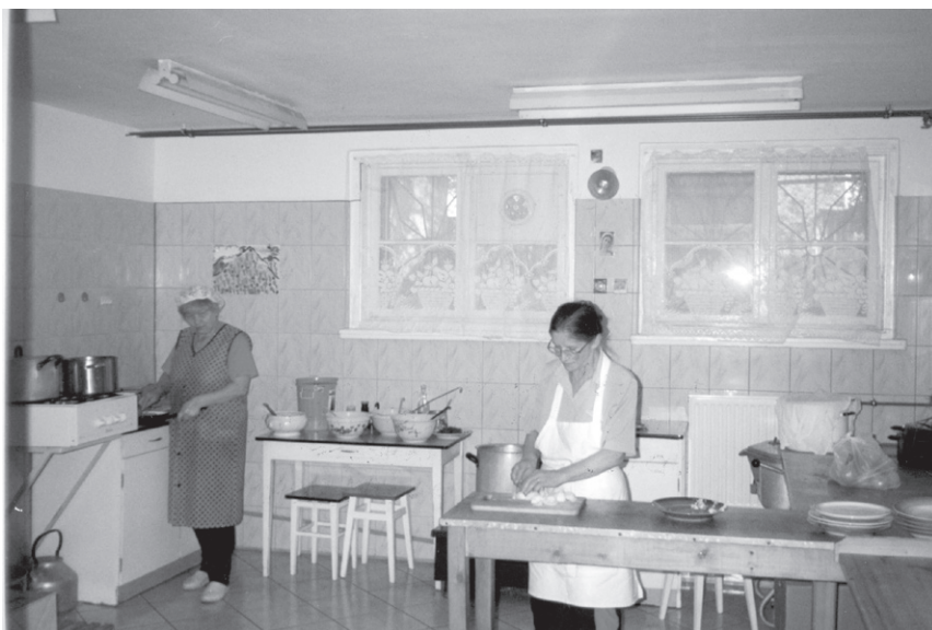
XIV Raid ( '98) – Kuchnia przygotowująca obiady