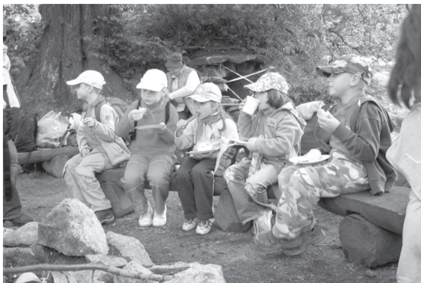
XXV Rajd (2009) – Po udanym marszu kiełbaski i herbata bardzo smakują