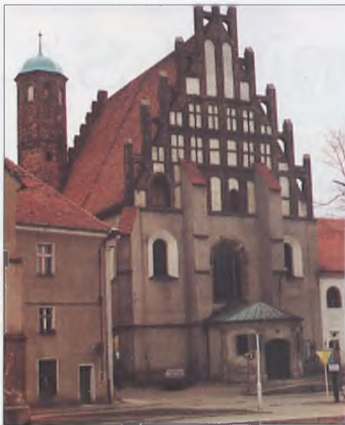
Zespół Poklasztorny Franciszkanów