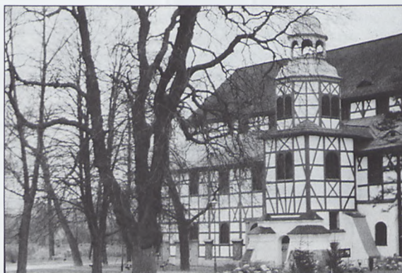
Wieża Kościoła Pokoju