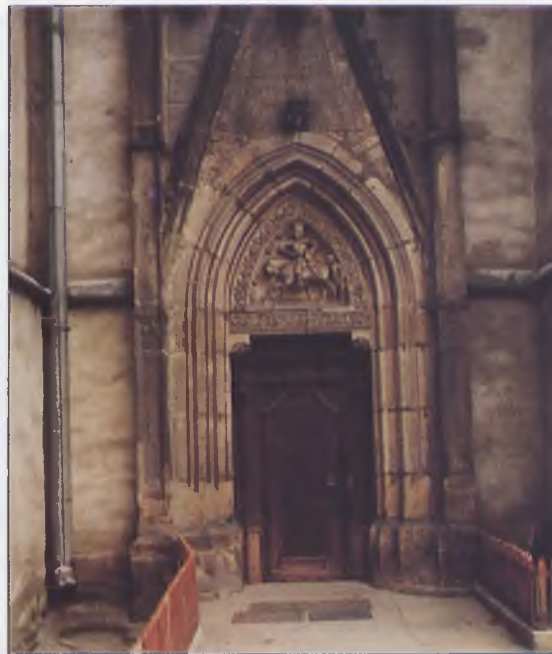
Kościół św. Marcina - portal

Wybudowana w XVI w. Zachowane sklepienia kolebkowe z lunetami, sieciowe i krzyżowe oraz strop malowany z XVII w. Wejście jest obramione portalem renesansowym z 1573 r.