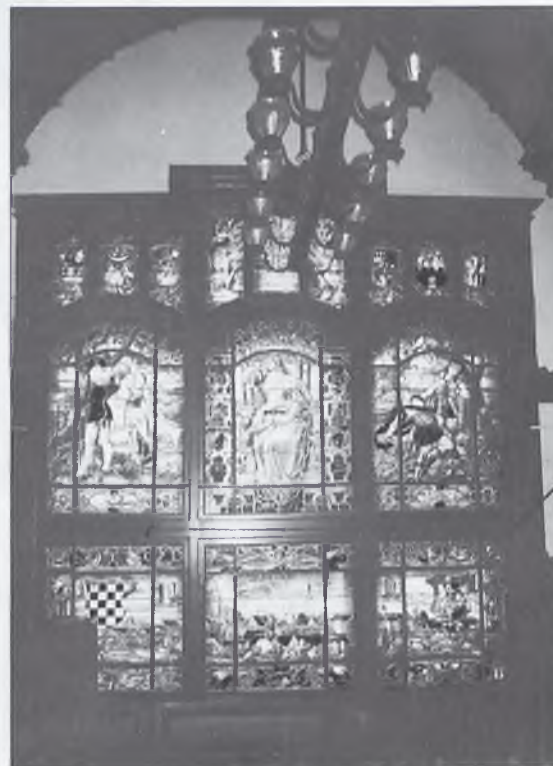
Ratusz - witraż w sali narad

Obecnie miasto liczy 25.519 mieszkańców i zajmuje 19 km 2