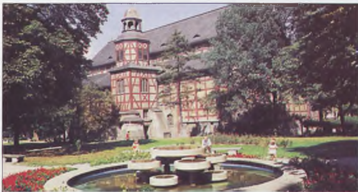
Kościół Pokoju pw. Ducha Świętego

Dla stałych Klientów oferujemy korzystne warunki płatności.