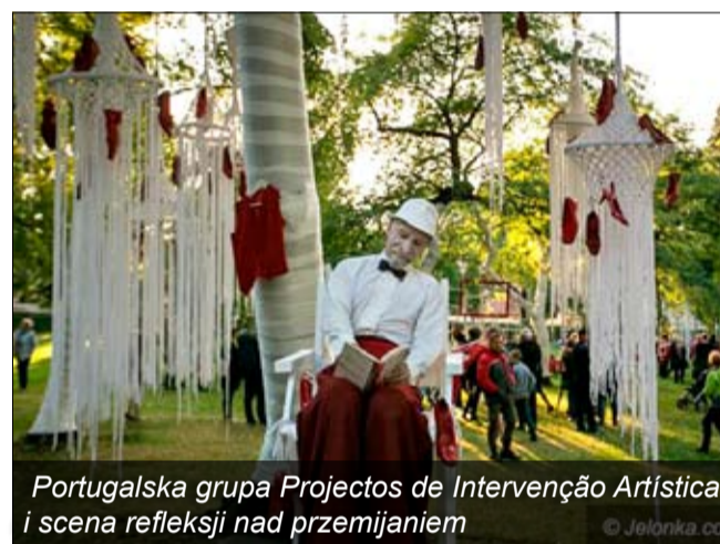
Portugalska grupa Projectos de Intervenção Artística i scena refleksji nad przemijaniem

Taki monitoring przeprowadzono w ośmiu polskich miastach. Wszystko to w ramach projektu „Monitoring realizacji polityki senioralnej na poziomie miast” finansowanego ze środków EOG w ramach Programu Obywatela dla Demokracji, którego celem jest wsparcie seniorów i ich organizacji w próbach wprowadzenia zmian w swoich miastach.