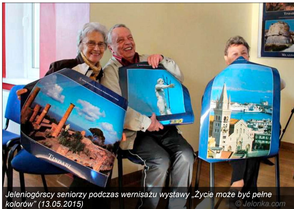
Jeleniogórcy seniorzy podczas wernisażu wystawy „Życie może być pełne kolorów” (13.05.2015)

- Działania na rzecz osób starszych cały czas są podejmowane i o nich informujemy nie tylko na stronie internetowej miasta, ale także w lokalnych mediach czy na tablicach ogłoszeń – mówi naczelnik. – My, jako Miasto, nie robiliśmy żadnych ankiet dotyczących potrzeb i oczekiwań osób starszych, ale robimy je na bieżąco stowarzyszenia, które są do tego utworzone. To one organizują kursy komputerowe, zajęcia na basenie, spotkania w klubach seniorów, ćwiczenia na powietrzu. Natomiast Miasto te działania wspiera finansowo. Naszym zdaniem, nie powinno się tworzyć zamkniętych grup osób starszych, niepełnosprawnych czy np. ubogich, patologicznych itp. Seniorzy, jak i osoby niepełnosprawne, powinni przebywać wśród tzw. pełnosprawnych i integrować się z nimi. Trzeba uświadomić sobie, że kiedyś wszyscy będziemy starzy i w jakimś stopniu niepełnosprawni, niedomagający. Miasto wychodząc z takiego założenia nie przygotowywało polityki senioralnej, ale posiada politykę wobec osób niepełnosprawnych i to naszym zdaniem jest zbliżone. W najbliższym czasie mają się pojawić również pieniądze unijne na działalność m.in. na rzecz seniorów. Miasto będzie starało się o te pieniądze