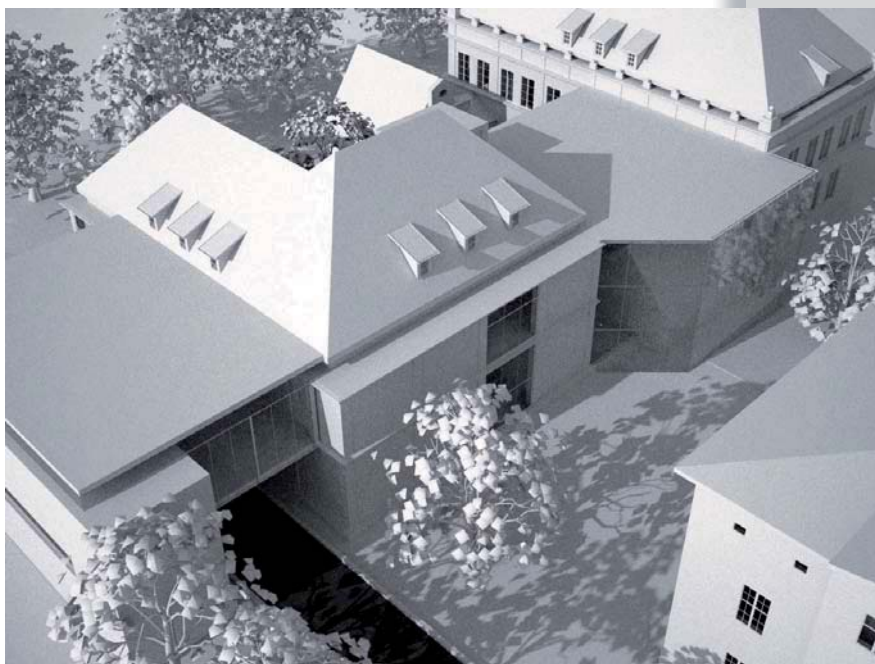
Wizualizacja nowego budynku Siedziby Głównej Muzeum Karkonoskiego w Jeleniej Górze (opracowanie: „Arch-E” Wrocław).