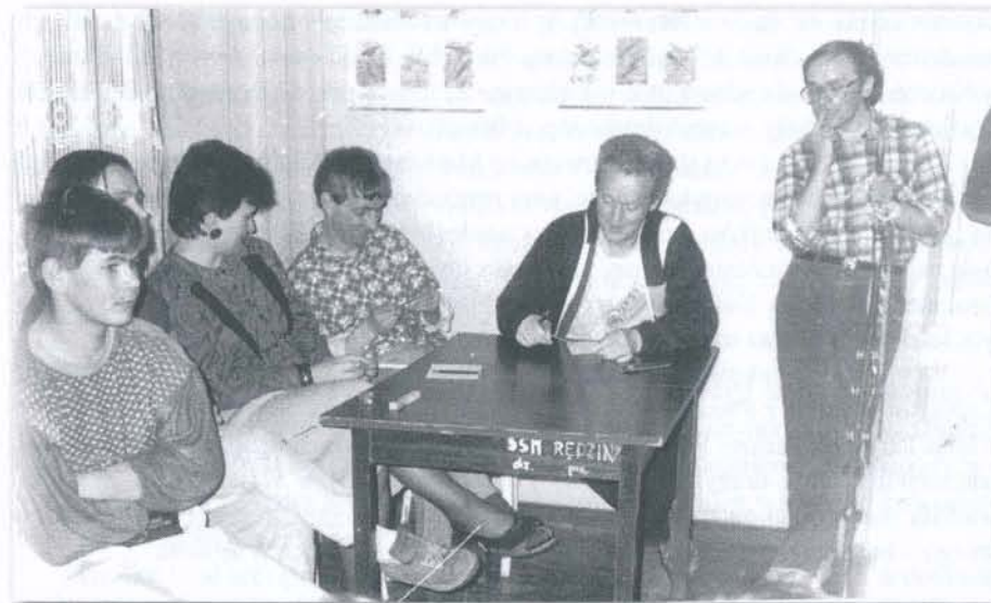
III Zlot 1991. Konkurs krajoznawczy w Rędzinach (SSM Dolomit)