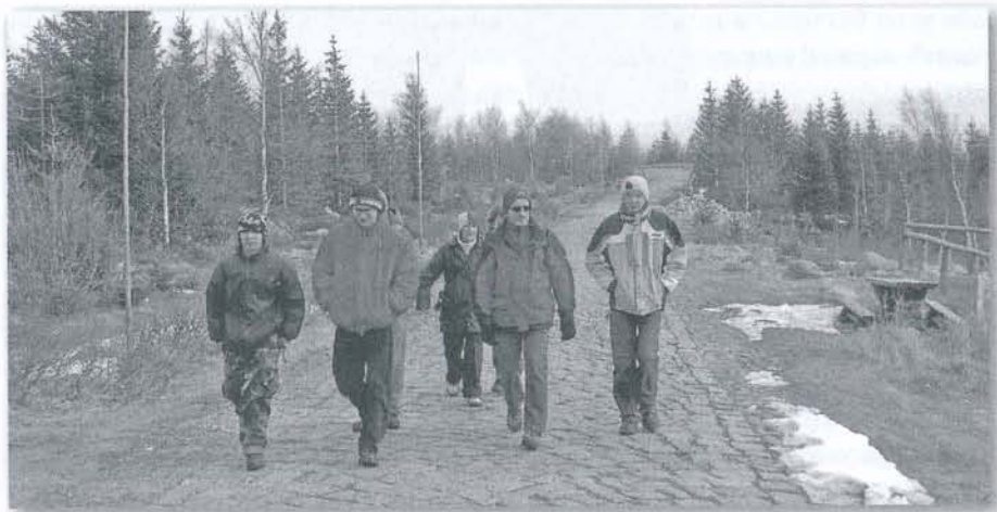
XIX Zlot 2008. Drużyna z Gimnazjum w Lubawce na trasie