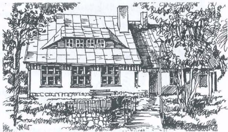
d. SSM „Sokolik” w Strużnicy (czynne do 2007 r.)