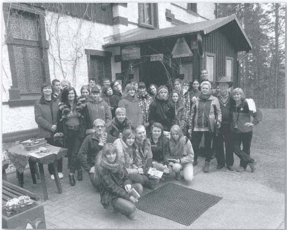
Uczestnicy XXV Zlotu

się koniecznym ze względów m. in. pogodowych, a także spodziewanych trudności z popularyzacją części narciarskiej. Jak dobrze, że tak ustalono potwierdziła to historia kolejnych edycji Zlotu. Tutaj nasuwa mi się analogia z trasami kolarskimi na Rajdzie Kuratorskim – im więcej społeczeństwo miało rowerów, w tym doskonałych górskich, tym mniej przychodziło na Rajd drużyn kolarskich i wreszcie trzeba było zrezygnować całkowicie z organizowania tras kolarskich. A przecież z turystyką i popularnym bieganiem lub spacerowaniem narciarskim jest podobnie. W czym zatem tkwi problem?!