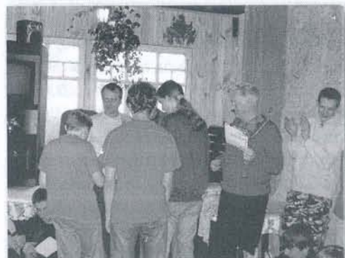
Drużyna z SP Miskowice na mecie XIX Zlotu