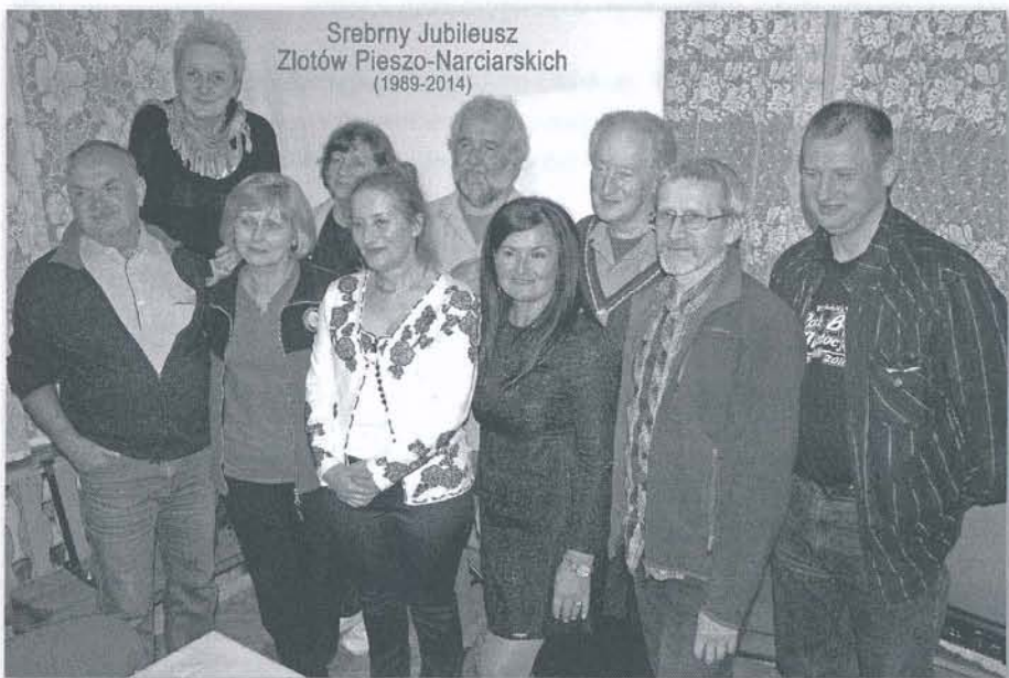
Srebrny Jubileusz Złotów Pieszo-Narciarskich (1989-2014)