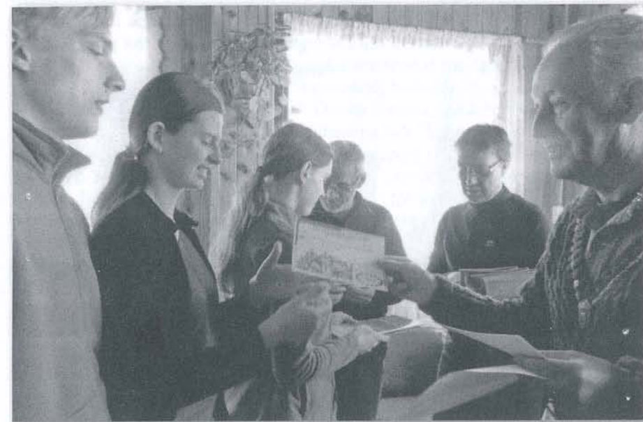
XXIV Zlot „Karpacz 2013”. Zwycięski Zespół z I LO Jelenia Góra

Większość ekip prowadzona przez bardzo doświadczonych opiekunów zaliczyła pierwszego dnia wędrowkę w Karkonoszach, gdzie było sporo śniegu, a w Karpaczu go jednak zabrakło. W sympatycznej atmosferze, chociaż nie zmieniła się zaciekłość rywalizacji, odbyły się dwa znaczące konkursy. Bardzo dobrze przygotowanie krajoznawcze zaprezentowała trójka reprezentująca Chełmsko Śląskie, która niespodzie-