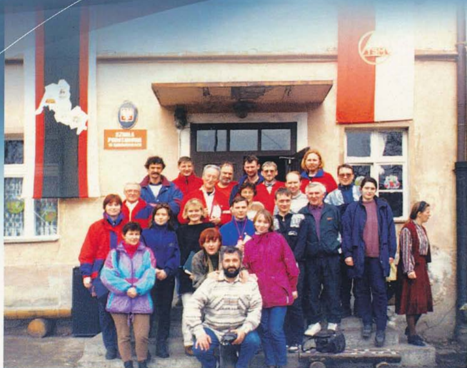
X Zlot 1998