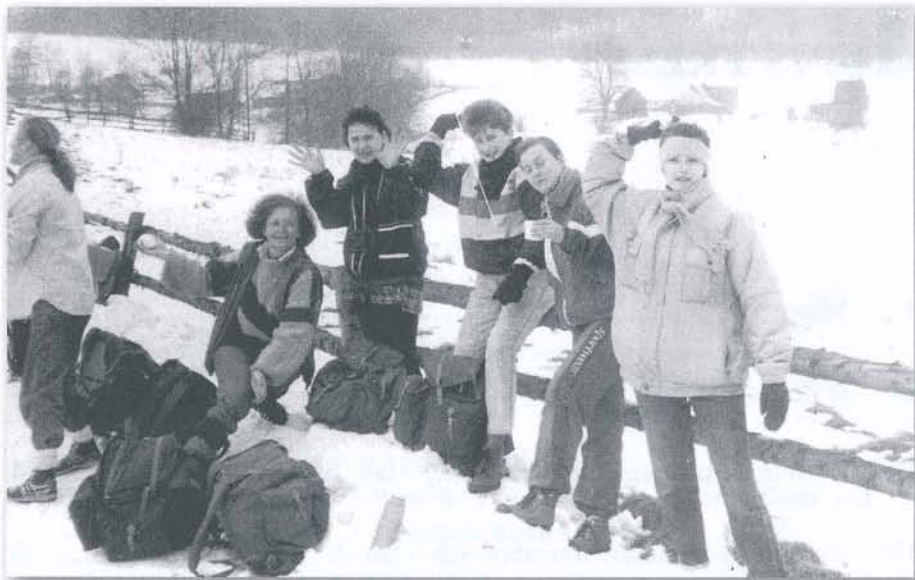
III Zlot PTSM „Rędziny 91”. Drużyna ZSMed. z Bolesławca