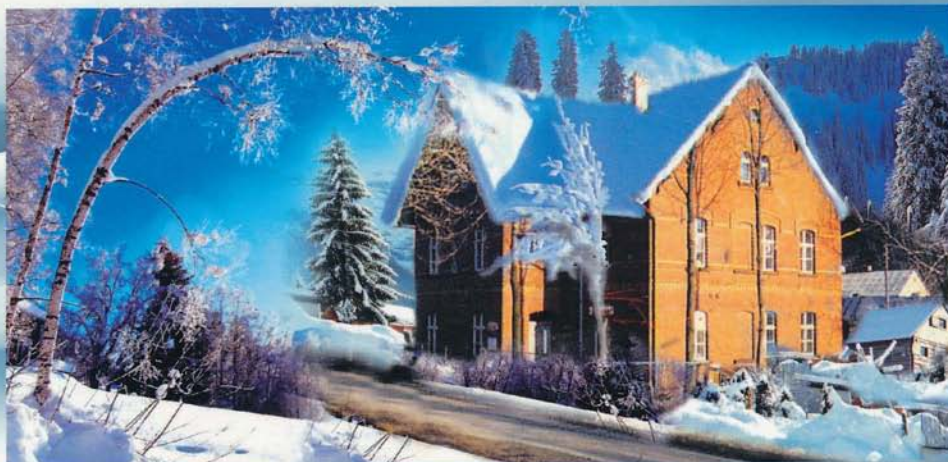
SSM „Dolomit” Rędziny