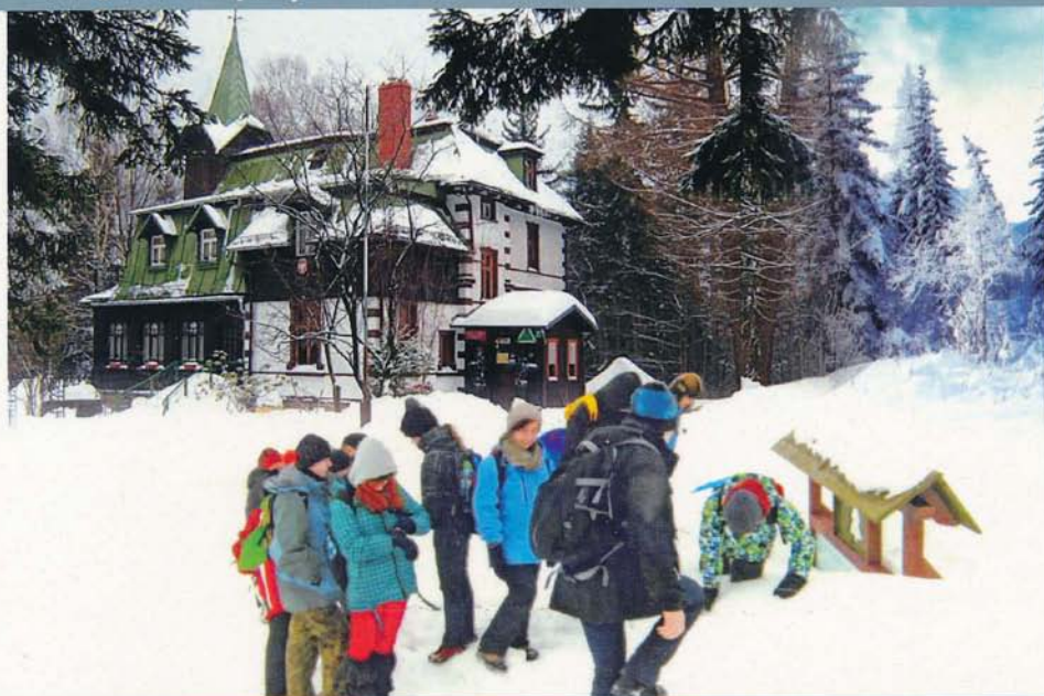
SSM „Liczyrzepa” Karpacz