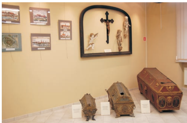
W izbie muzealnej jest wiele ciekawych eksponatów