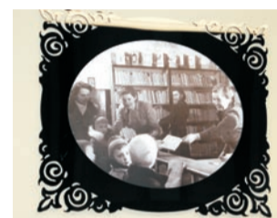
Ściany biblioteki zdobią stare fotografie

TEKST I FOT.: MONIKA GALUSZKA-SUCHARSKA msucharska@gazeta.olawa.pl