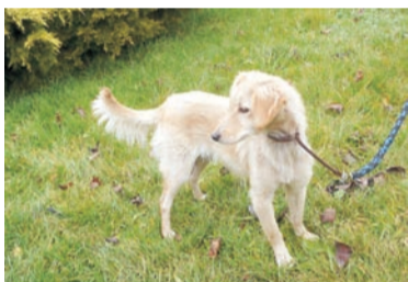
Młoda beżowa łagodna suczka, tel. 667-735-988