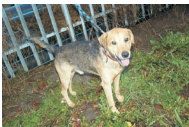
Terierowaty brązowo-czarny pies znaleziony w Oławie, tel. 504-211-752