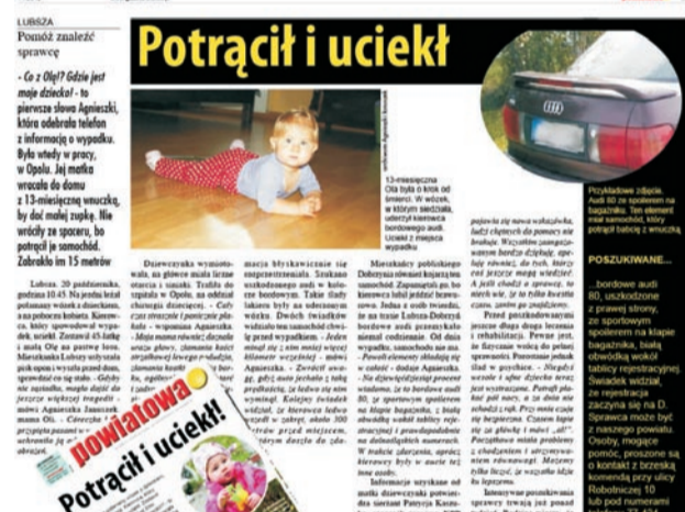
O tym wypadku pisaliśmy kilkakrotnie.

Zaraz po wypadku policjanci przesłuchali inne osoby, które twierdziły, że