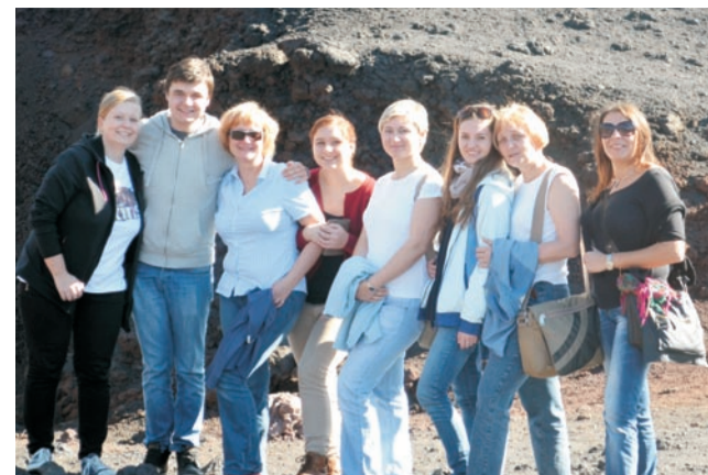
Uczniowie z nauczycielkami podziwiali sycylijskie krajobrazy

„Tworzenie Lokalnych Inkubatorów NGO w ramach Dolnośląskiej Sieci Doradztwa Pozarządowego” Projekt współfinansowany ze środków Unii Europejskiej w ramach Europejskiego Funduszu Społecznego