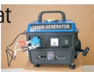
Odzyskany sprzęt trafił do właściciela

- Trwają ostatnie prace porządkowe na działkach - mówi podinsp. Alicja Jędo z KPP w Oławie. - Zadbajmy o to, żeby na zimowy czas nie