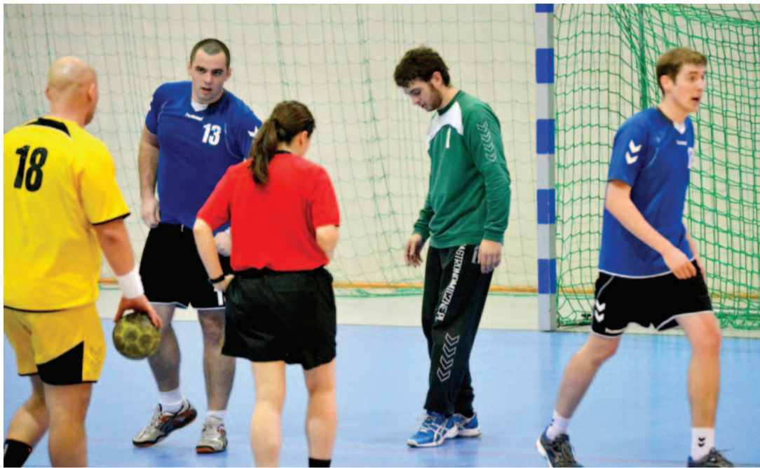
Oławscy szczypiorniści (niebiesko-czarne stroje) przegrali pierwszy mecz w sezonie, w roli gospodarza