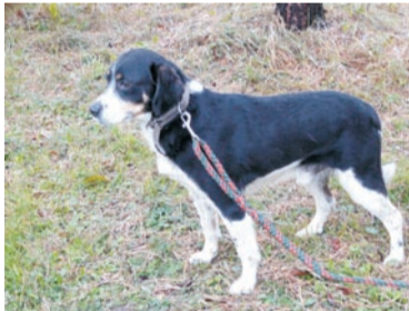
Młody mieszaniec beagle, tel. 667-735-988