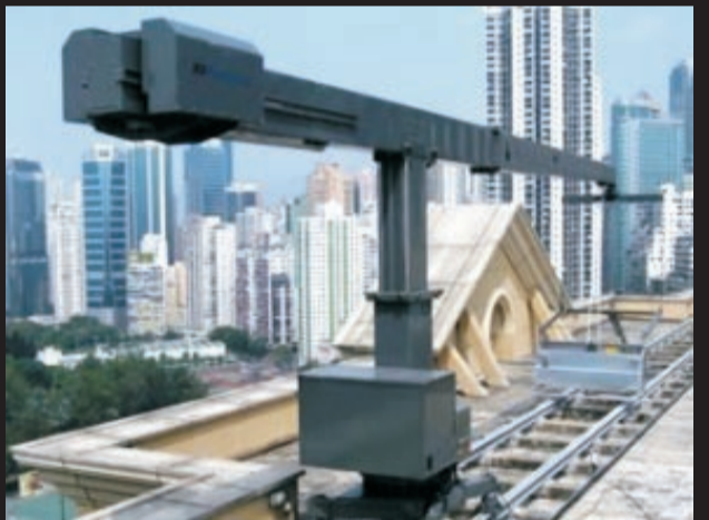
Mało kto wie, że dźwigi na wieżowcach w Dubaju pochodzą z Oławy