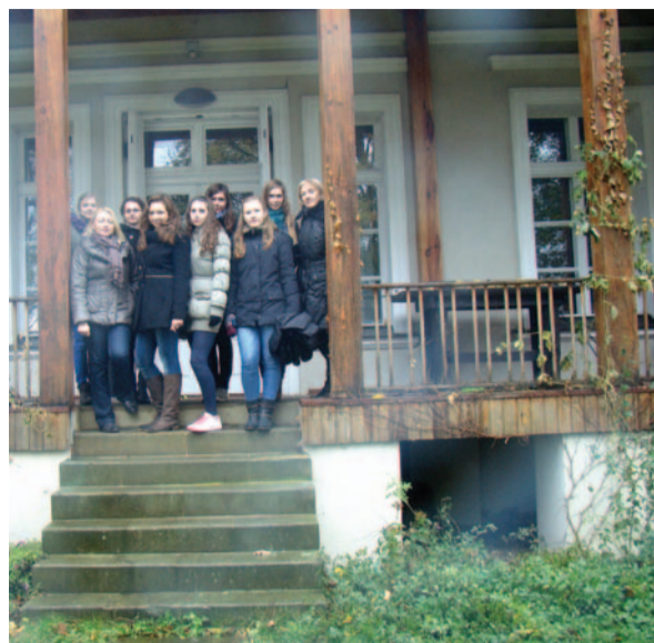
Oławscy uczniowie wiele się dowiedzieli podczas polsko-niemieckiego spotkania

- Wycieczka wywarła bardzo dobre wrażenie na wszystkich uczestnikach - mówią uczniowie. - Dowiedzieliśmy się dużo o najnowszej historii polsko-