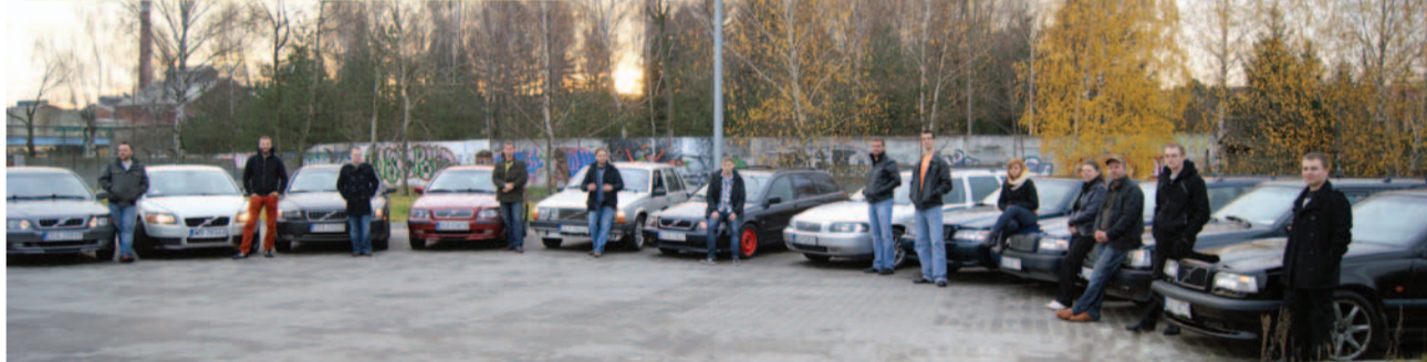
Miłośnicy volvo organizują akcję mikołajkową dla podopiecznych „Tęczy”. Kochasz samochody i lubisz pomagać? Dołącz do nich!

Do 5 grudnia prześlij swoje zgłoszenie na adres: olek@volvopasja.pl