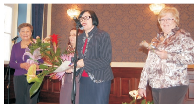
Gratulacje od bibliotekarek