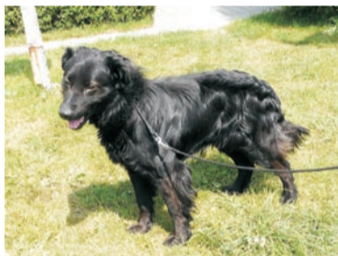
Czarny długowłosy młody mieszaniec, tel. 667-735-98