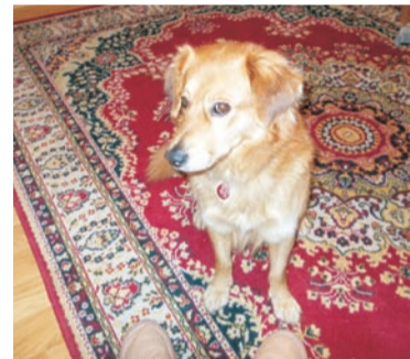
Trzyletni pies, bardzo spokojny, lubi zabawy z dziećmi, ułożony, zaszczepiony, odrobaczony, nadaje się do pilnowania posesji, tel. 604-469-525