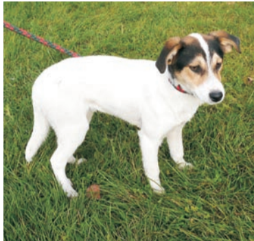
4,5-miesięczny mieszaniec, tel. 667-735-988