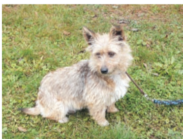
Znaleziono w Wiązowie 7-miesięczną suczkę (mieszaniec), tel. 667-735-988