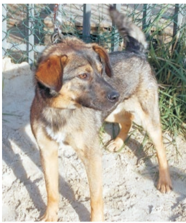
Roczny wykastrowany pilnujący wesoły mieszaniec, tel. 504-211-752