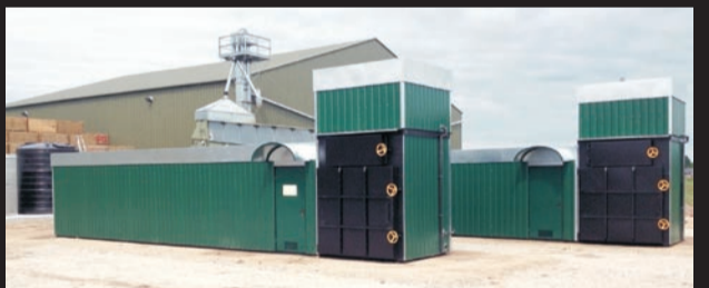
Takie kontenery z „Metalergu” ogrzewają hale w Szkocji