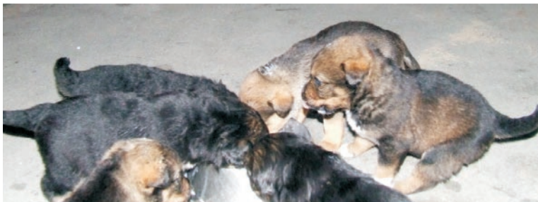
4 suczki i piesek, będą średniej wielkości, tel 783-033-536