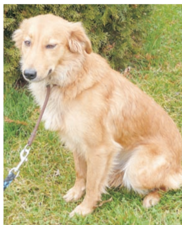
Roczna suczka, mieszaniec, tel. 667-735-988