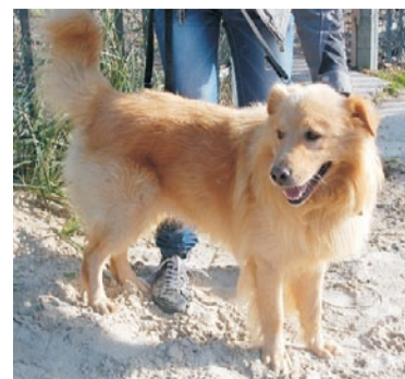
Łagodny mądry wykastrowany spokojny, pilnujący mieszaniec goldena, tel. 504-211-752