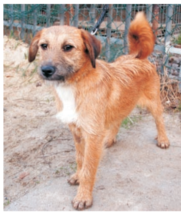
Wysterylizowana 6-miesięczna łagodna terierka, tel. 504-211-752