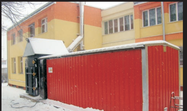
Jedną ze świętokrzyskich szkół ogrzewa taki kontener z kotłem na słomę