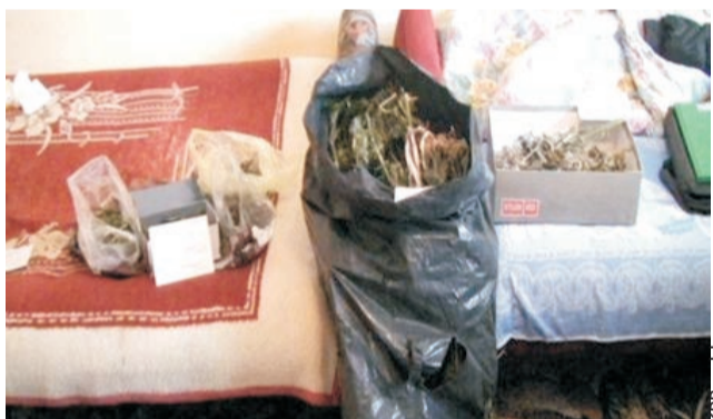
Zbiory zabezpieczyła policja