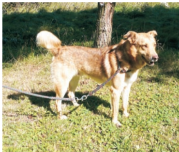
Roczny beżowo-rudy mieszaniec, tel. 667-735-988