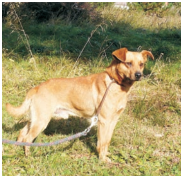
Młody rudy łagodny piesek, tel. 667-735-988