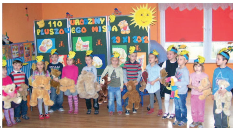
Dzieci bawiły się na imprezie w przedszkolu