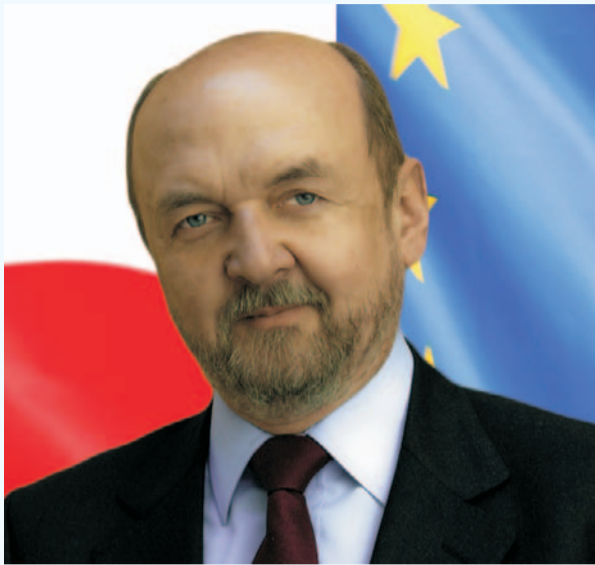
prof. Ryszard Legutko

Obserwując codzienną praktykę polityczną w Polsce można odnieść wrażenie, że najważniejsze cele liczą się w najmniejszym stopniu. Chęć przeciwstawienia się tej praktyce jest moim głównym motywem, którym kierowałem się przy powołaniu Instytutu Wspólne Sprawy. Po konferencjach w Legnicy, Wrocławiu i Jeleniej Górze poświęconych przyszłości wydobywania złóż miedzi, żeglowności Odry i kondycji szkolnictwa zawodowego tym razem powracamy do Wrocławia z tematem przyszłości transportu publicznego.