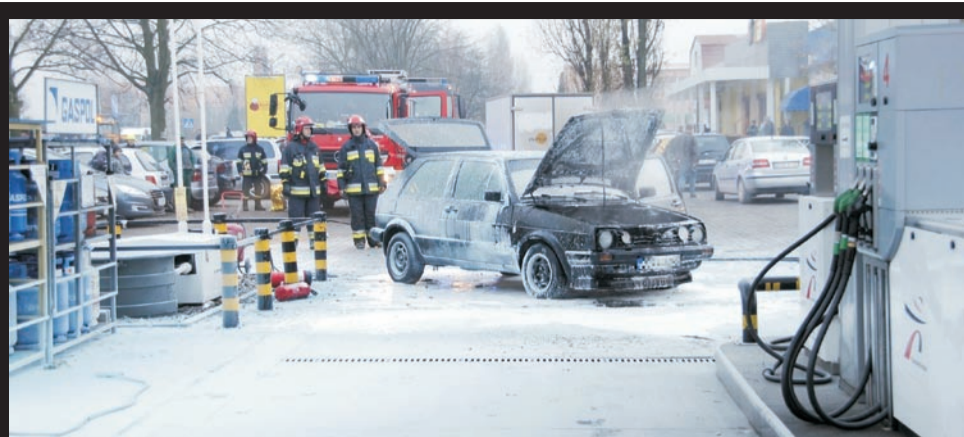
Volkswagen zapalił się tuż przy stacji benzynowej „Muszkieterowie”, w centrum miasta