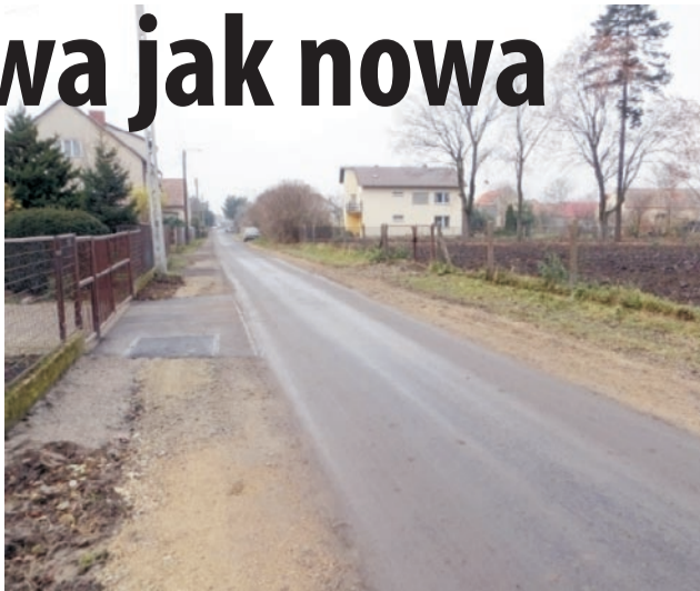
Półkilometrowy odcinek drogi jest już wyremontowany

19 listopada uczestniczyli w odbiorze inwestycji urzędnicy, radni, sołtys Domaniowa i przedstawiciele firmy „Remdro” oraz pracownik Urzędu Marszałkowskiego. (AH)