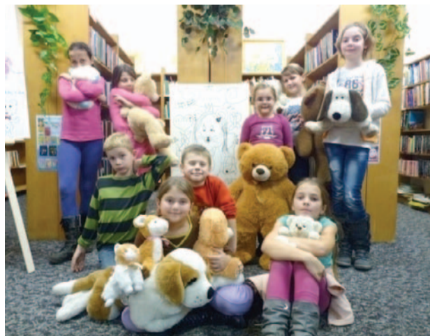
Tak było w Domaniowie. Dzieci i ich misiowe dzieło