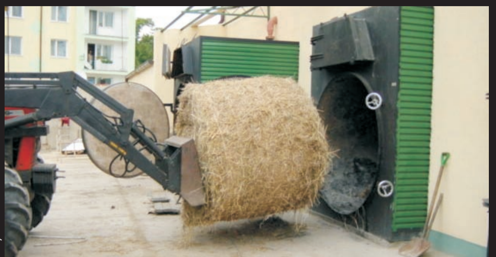
Całe osiedle pod Gnieznem jest ogrzewane kotłami z „Metalergu”