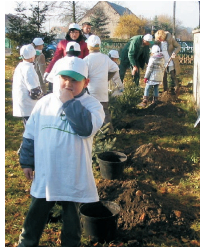
Akcja sadzenia drzew w ramach projektu „SCA - Tree Pool 2012”