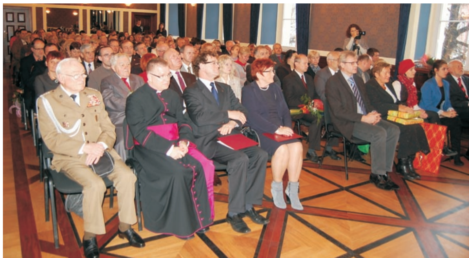
Oficjalna część uroczystości odbyła się w sali rajców olawskiego ratusza