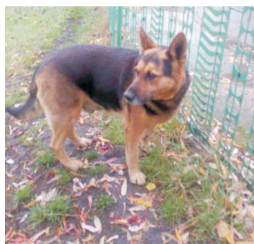
Owczarek niemiecki wykastrowany łagodny, pilnujący, tel. 501-106-007