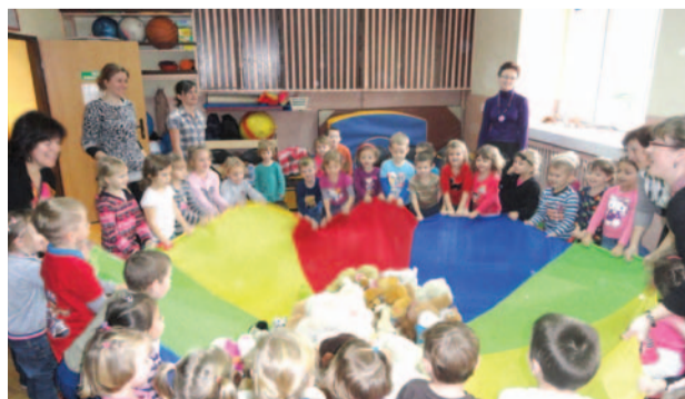
Przedszkolaki z Danielowic w szale zabawy