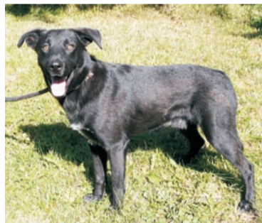
Młody czarny mieszaniec, tel. 667-735-988