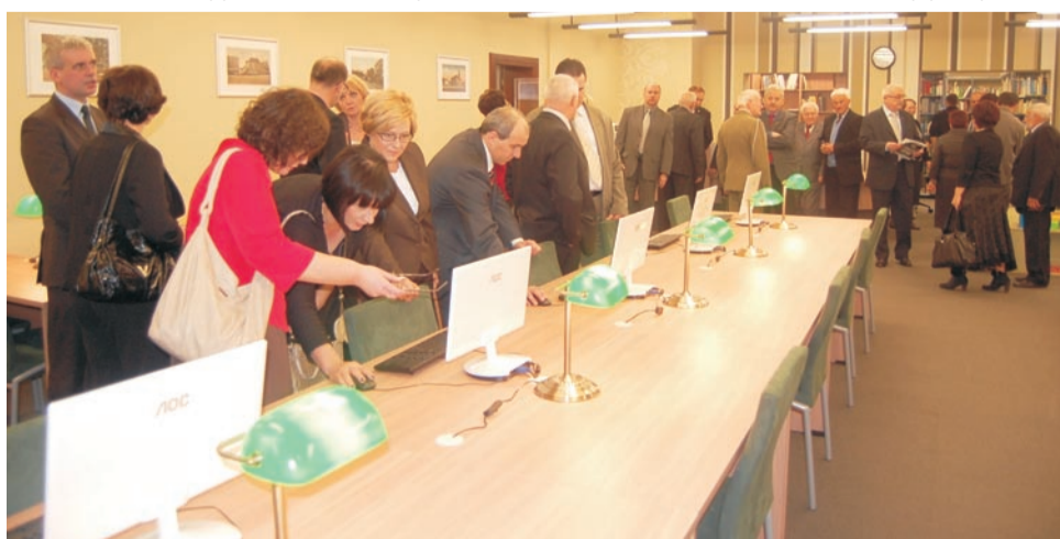
W czytelni dla dorosłych można bezpłatnie korzystać z internetu