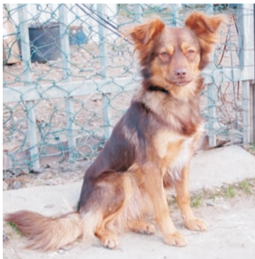
Uroczą młodą rudą wysterylizowaną suczką, tel. 504-211-752