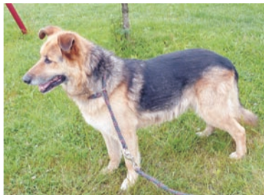
Starszy owczarek niemiecki, tel. 667-735-988