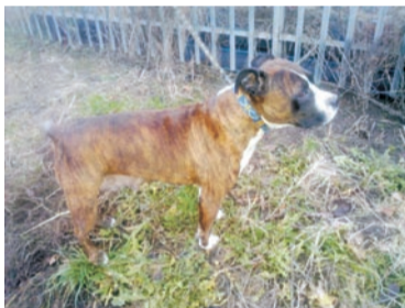
Brązowa pręgowana dwuletnia łagodna amstafka, tel. 504-211-752