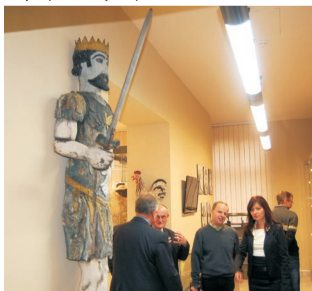
Goście zwiedzają izbę muzealną