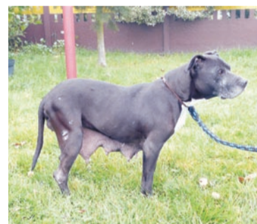
Kilkuletnia suka rasy amstaf, znaleziona w Owczarach, tel. 667-735-988