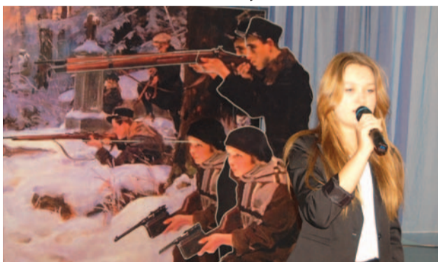
Młodzi olawianie mówili o młodych lwowskich bohaterach