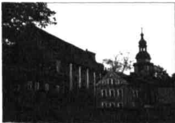
Kościół w Cieplicach Śląskich

nich są ażurowe z balaskami. Po północnej i południowej stronie nawy głównej znajduje się osiem ołtarzy umieszczonych w płytkich kaplicach.