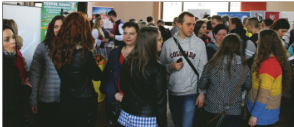
Tegoroczne Targi odwiedziło około 500 gimnazjalistów i uczniów szkół ponadgimnazjalnych

- Wiem, że powinno się stawić na studia inżynijne,