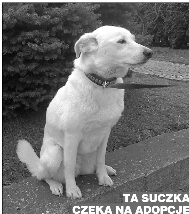
TA SUCZKA CZĘKA NA ADOPCJĘ