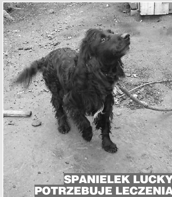
SPANIELEK LUCKY POTRZEBUJE LECZENIA

Fundacja „Na Pomoc Zwierzętom”, ul. 1-go Maja 45/9, 58-370 Boguszów nr konta Idea Bank 58 1950 0001 2006 5234 5541 0002, dopisek „na Luckiego”.