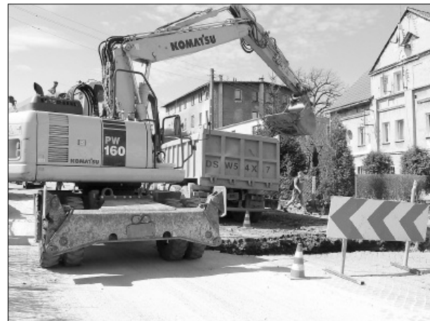
Prace na ul. Mikulicza mają potrwać do połowy maja

• II etap - budowa kanalizacji sanitarnej i deszczowej na ul. Jeleniogórskiej i Mikulicza - wartość 2 875 182,60, z czego