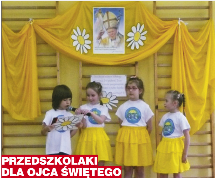
PRZEDSZKOLAKI DLA OJCA ŚWIĘTEGO

Fatalna pogoda sprawiła, że uroczystość upamiętniająca 10. rocznicę śmierci Jana Pawła II została ograniczona do minimum. Jednak mimo deszczu i przejmującego zimna zebraliśmy się 2 kwietnia punktualnie o godz. 12:00 pod pomnikiem Ojca Świętego na krótką modlitwę i zapalenie zniczy.