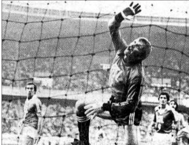
W bramce AJ Auxerre podczas finału Pucharu Francji na Parc des Princes

Kariera świetnie rokującego piłkarza nabierała rozpędu. Mając 16 lat był podstawowym bramkarzem Unii, a trener ani myślał pozbywać się go ze składu. Ale prawidła ówczesnego ustroju były nieublagane. Zbliżał się okres odbycia służby wojsko-