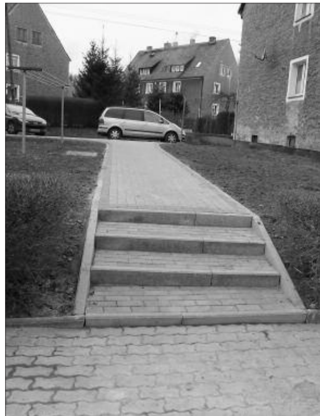
Łącznik na Zamkowej już służy mieszkańcom