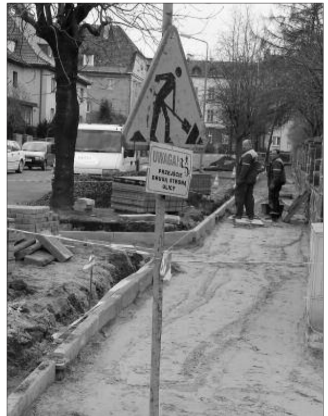
Remont chodnika na Parkowej potrwa do połowy kwietnia

P od koniec lutego rozpoczął się remont chodnika na ul. Parkowej, na odcinku od ul. Kolejowej do ul. Żwirki i Wigury. Prace objęły część od strony Centrum Rehabilitacji Społecznej, bo ten fragment chodnika jest najbardziej uczęszczany. Piesi będą mieli do dyspozycji nową nawierzchnię z kostki polbruk, będą także wykonane dojeżdżania do posesji.