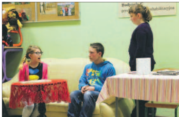
Był też akcent odnoszący się do aktualnej sytuacji w Europie - scenka o uchodźcach z Ukrainy