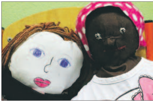
Laleczki są jedyne i niepowtarzalne - nie ma drugiego takiego samego egzemplarza, w dodatku ich autorzy włożyli w nie sporo serca