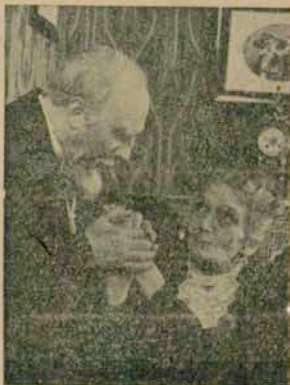
Jubilatka w roli Marii Lwowny w „Niespokojnej starości” Rachmanowa

Dlatego dzień Jej zasłużonego jubileuszu podkreśla nie tylko owoce Jej długoletniej pracy scenicznej, lecz jest również dniem pracy i ofiarnego wysiłku artysty i obywatela.