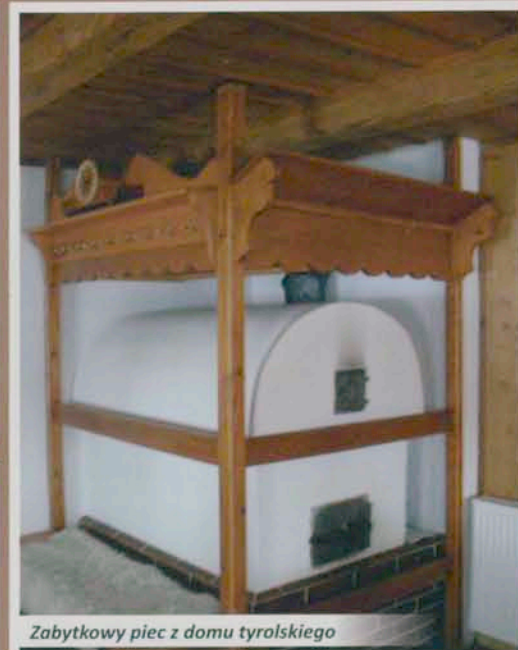
Zabytkowy piec z domu tyrolskiego