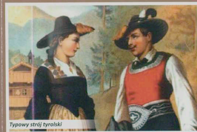
Typowy strój tyrolski

W pierwszym polskim przewodniku górskim z 1849 roku pt. „Wabrunn i okolice” warszawska kuracjuszka - Rozalia Saulson tak wspomina spotkanie pary Tyrolczyków na cieplickim deptaku: „Tyrolka ubrana w czarną lub ciemnego koloru spódnicę, kaftanik czarny. Fartuch szeroki, ciemny, włosy z obu stron w grube ujęte sploty, głęboko na twarz spuszczone. Kapelusz czarny, pilśniowy [...] otoczony sznurkami kolorowych paciorek lub sztucznym kwiatem; nawet przy zajęciu gospodarskim nie zdejmuje go Tyrolka. Zastępuje on jej miejsce czepka. Tyrolczyk nosi cały ubiór z manszestru [sztruksu] czarnego, pończochy nosi białe, półbuty sznurowane”.