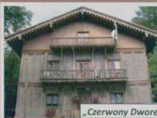
„Czerwony Dworek” w Mysłakowicach