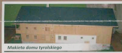
Makieta domu tyrolskiego