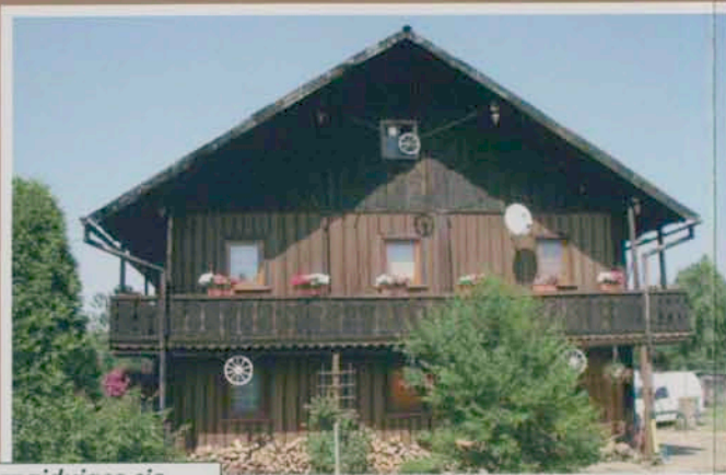
Dom tyrolskie znajdujące się na terenie gminy Mysłakowice