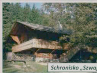
Schronisko „Szwajcarka” w Karpnikach