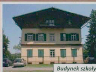
Budynek szkoły w Mysłakowicach