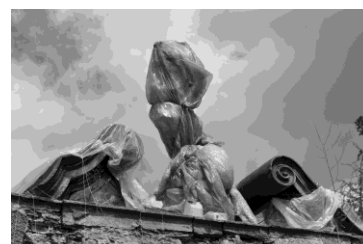
Prace renowacyjne Bramy Herkulesa