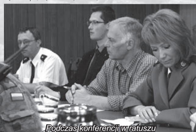
Podczas konferencji w ratuszu

zbytnim balastem i najpewniej dlatego zakopywano ją w różnych miejscach, których wskazać dziś nie sposób. Dwudniowa akcja stanowiła zatem dla organizatorów życia w sytuacjach kryzysowych ważny egzamin. Zdaniem