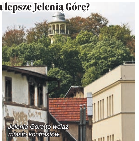
Jelenia Góra to wciąż miasto kontrastów.