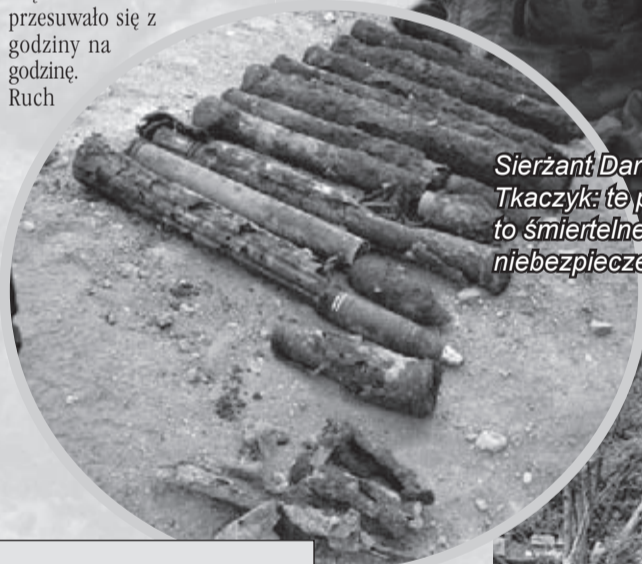
Sierżant Dariusz Tkaczyk: te pociski to śmiertelne niebezpieczeństwo