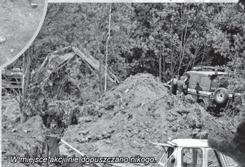
W miejsce akcji nie dopuszczano nikogo.

Reporterzy Jelonki.com