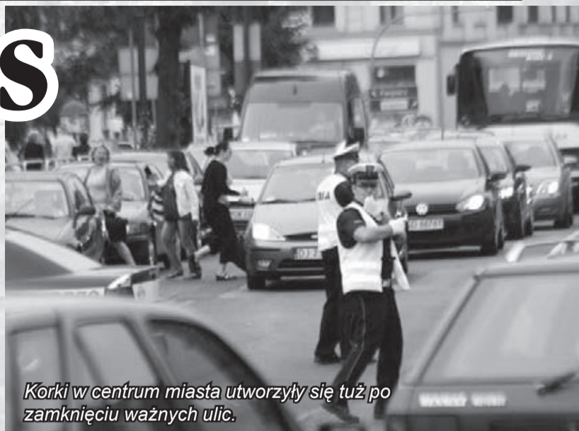
Korki w centrum miasta utworzyły się tuż po zamknięciu ważnych ulic.