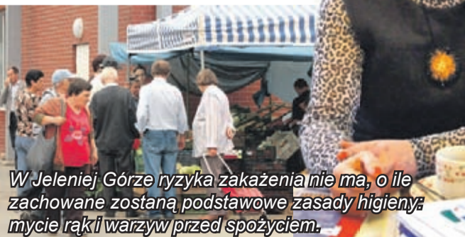
W Jeleniej Górze ryzyka zakażenia nie ma, o ile zachowane zostaną podstawowe zasady higieny: mycie rąk i warzyw przed spożyciem.