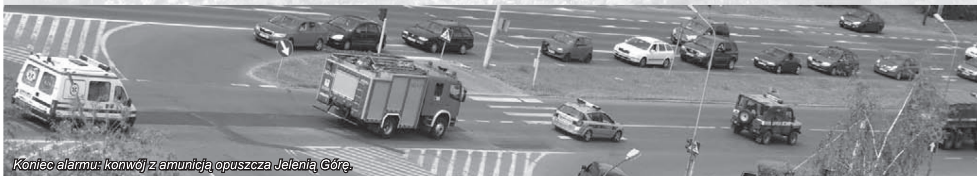
Koniec alarmu: konwój z amunicją opuszcza Jelenią Górę.

konwoju wywieziono je poza Jelenią Górę w celu detonacji. Miasto odetchnęło. Praca saperów zakończyła się dopiero po godz. 20, kiedy w dwóch