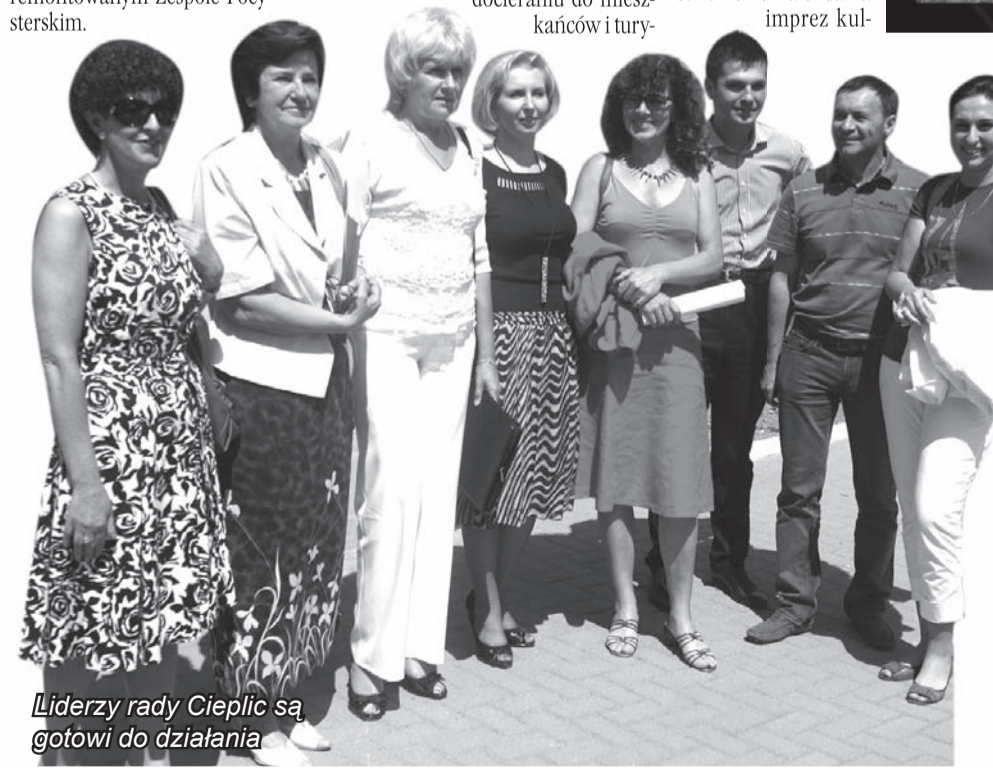
Liderzy rady Cieplic są gotowi do działania

Za kilka lat tu właśnie będzie reprezentacyjna część Zdroju.