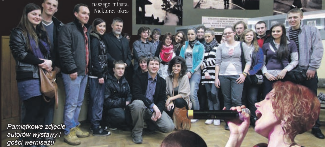
Pamiątkowe zdjęcie autorów wystawy i gości wernisażu