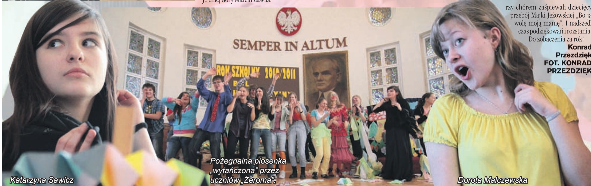
Pożegnalna piosenka „wytańczona” przez uczniów „Żeroma”.