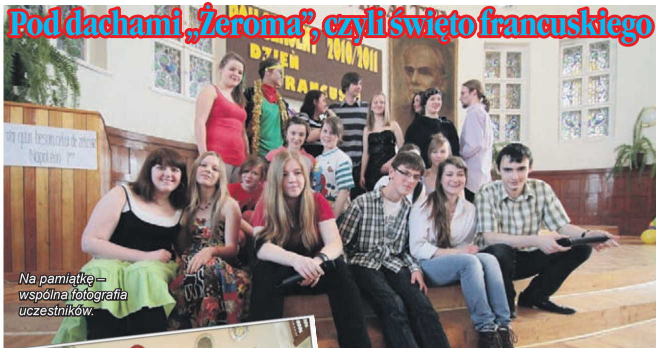
Na pamiątkę – wspólna fotografia uczestników.