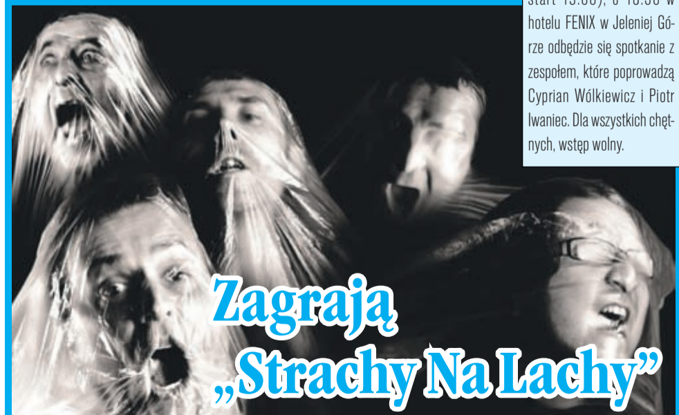
Zagrają „Strachy Na Lachy”