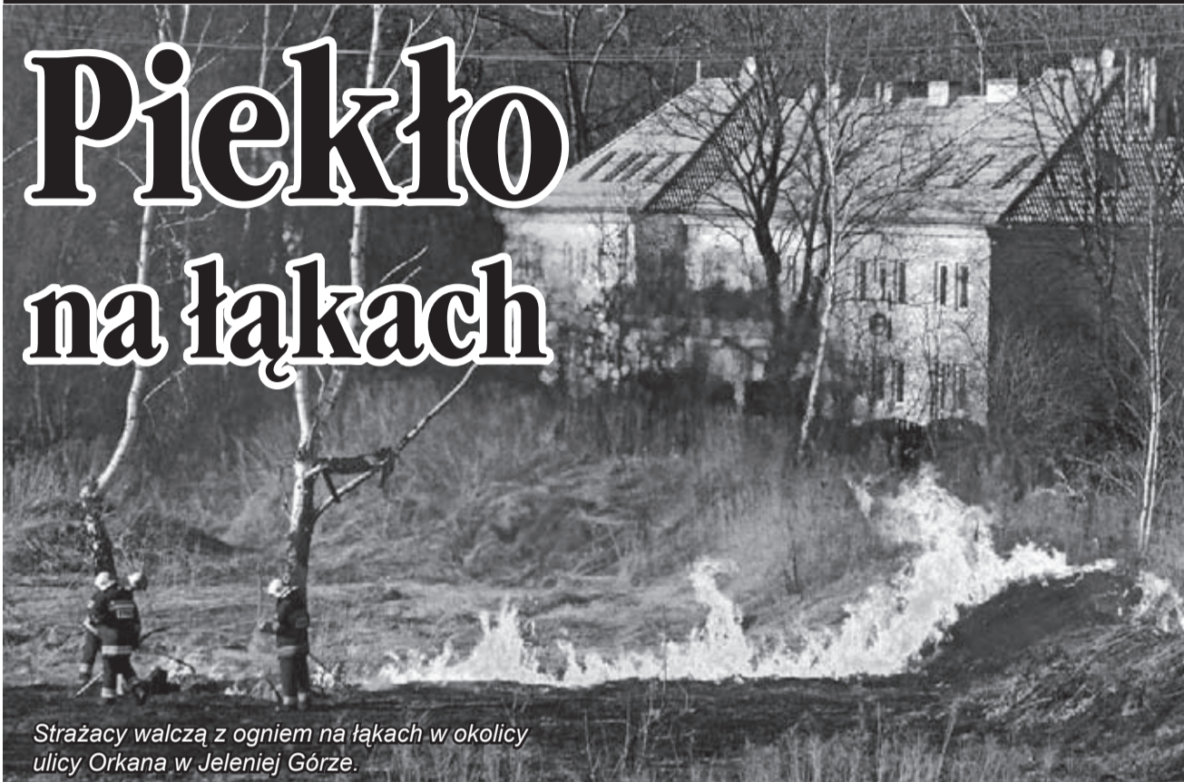
Strażacy walczą z ogniem na łąkach w okolicy ulicy Orkana w Jeleniej Górze.

Średnio po dwadzieścia interwencji dziennie odnotowali w minionym tygodniu strażacy, którzy gasili podpalone przez podpalaczy nieużytki. Rekord padł w ubiegłą środę, gdy do gaszenia ognia podsycanego silnym wiatrem wyjeżdżali aż 25-krotnie. Najgorsze dopiero nadzieje.