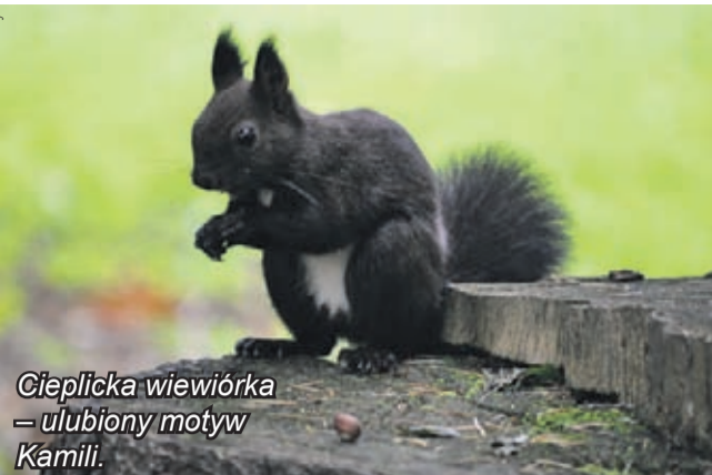
Cieplicka wiewiórka – ulubiony motyw Kamili.

Różnorakie zdjęcia, dzieła uczniów Technikum Fotograficznego przy Zespole Szkół Rzemiosł Artystycznych im. Wyspiańskiego, podziwiać można na wystawie zbiorowej w Klubie Nauczyciela przy ulicy Bankowej w Jeleniej Górze.