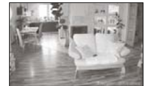
560.000-Jeżów Sudecki Nowa parterówka z 2005r, pow. całk. 170m 2 , pow. uż. 125m 2 , działka 936m 2 , garaż w budynku.