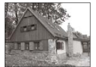
470.000 - ok. Kamiennej Góry Stylowy, uroczy dom z klimatem o pow. 113m 2 . Po remoncie kapitalnym, konstrukcja drewno i kamień.