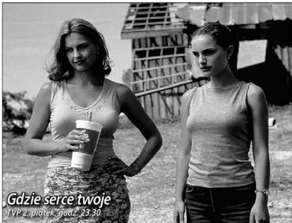
Gdzie serce twoje TVP 2, piątek, godz. 23.30