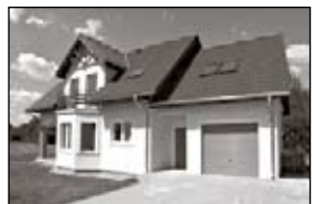
680.000-okolice Karpacza Nowy dom do własnego wykończenia o pow. całk. 165m 2 , pow. uż. 129m 2 , działka 1211m 2 .