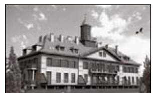
Mieszkania deweloperskie od 3.700 zł netto. Na Osiedlu Park Sudecki w o pow. od 33 m 2 do 89 m 2 położone są w nowoczesnym czterokondygnacyjnym budynku mieszkalnym z windą. Tylko w Biurze „Nieruchomości Kopczyńscy”, przy zakupie apartamentów NIE płacisz prowizji, płacisz połowę stawki taksy notarialnej.