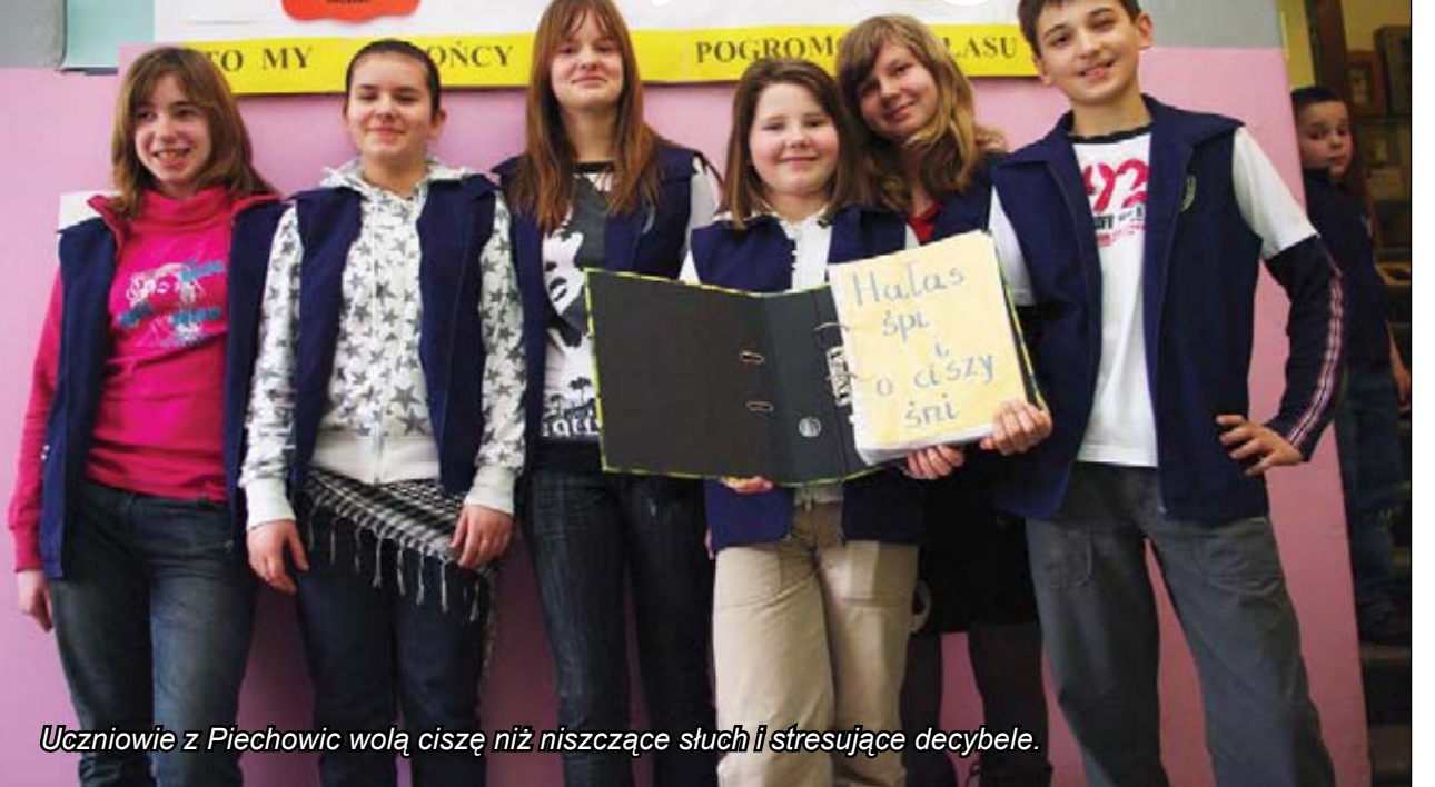
Uczniowie z Piechowic wolą ciszę niż niszczące słuch i stresujące decybele.

ślają nowe piktogramy i wymieniają się pomysłami dotyczącymi przeciwdziałania hałasowi. Zmierzą się także w konkursie na najcichszego ucznia i klasę. W tym celu szkoła zamierza nabyć decybelomierz. Uczniowie zainteresowani sprawą