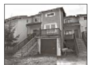
330.000-Kowary Środkowy szereg po remoncie kapitalnym wewnątrz, pow. 212m 2 z garażem