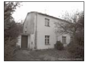
230.000 - Cieplice Pół bliźniaka do remontu kapitalnego, powierzchnia 147m 2 , działka 479 m 2 .