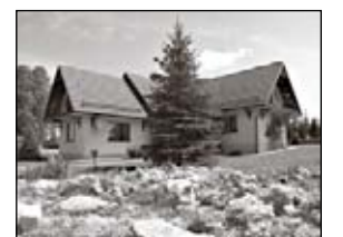
670.000-ok. Lubania Młociszów - malownicza posiadłość ze stawem, liczne nasadzenia, wysoki standard wykończenia, działka 8400m 2 .