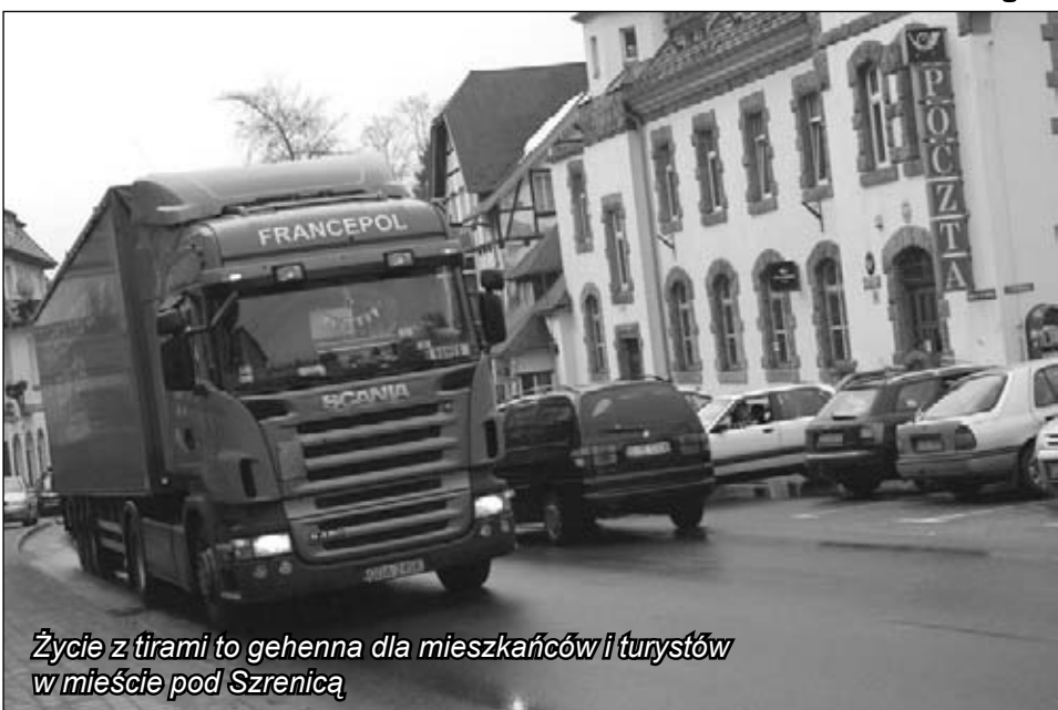
Życie z tirami to gehenna dla mieszkańców i turystów w mieście pod Szrenicą

jest turystyka i powstanie obwodnicy jest jednym z warunków funkcjonowania turystycznego biznesu. Wszyscy, którzy jadą w kierunku Czech wiedzą, że przejazd przez krajową trójkę chwilami zamienia się w prawdziwy koszmar.