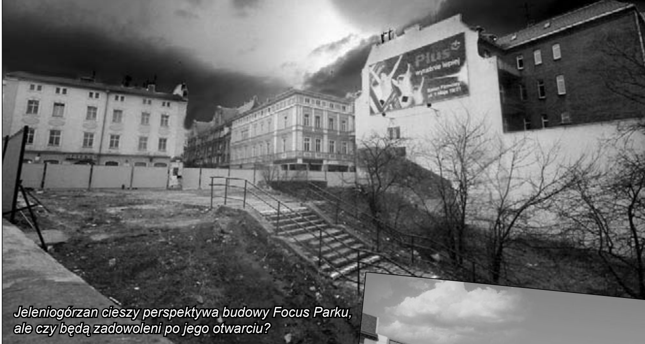
Jeleniogórczyńskie cieszy perspektywa budowy Focus Parku, ale czy będą zadowoleni po jego otwarciu?

Nawet gdyby jeleniogórczyńskim postawili lustrzany pałac kultury z aquaparkiem, salą koncertową, stadionem i Bóg wie, czym jeszcze w środku, to i tak smętnie pokręciliby głową mówiąc, że takie „cudo” zupełnie nie pasuje do swojego krajobrazu.