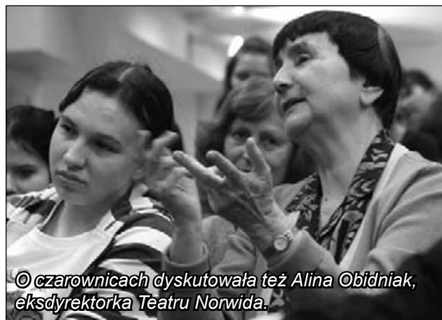
© czarownicach dyskutowała też Alina Obidniak, eksdyrektorka Teatru Norwida.