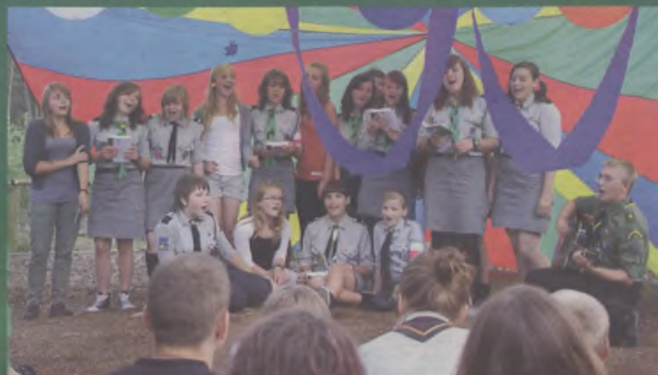
1. drużyna obozowa wygrała festiwalowe zmagania