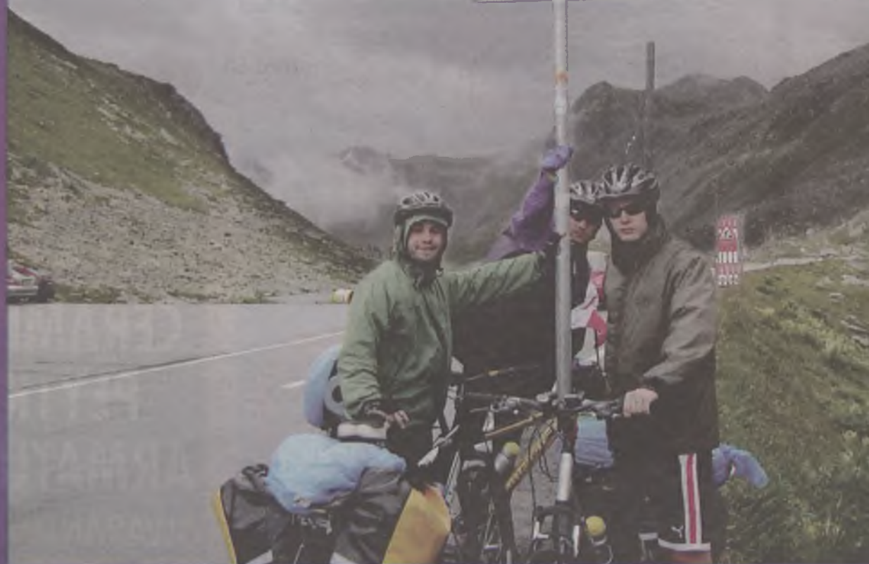
Najbardziej męcząca była jazda w górach