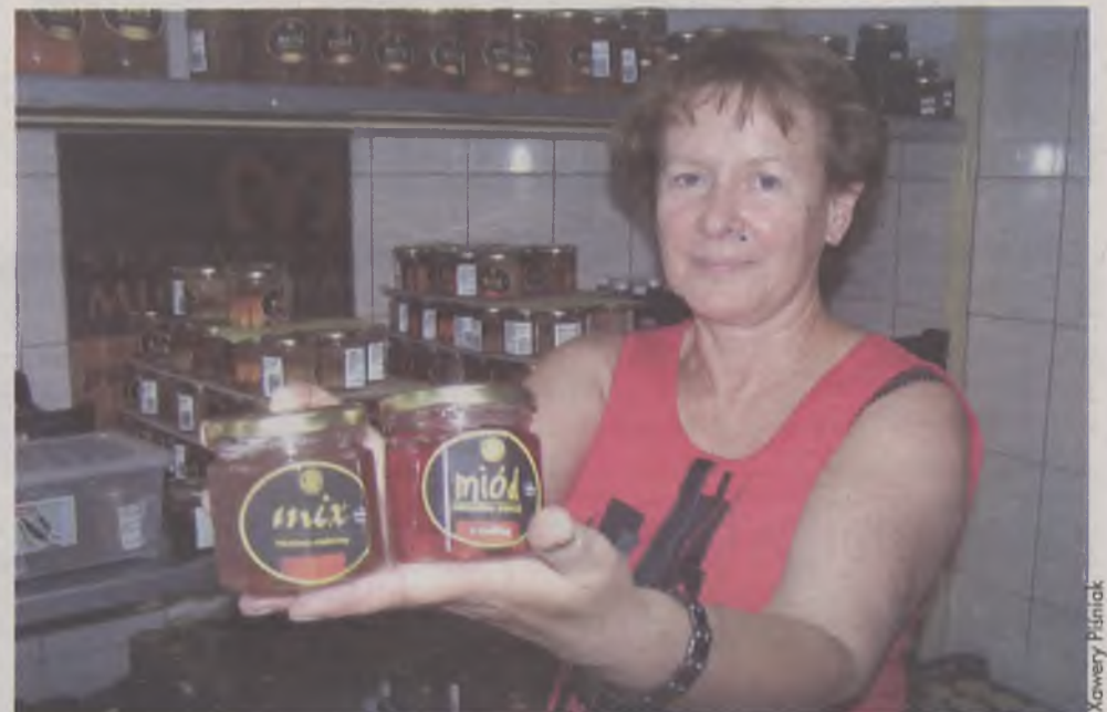
Drobna różnica w nazwie o kolosalnym znaczeniu. Klient nie sięgnie tak chętnie po mix, jak po miód...

A co z miodami sztucznymi, które są dostępne na rynku? Jeżeli chcemy być konsekwentni, trzeba by zakazać