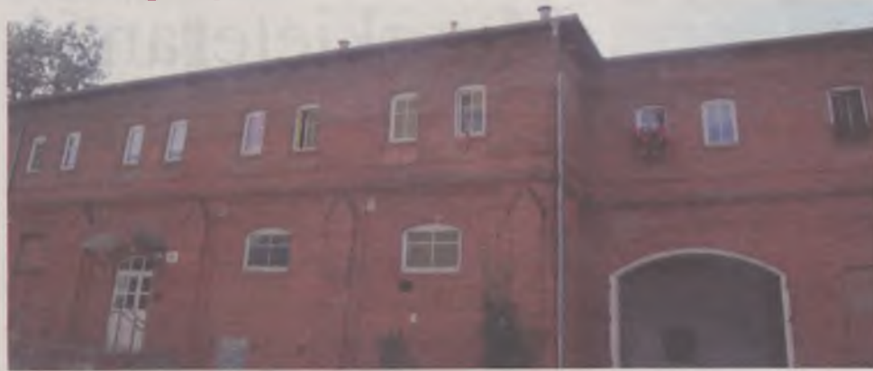
W pokoszarowych budynkach od początku nie wszystko działa prawidłowo

Wydziału Gospodarki Komunalnej, Mieszaniowej i Ochrony Środowiska Urzędu Miejskiego tłumaczył nam wtedy, że problem nie jest w dachu, lecz w wentylacji. Ówczesny zastępca burmistrza Zenon Leja twierdził, że wymiana przewodów wentylacyjnych na przewody izolowane w budynkach przy Młyńskiej 18 - 60 jest planowana na rok 2011.