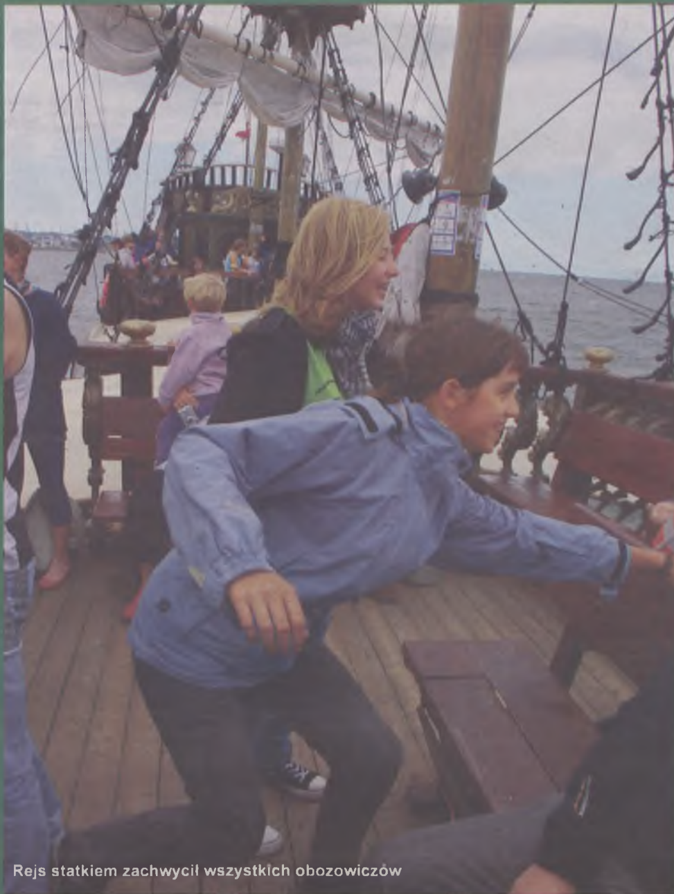
Rejs statkiem zachwycił wszystkich obozowiczów

Obóz to wiele atrakcji. Chętnie wędrowano do pobliskiej latarni w Stilo. Starsi porwali się na wędrowkę do Łeby. Wykorzystywano także rowery podczas zwiadów terenowych, przy poznawaniu okolicy. Nie zabra-