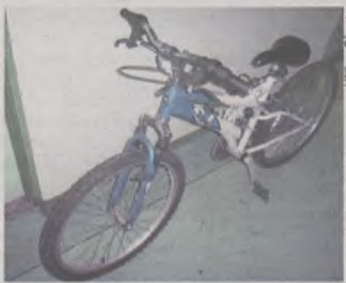
23-latek jechał pijany na kradzionym rowerze