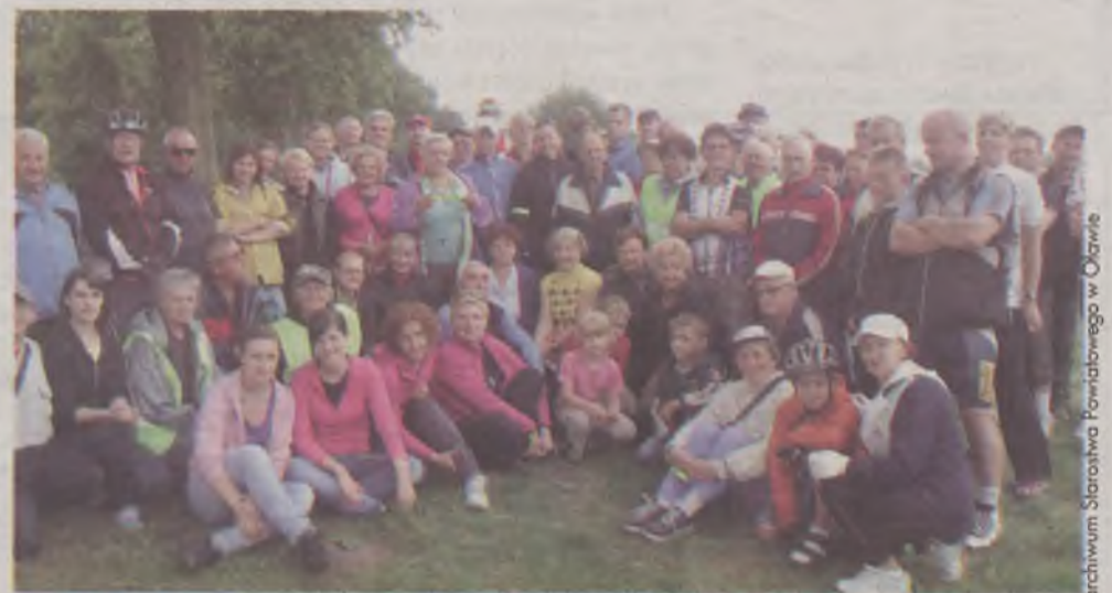
Uczestnicy czwartej wycieczki rowerowej do Psar