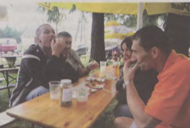
Ogóreczki i napoje umilały barową pogodę