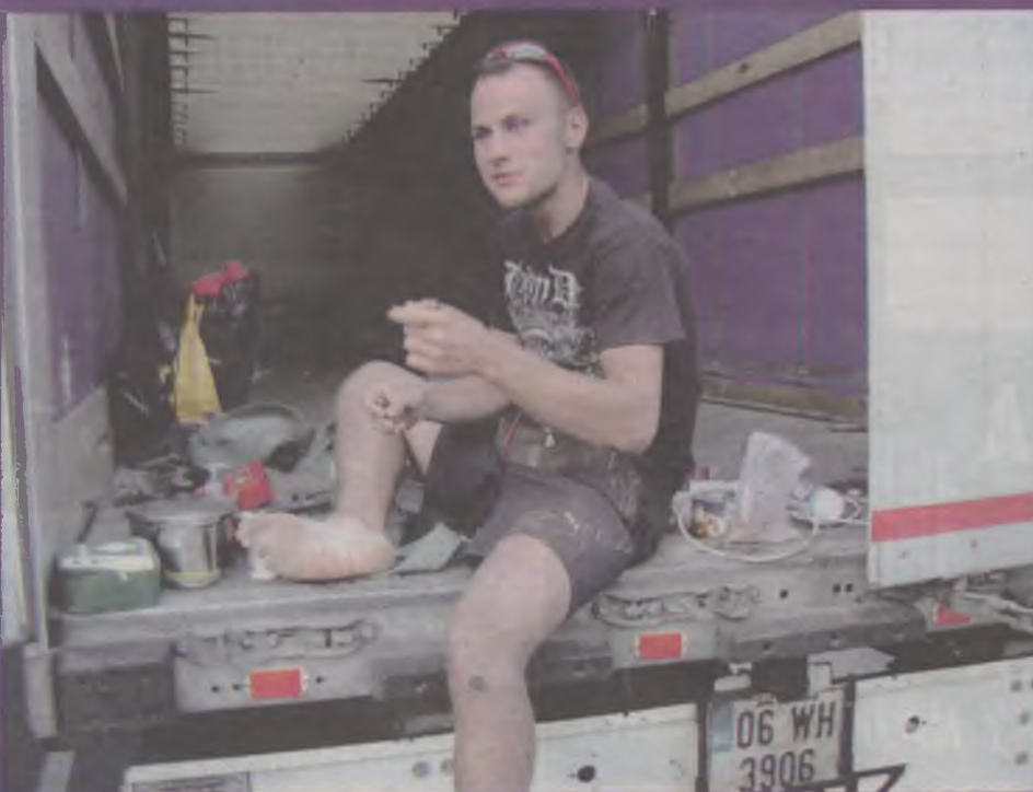
Kilka nocy przespał w ilrze