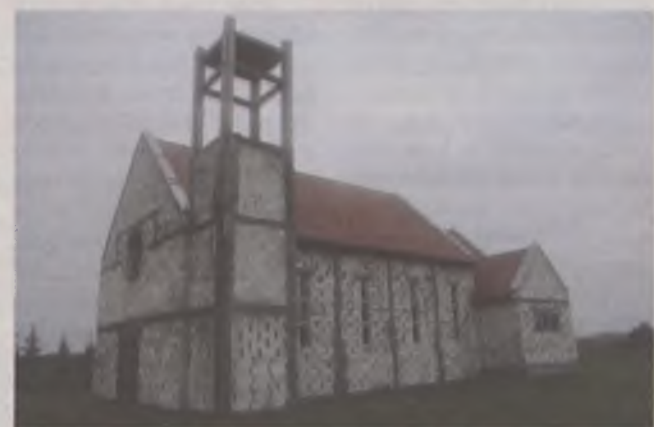
Dochód z imprezy miał być przekazany na dalszą budowę kościoła