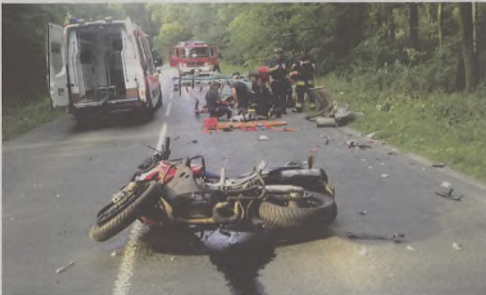
Motocyklista ma m.in. złamane podudzie