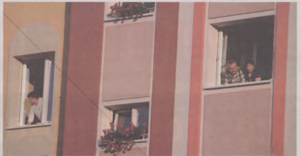
Zamiast płatnych karnetów olawianie wybrali okna swoich mieszkań