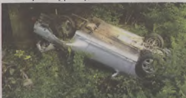
Kierowca hondy wyszedł z auta o własnych siłach

TEKST I FOT.: AGNIESZKA HERBA aherba@gazeta.olawa.pl