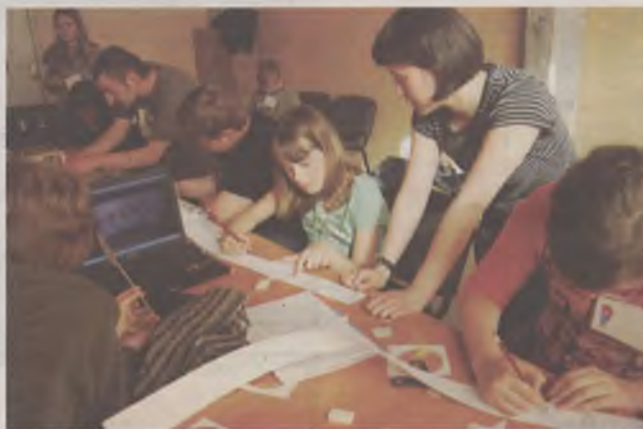
Podczas zajęć nie zabraknie możliwości realizowania własnych pasji