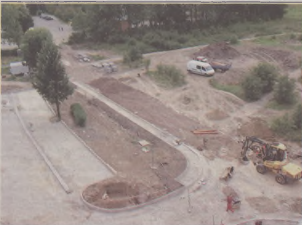
Budowana droga wewnętrzna obok olawskiego szpitala połączy ulice Kutrowskiego i Baczyńskiego, co ułatwi dojazd do SOR

ORGANIZATOR STAROSTWO POWIATOWE W OŁAWIE