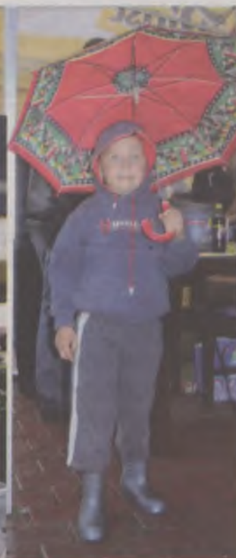
Oto obowiązujący strój na festynie