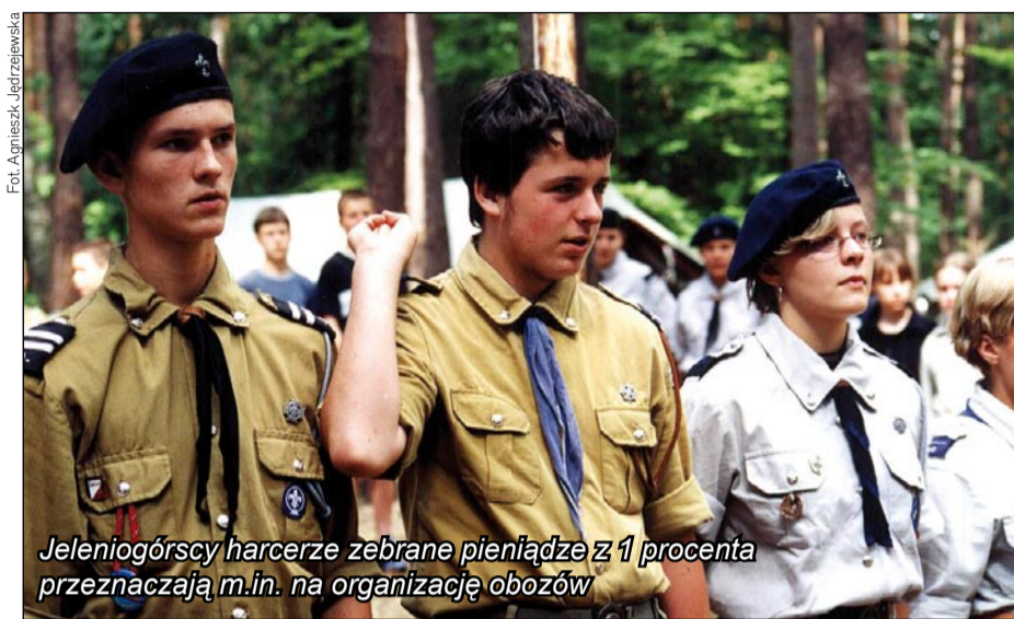
Jeleniogórscy harcerze zebrane pieniądze z 1 procenta przeznaczają m.in. na organizację obozów

Niestety, jak wynika ze statystyk, tylko 9 na stu podatników przekazu-