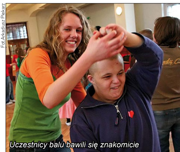
Uczestnicy balu bawili się znakomicie

Tańce, zabawy, konkursy – takie atrakcje czekały na dzieci ze Specjalnego Gimnazjum w Zespole Szkół i Placówek Specjalnych na spotkaniu w ZSO nr 1 im. S. Żeromskiego.