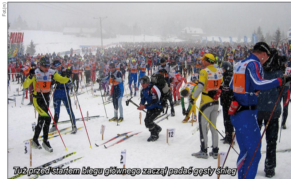
Tuż przed startem biegu głównego zaczął padać gęsty śnieg

W biegu obok licznej grupy zawodników krajowych, wystartowali przedstawiciele kilkunastu państw - z Włoch, Litwy, Białorusi, Ukrainy (wśród nich sporo Polonusów), z Niemiec i Holandii. Najliczniej jednak tradycyjnie stawali się Czesi. I to oni podyktowali tempo biegu. Trzy pierwsze miejsca w biegu głównym przypadły zawodnikom zza południowej granicy.