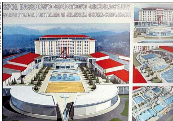
Jedna z utopijnych wizji aquaparku w projekcie sprzed niemal 10 lat

Do ogrzewania i kąpeli wykorzystana będzie woda geotermalna. Pierwszy odwiert wykonano jeszcze w latach 90-tych. Dawał on 46 metrów sześciennych wody, o temperaturze 64,5 stopnia Celsjusza na godzinę.