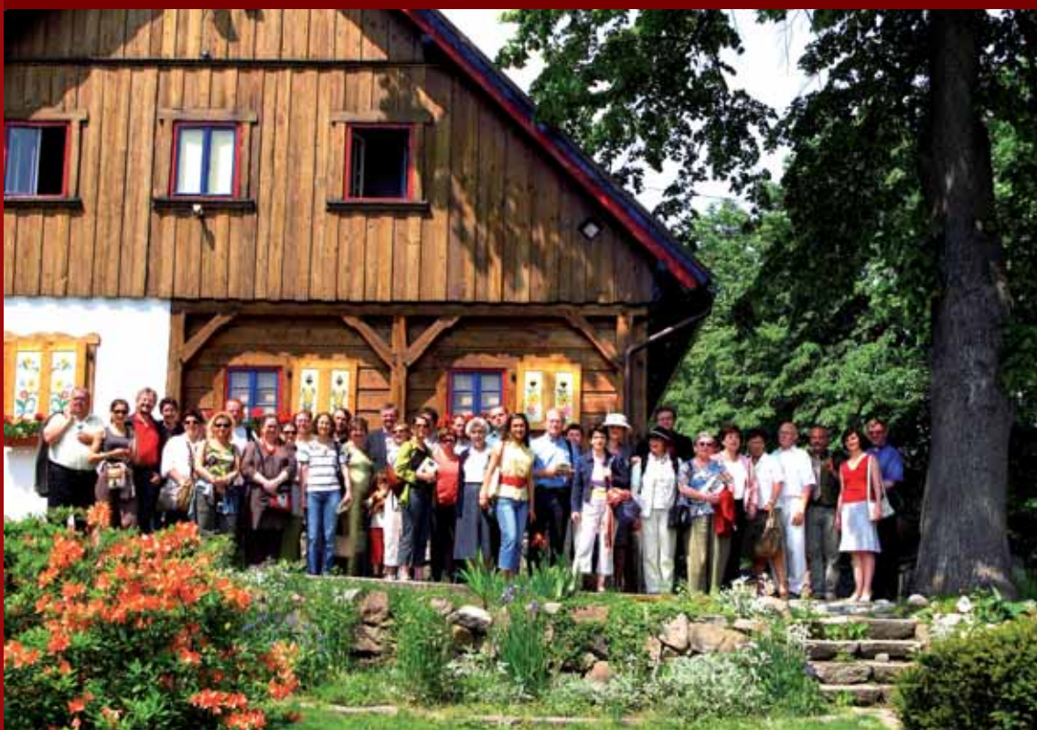
› Uczestnicy otwarcia wystawy „La Petite France – Strasbourg” przed muzeum