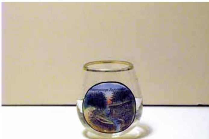
➤ Ozdobne szkło pamiątkowe z wodospadem Kamięńczyka