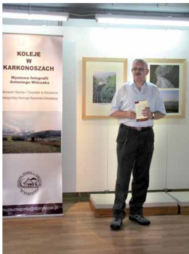
➤ Antoni Witczak - autor wystawy

Pierwszą inwestycją była budowa połączenia Jelenia Góra -Mysłakowice-Kowary (14,8 km), ukończona 15.05.1882 r. Następnie linię kolejową przedłużono do Kamiennej Góry (25,1 km), wykuwając trzeci co do długości tunel (1011 m) na Dolnym Śląsku pod Przełęczą Kowarską, prowadząc ją na wysokich nasypach serpentynami. Oddano ją do użytku w 1905 r. Służyła ona m.in. do transportu rudy żelaza bezpośrednio z kopalni, przy której usytuowano stację kolejową Kowary Górne i dolomitu z okolic Pisarzowic.