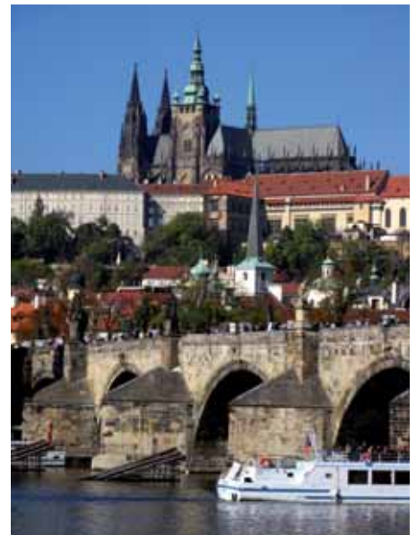
➤ Praga - fragment miasta

Ten wspaniały wieczór autorski trwałby zapewne jeszcze bardzo długo, ale jak to