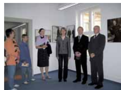
› Uroczystość otwarcia wystawy