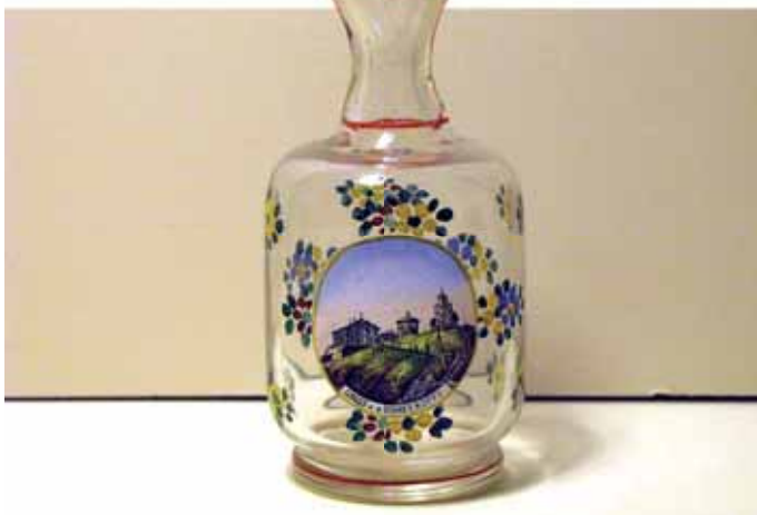
➤ Ozdobne szkło pamiątkowe z widokiem Śnieżki