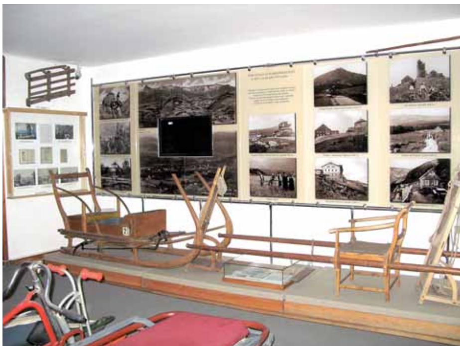
➤ Fragment ekspozycji „Turystyka XIX/XX w.”