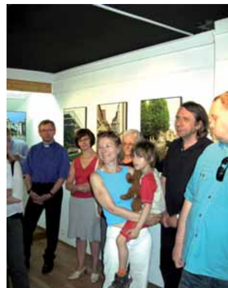
› Goście na wernisażu