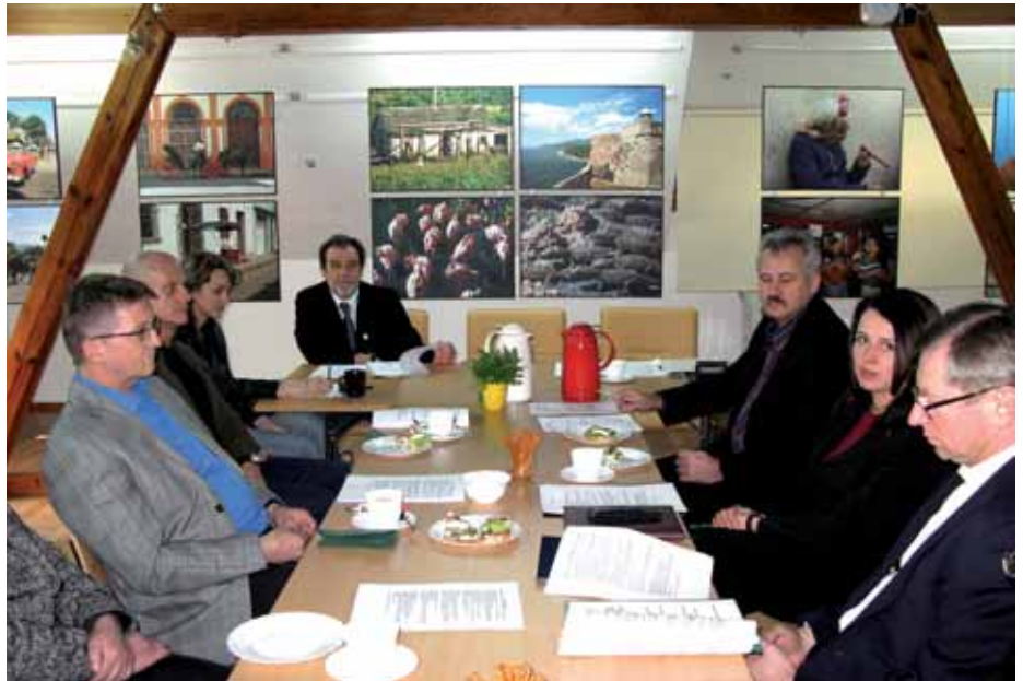
➤ Posiedzenie Rady Muzeum Sportu i Turystyki

ków: jednego merytorycznego (asystent - kustosz) i drugiego do działu księgowości (referent do spraw finansowych).