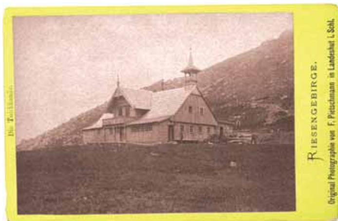
➤ Schronisko nad Małym Stawem

Eksponowana ona była od 26 października do 31 grudnia 2007 r.