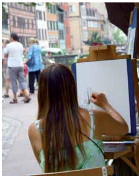
› Malarka na ulicy