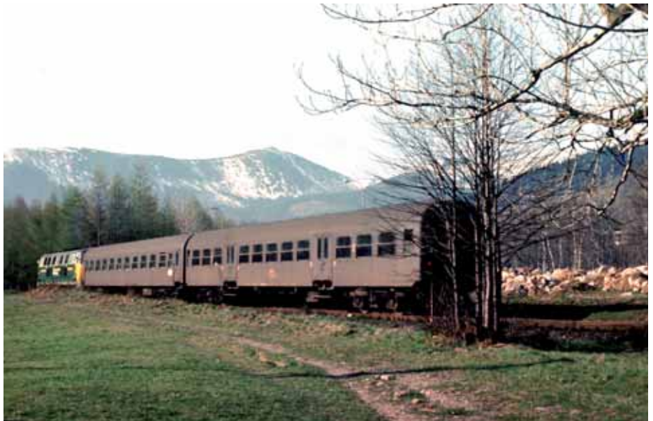
➤ Pociąg relacji Jelenia Góra – Karpacz

zdemontowali na Śląsku trakcję elektryczną i elektrownię kolejową w Ścinawce, zabierając również tabor trakcyjny i wyposażenie. Na wymienione linie wróciły parowozy, a wśród nich bardzo przydatne na górskich trasach, tendzaki Pt-48 polskiej produkcji. Ponownie udało się zelektryfikować linie; Wrocław–Jelenia Góra (1966), Jelenia Góra–Lubań Śląski (1986) i Jelenia Góra – Szklarska Poręba Górna (1987). W latach dziewięćdziesiątych ub. wieku zaczęto demontować bocznicę i tory łącznikowe do zakładów przemysłowych, kładąc kres przewozom towarowym. Pierwszą linią kolejową Kotliny Jeleniogórskiej, którą zamknięto dla ruchu osobowego była trasa Kowary–Kamienna Góra (1986), potem Mysłakowice–Kowary i Mysłakowice–Karpacz (2000). Z 16 połączeń dziennie na trasie Jelenia Góra – Szklarska Poręba (1990) zostało jedno. Z 9 połączeń do Lwówka doliną Bobru zostały jeszcze 3. Podobna sytuacja jest na całym Ślą-