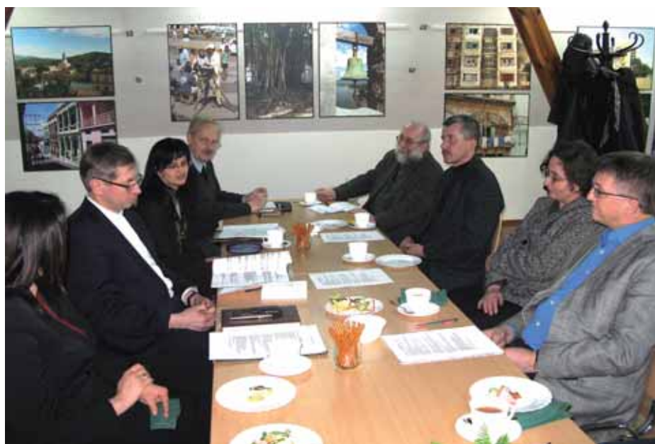
➤ Posiedzenie Rady Muzeum Sportu i Turystyki

Za przyjęciem przedstawionej kandydatury głosowało 10 osób, przeciwko – 0 głosów.