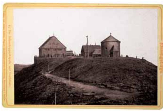
➤ Fotografia Śnieżki - koniec XIX w.