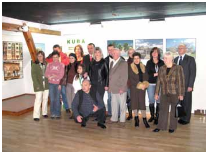
➤ Goście na otwarciu wystawy