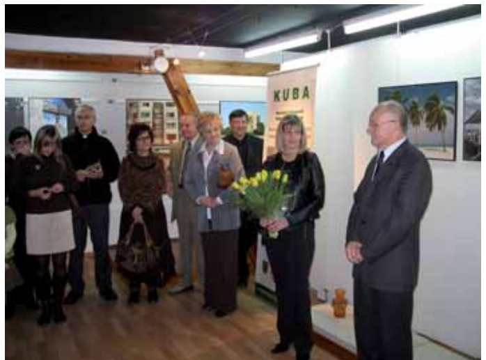
➤ Uroczystość otwarcia wystawy

Sponsorem tej wystawy było Laboratorium Fotografii Profesjonalnej „PROLAB” w Jeleniej Górze.