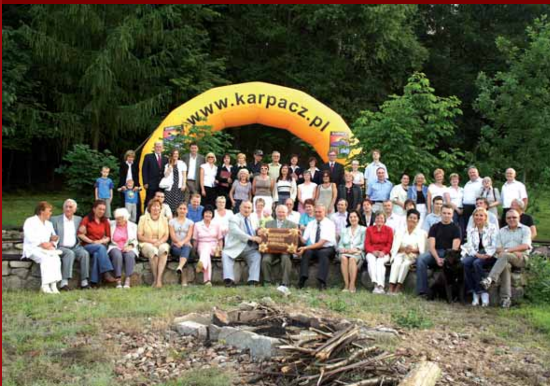
› Zbiorowy portret mieszkańców Karpacza – 2007 r.