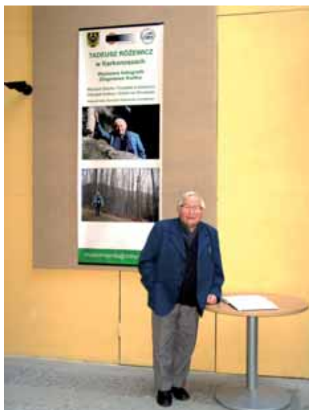
➤ Tadeusz Różewicz na wystawie w Instytucie Polskim w Pradze