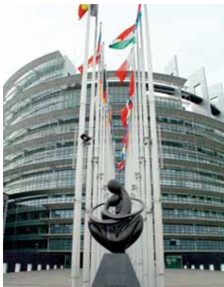
› Parlament Europejski