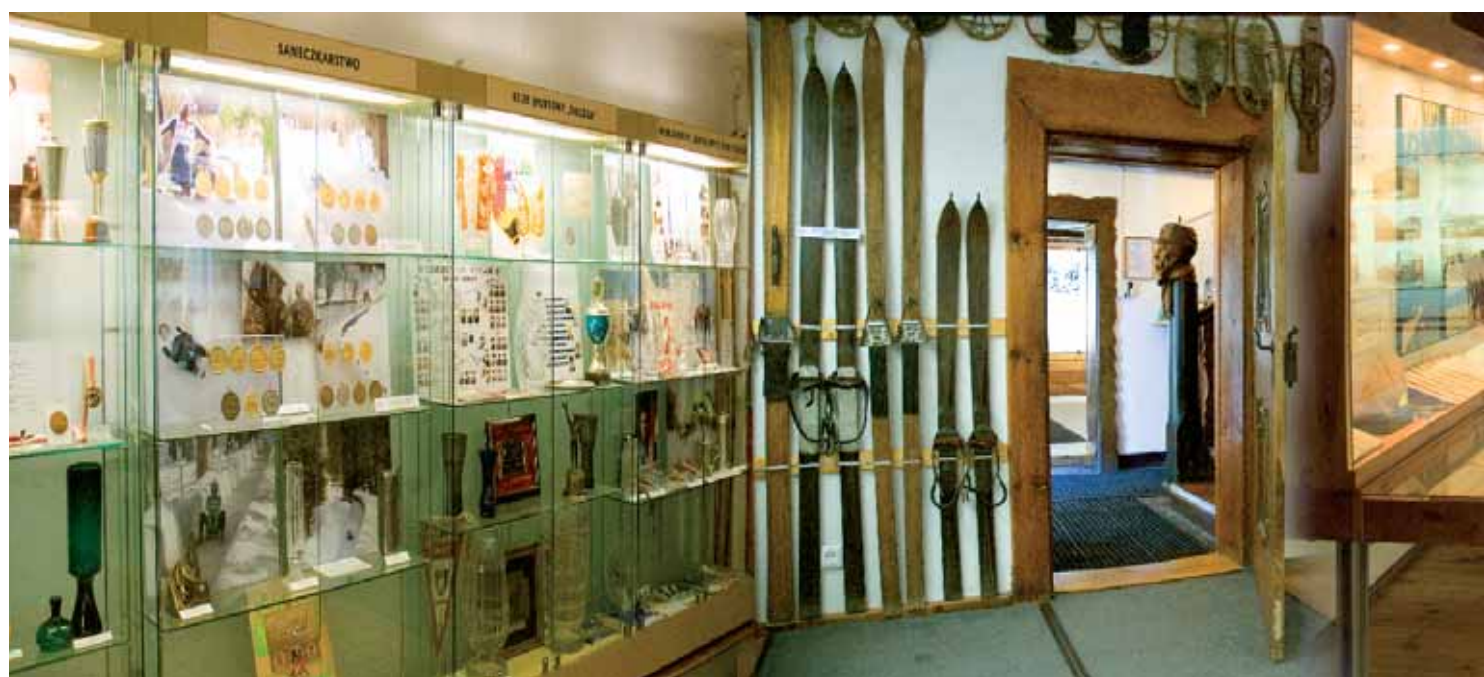
➤ Wystawa stała – „Z dziejów sportów zimowych”

czono fotogramy, archiwalia i eksponaty oraz teksty w następujących tematach: