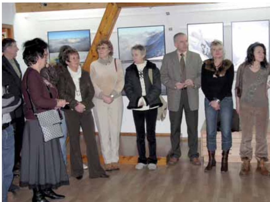
➤ Goście na otwarciu wystawy

Wystawa ta po raz pierwszy prezentowana była w ramach obchodu „Dni Kultury Śląskiej” w Niemczech w Reichenbachu na wystawie w zamku Krobnitz w 2006 r.