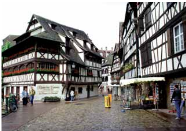
› La Petite France – Strasbourg