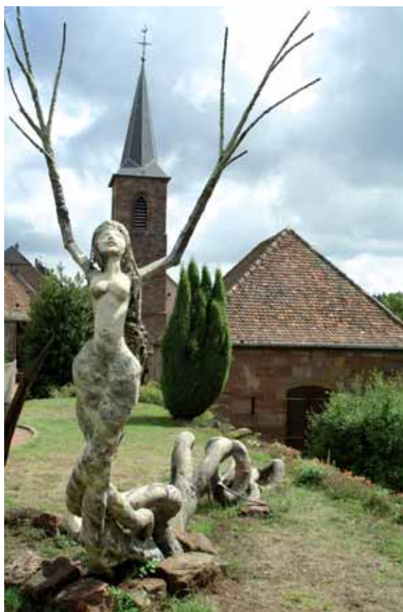
➤ Fotografie prezentowane na wystawie „Spojrzenia na Alzację”