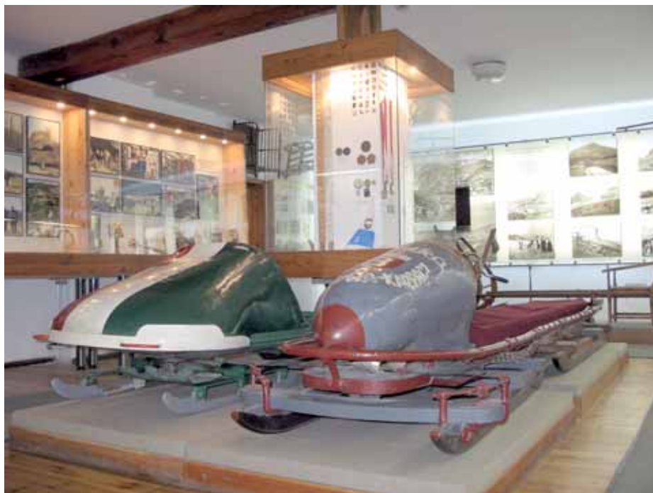
➤ Fragment ekspozycji „Z dziejów sportów zimowych”

W dziale „Z dziejów sportów zimowych” przeprowadzono prace mające