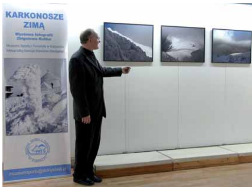
➤ Zbigniew Kulik - autor wystawy

W dniu 6 stycznia 2007 roku w muzeum otwarto wystawę fotograficzną Zbigniewa Kulika „Karkonosze zimą”. Na wystawie pokazano 30 dużych fotogramów ukazujących wyjątkowy nastrój zimy w tych górach. Jeden z pierwszych zwiedzających w wyłożonej „Księdze pamiątkowej” zapisał: „Na takie zdjęcia czeka się całe życie. Panu się to udało”.