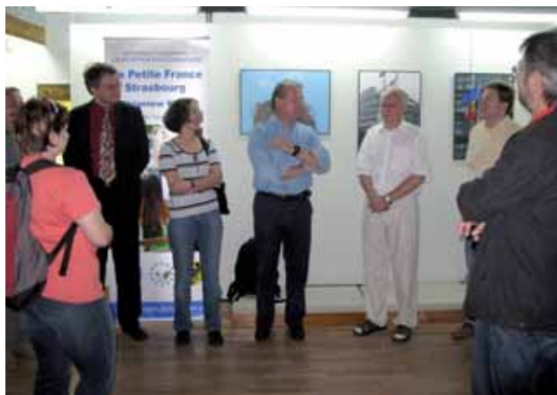
› Uroczystość otwarcia wystawy