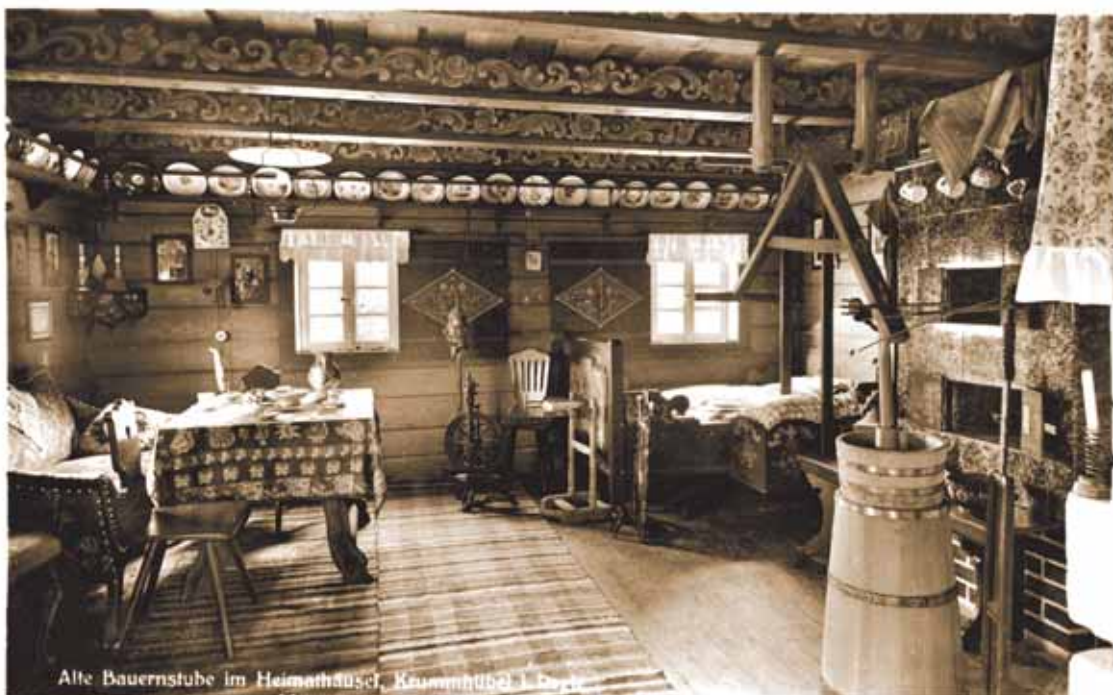
Alte Bauernstube im Heimathäusel, Krummhübel, Böhmen