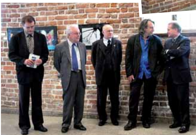
➤ Goście na otwarciu wystawy