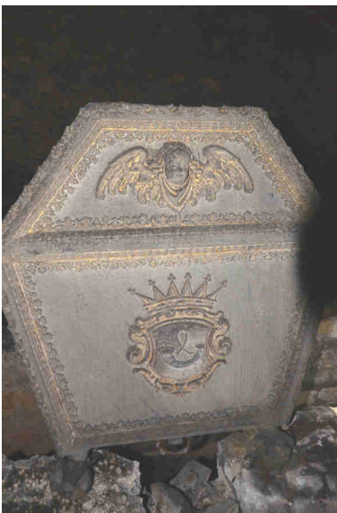
Herb na trumnie (detal)

zwalających wyobrazić sobie, jak wyglądało wtedy wnętrze świątyni: „Przed ołtarzem stoi jakaś rzeźba wykuta w kamieniu przedstawiająca jakiegoś hrabiego. Są i inne podobne epitafia przymocowane do filarów i oparte o boczne ściany kościoła”. Gdyby anonimowy autor przewidział, że w przyszłości rzeź-