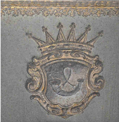
Herb na trumnie (detal)