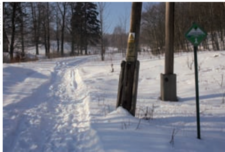
Tak wygląda narciarska trasa biegowa w Kowarach.

Po czeskiej stronie tras biegowych jest wiele, ale skupimy się