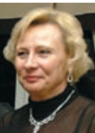
LIDIA ŁOTOCKA - sms na numer 7255 o treści: CR30 (koszt usługi 2,46zł).

ANNA GODLEWSKA - sms na numer 7255 o treści: CR13 (koszt usługi 2,46 zł). ■ DOROTA WOSIAK - sms na numer 7255 o treści: CR20 (koszt usługi 2,46 zł).