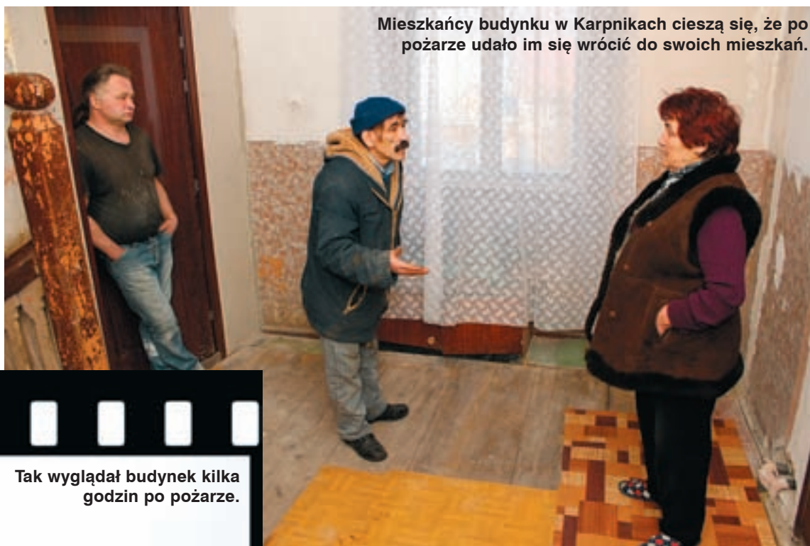
Mieszkańcy budynku w Karpnikach cieszą się, że po pożarze udało im się wrócić do swoich mieszkań.

- Nie płaciłam, bo nie miałam z czego. Pani komornik była bardzo wyrozumia-