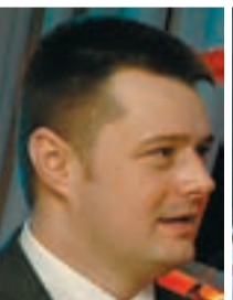
KRZYSZTOF WIŚNIEWSKI - sms na numer 7255 o treści: CR28 (koszt usługi 2,46zł).