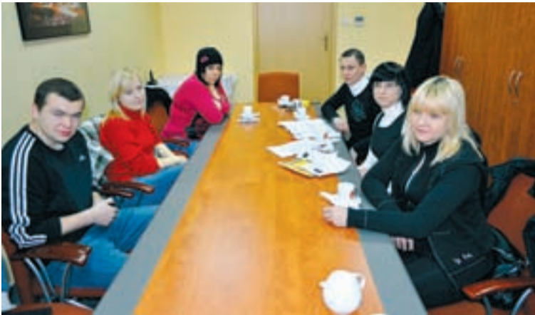
Oszukanych w Czechach zostało co najmniej 28 osób.