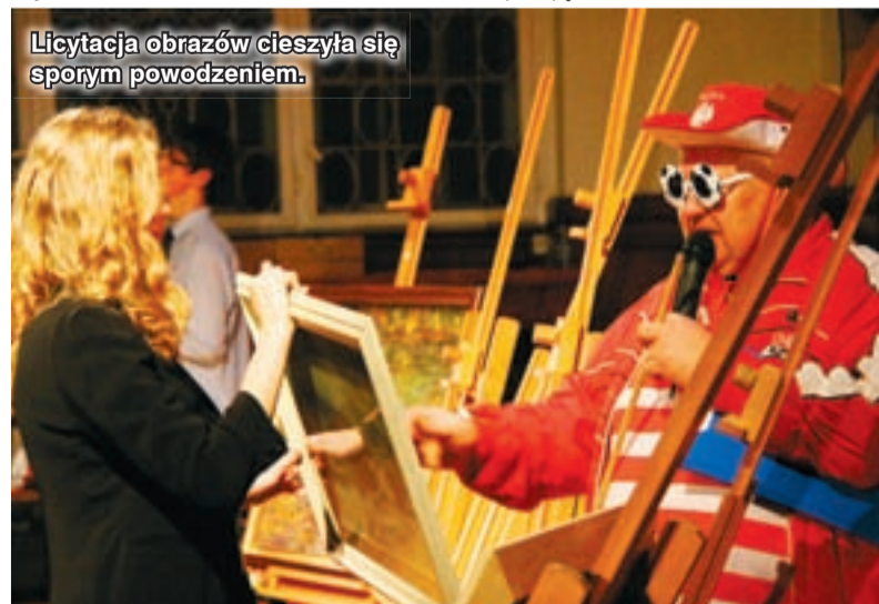
Licytacja obrazów cieszyła się sporym powodzeniem.