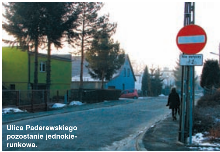
Ulica Paderewskiego pozostanie jednokierunkowa.

Tymczasem Miejski Zarząd Dróg i Mostów przekonuje, że dopuszczenie ruchu w obu