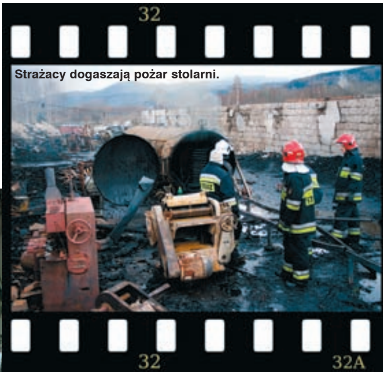
Strażacy dogaszają pożar stolarni.

W styczniową noc, trzy lata temu, kobietę obudził blask dochodzący z kuchni. Otworzyła oczy - jęzory ognia były już na kuchennych drzwiach od strony korytarza i wdierały się do pomieszczeń.