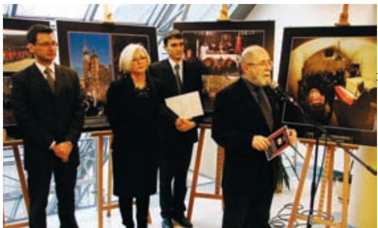
Wernisaż cieszył się naprawdę sporym zainteresowaniem pomimo sobotniego i do tego bardzo mroźnego popołudnia.

- Nikomu nie powinno zaklejać się ust. Przykrycie podpisów pod zdjęciami w czasie wystawy prac w Parlamencie Europejskim uważam za cenzurę - komentował