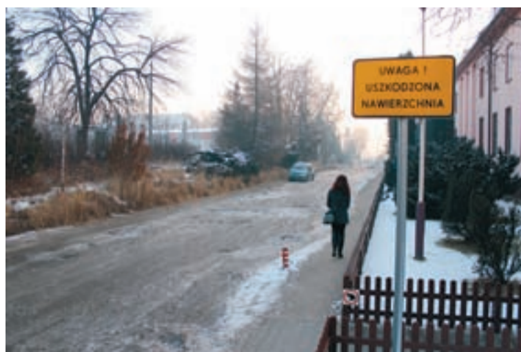
Infrastruktura osiedla wzbogaciła się o znaki ostrzegające o uszkodzonej nawierzchni dróg.

„Podpisaliśmy stosowne porozumienie z Agencją Mienia Wojskowego, aby wszystkie te obiekty przejąć - mówi zastępca prezydenta Jeleniej