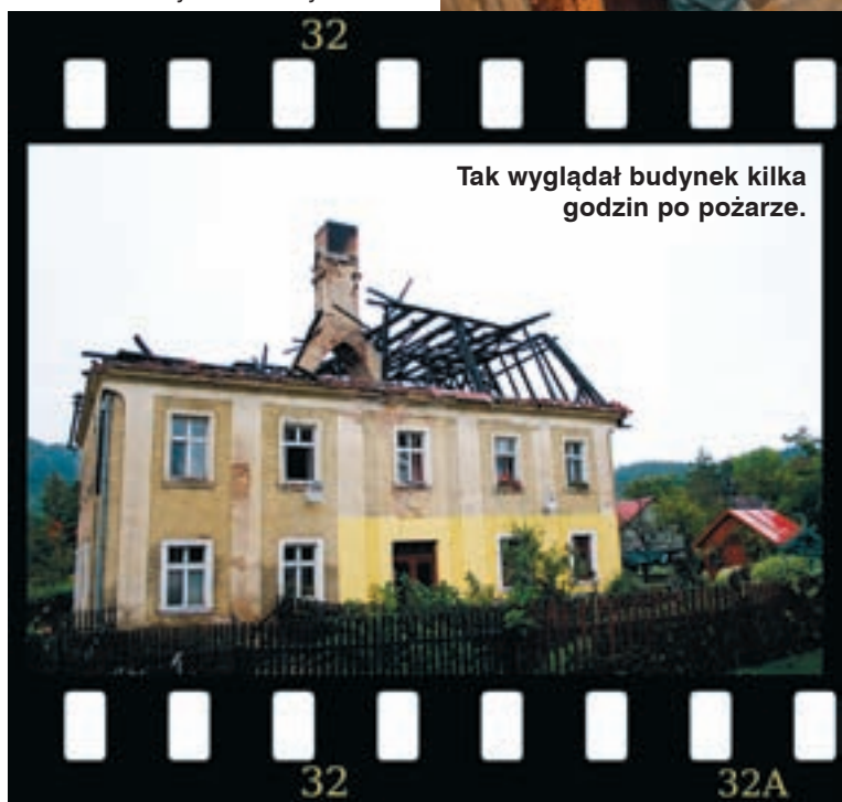
Tak wyglądał budynek kilka godzin po pożarze.