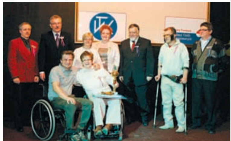
Laureaci wyborów Niepełnosprawnego Sportowca roku 2011.

Wybory odbyły się w czasie „Balu okularników” zorganizowanego w miniony piątek przez jeleniogórskie Towarzystwo Walki z Kiełctwem. W czasie imprezy wybrano także króla i królową balu oraz nagrodzono posiadaczy okularów najlepiej konweniujących ze strojem.