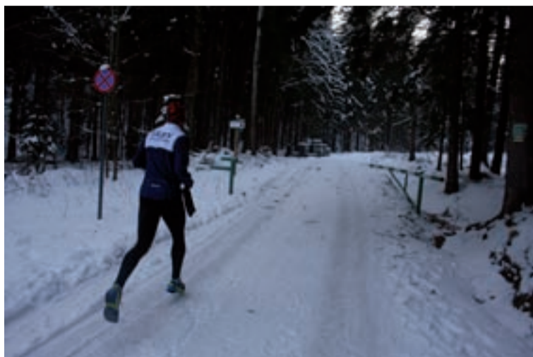
Trasa narciarska w Przesiece biegnie - wedle jej organizatorów - Droga pod Regłami. Nie ma po niej śladu. Nadaje się do biegania bez nart.

Na takiej drodze nie ma oczywiście mowy o bieganiu na nartach. Chodzenie jest możliwe, ale na takiej samej zasadzie można sobie pochodzić na deskach po każdej drodze, na której spadnie śnieg. Zdejmujemy narty i wracamy do samochodu.