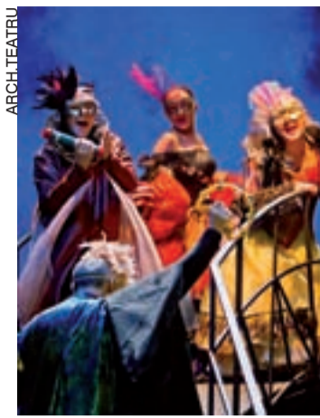
Bajką momentami nawet do uśmiechnięcia. Ale tylko bajką. Bajka ma to do siebie, że ogląda się ją z mniejszym lub większym