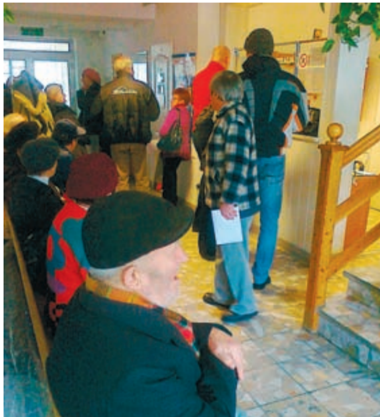
Największe kolejki ustawiają się do neurologa, a tych w naszym regionie jest jak na lekarstwo.