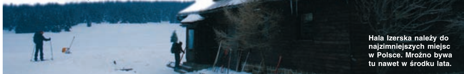
Hala Izerska należy do najzimniejszych miejsc w Polsce. Mroźno bywa tu nawet w środku lata.