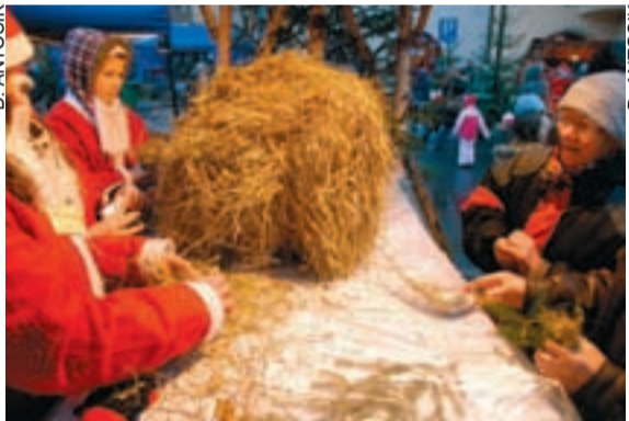
Dużym wzięciem cieszyło się rozdawane przechodniom sianko na świąteczne stoły przywieszzone w prezencie przez naszą redakcję.

Przenikliwie zimno i zacinający deszcz ze śniegiem nie przegoniły z rynku tych, którzy postanowili poczuć wspólnie prawdziwego ducha świąt. Gdy w powietrzu unosić zaczęły się radosne okrzyki Mikołajów i ze sceny popłynęły świąteczne melodie, niebo pojaśniało i zrobiło się znacznie cieplej. Po wspólnym kolędowaniu zespołów z Polski, Czech i Niemiec przyszedł czas na oficjalne powitanie Betlejemskiego Świata Pokoju. Orszak Betlejemski przemaszerał uli-