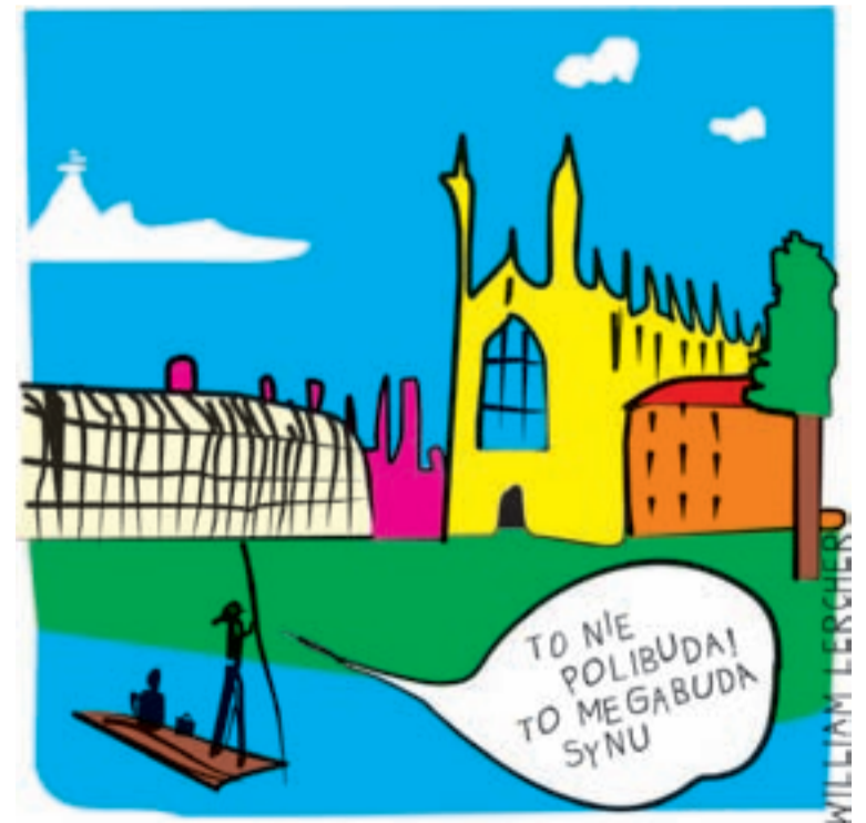
Czytaj: „Cambridge tylko dla mocnych” - str. 7

Mimo że przy samej obwodnicy północnej Jeleniej Góry nie brakuje pracy dla służb inwestycyjnych, technicznych itd. - przystąpiono już do przygotowywania założeń i projektów następnej trasy szybkiego ruchu, nazwanej roboczo - obwodnicą południową. Trasa ta będzie przeznaczona dla szybkiego ruchu w relacji Wrocław-Karpacz. Projekt techniczny obwodnicy południowej przygotowuje biuro projektów z Krakowa. W tym roku gotowa będzie już koncepcja. Władze miasta zamierzają zapoznać z nimi mieszkańców i poddać tę koncepcję pod szeroką dyskusję.