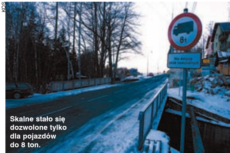
Skalne stało się dozwolone tylko dla pojazdów do 8 ton.