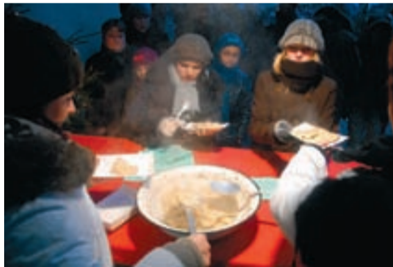
Organizatorzy przygotowali na plenerową biesiadę ponad tysiąc porcji pierogów i kilkaset litrów barszczu.

cami miasta tuż po zmroku. Harcerzom niosącym lampiony z symbolicznym płomieniem drogę oświetlały płonące pochodnie. Po odczytaniu przesłania Betlejemskiego Świata Pokoju na lwóweckim rynku zapłonęło mnóstwo świec. Gospodarze miasta podzielili się ze wszystkimi opłatkiem i dobrym słowem.