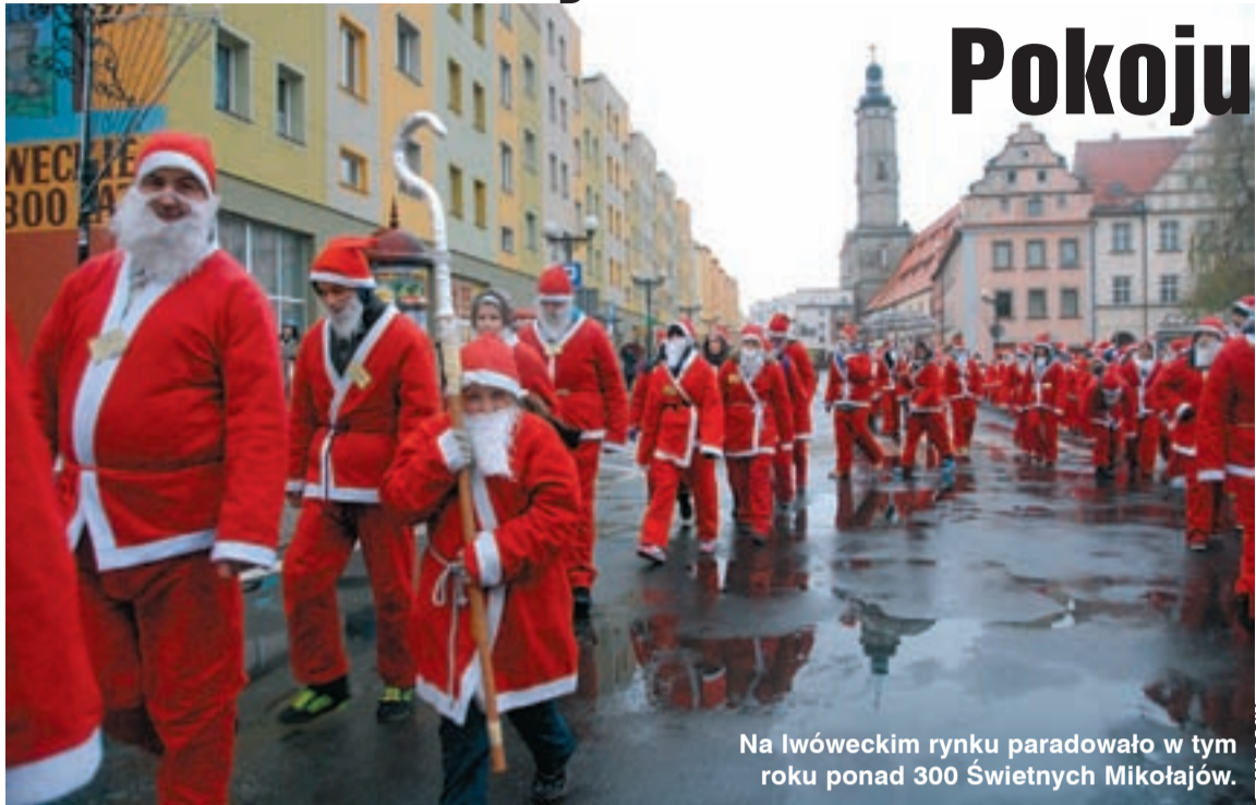
Na lwóweckim rynku paradowało w tym roku ponad 300 Świętych Mikołajów.

Rekordowy - ponadtrzyosobowy tłum Świętych Mikołajów paradował ulicami Lwówka Śląskiego podczas ubiegłotygodniowych, tradycyjnych Jasełek Ulicznych.