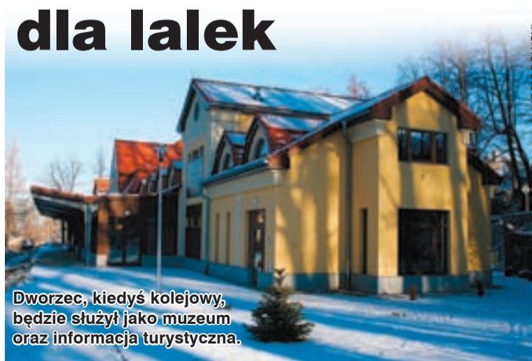
Dworzec, kiedyś kolejowy, będzie służył jako muzeum oraz informacja turystyczna.

Dworzec został powiększony między innymi o peron. Został on zabudowany