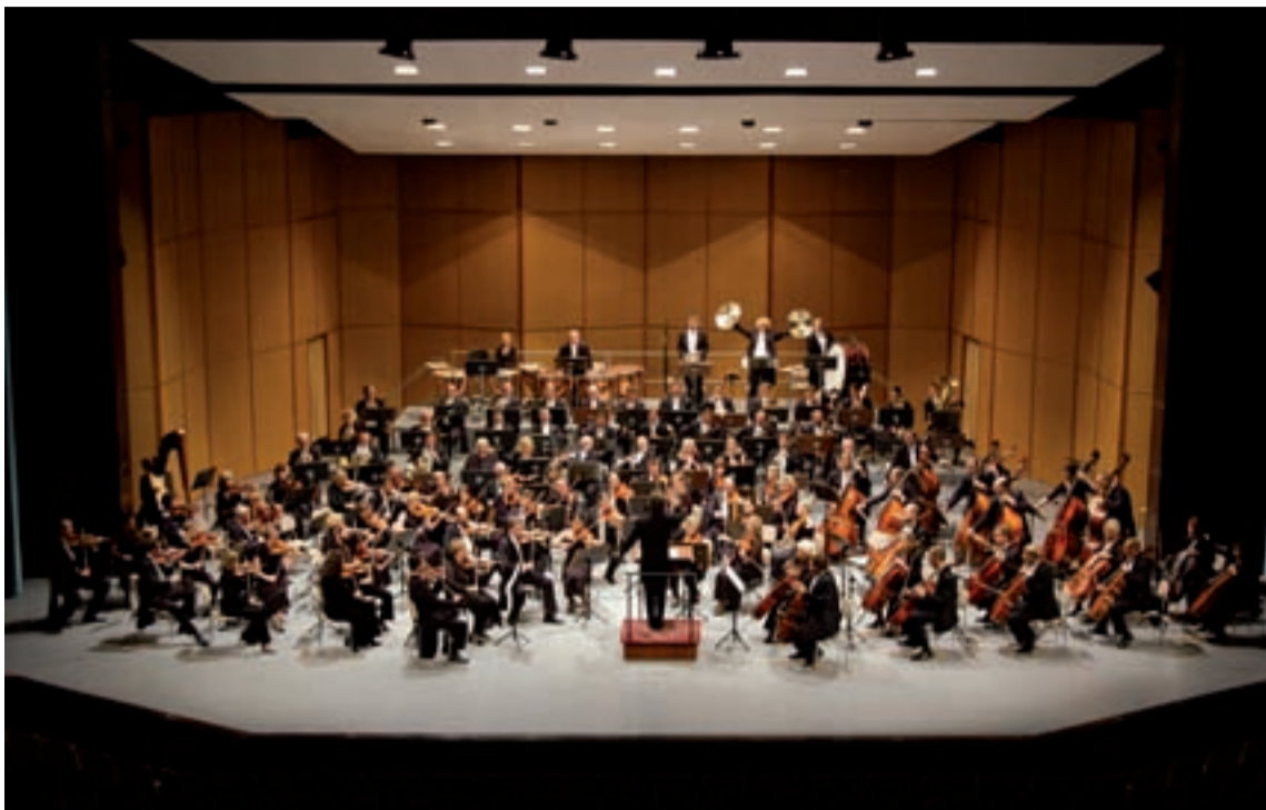
Jeleniogórska orkiestra symfoniczna od początków swojego istnienia często gra także poza własną salą koncertową. Na zdjęciu występ w niemieckiej miejscowości Hoyerswerda, podczas którego monumentalne dzieła wielkich klasyków wspólnie z naszymi filharmonikami wykonywali muzycy zaprzyjaźnionej Neue Lausitzer Philharmonie z Goerlitz.

Nasi symfonicy grają w słynnych salach koncertowych i na prestiżowych festiwalach muzycznych m. in.: