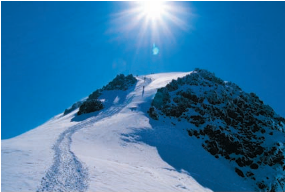
Kazbek nazywany jest „górami z lodową głową”.

Pięcioletnia ekipa. Wyruszyli 19 lipca, wrócili 4 sierpnia. Krótki wypad ze sportowym zacięciem. Samolotem do Tbilisi, dalej trzy godziny drogi gruzińską marszrutką do miejscowości Kazbegi, skąd można wyruszyć z plecakami w góry. Charakterystyczny, opuszczony kościół Gergeti na tle gór Kaukazu jest początkiem drogi na Kazbek. Pasterskie hale zmieniają się w kamieniste ścieżki. Jeszcze trzeba pokonać lodowiec pocięty