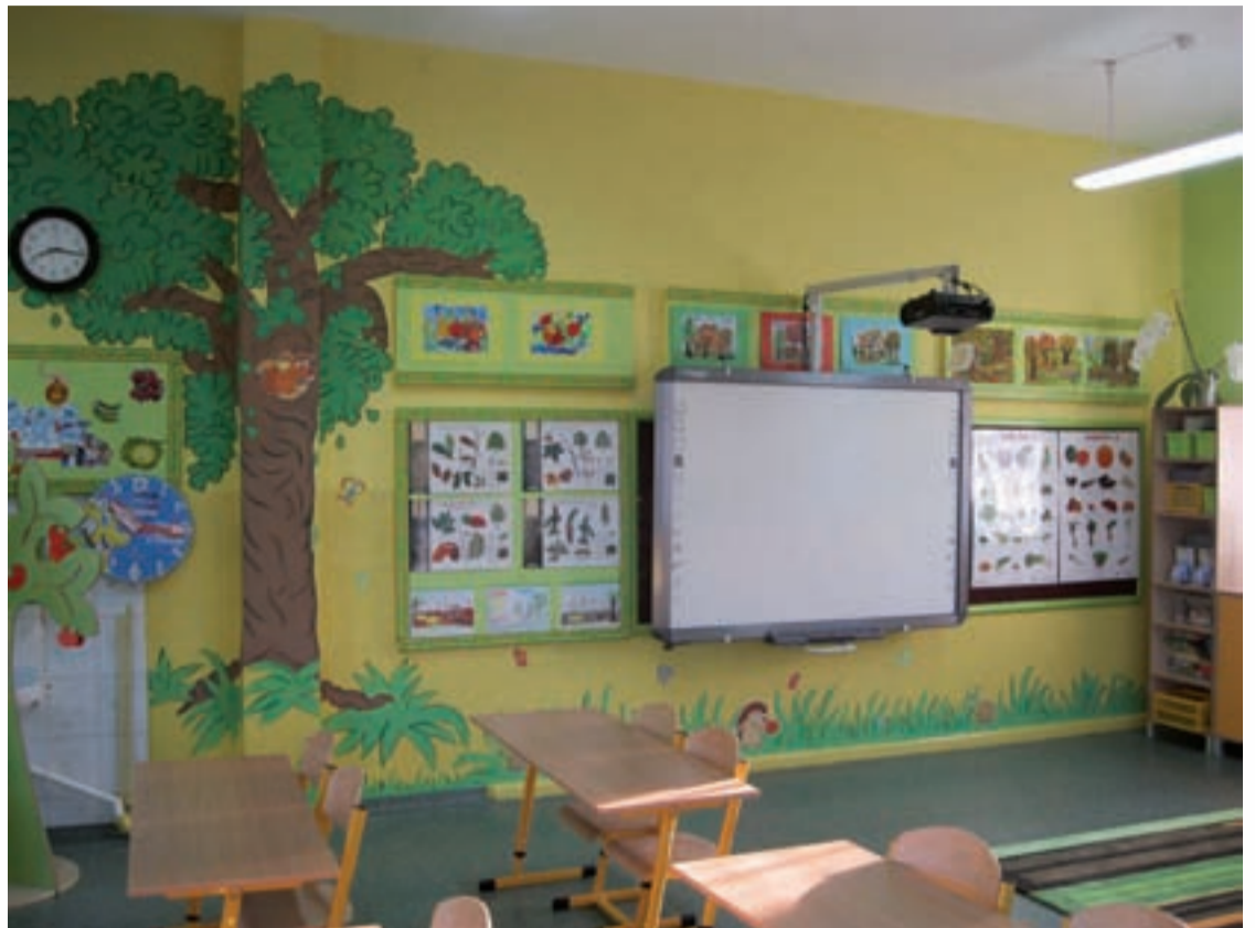
Sala przyrody w szkole w Stankowcach i hit tegorocznej akcji - tablica multimedialna.