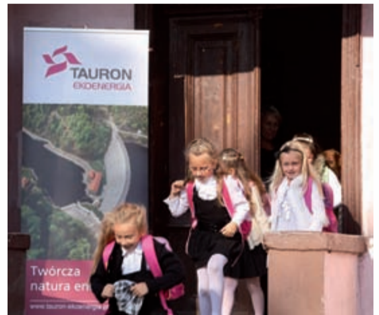
Uczniowie szkoły w Siedlęcinie.

TAURON Ekoenergia otrzymał nominat w plebiscycie Dolnośląski Klucz Sukcesu za rok 2010 w kategorii dolnośląska