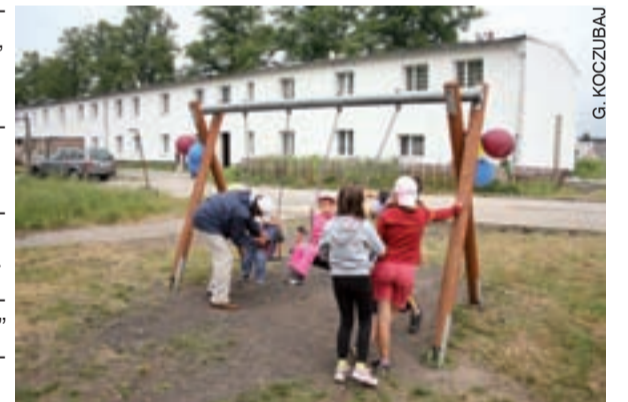
Plac zabaw przy ulicy Lwóweckiej zostanie rozbudowany.

Z kolei w domu dziennego pobytu przy ulicy Kilińskiego zostanie wyremontowana świetlica, w której planowana jest organizacja działalności dla młodzieży. Już dziś placówka świadczy dzienną pomoc dla seniorów, z zajęciami terapeutycznymi i kórkami zainteresowań włącznie.