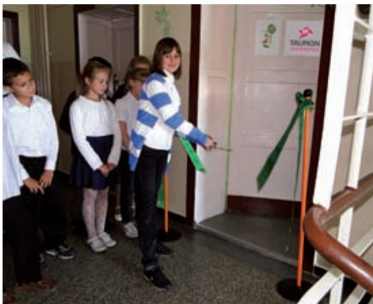
Uroczyste otwarcie Sali przyrody TAURON Ekoenergii w szkole w Osowcu.

społecznej TAURON Ekoenergii otrzymała po 40 tys. zł. Wyremontowane, wyposażone sale cieszą nauczycieli i rodziców, ale przede wszystkim to wielka radość dla uczniów, którzy sami zapracowali na nowe sale przyrody.