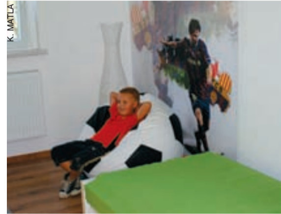
W wyremontowanych pokojach dzieciom będzie łatwiej zapomnieć o powodziowym koszmarze.