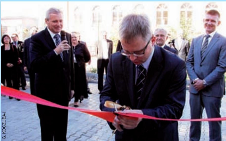
Uroczystość otwarcia nowej siedziby spółki.