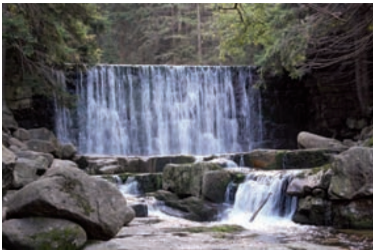
To właśnie pod tym wodospadem mieli Japończycy ukryć wywiezione z Berlina drogocenne przedmioty.

- Kiedy zmarła mi żona, postanowiłem kupić w Karpaczu dom - mówi. - Do miasteczka swego dzieciństwa sprowadziłem się siedem lat temu. W czasie jednej z wędrówek przypomniałem sobie o tym, o czym opowiadała mi kilkadziesiąt lat temu mały Niemiec. Poszedłem do burmistrza Malinowskiego i poprosiłem go, by zwrócił uwagę na to, co się przy wodospadzie dzieje... Sam zaś zacząłem