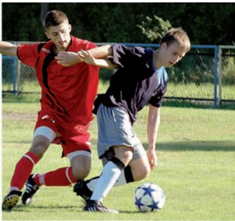
W meczu z liderem piłkarze z Radostowa stali na straconej pozycji.

Dystans do lidera tracą kluby z Sulikowa (remis) i z Rębiszowa. Piłkarze Skalnika do 30. minuty prowadzili w Studniskach Dolnych 3:0, a mimo to doznali porażki 3:4 i mają już siedem punktów mniej od Gryfa.