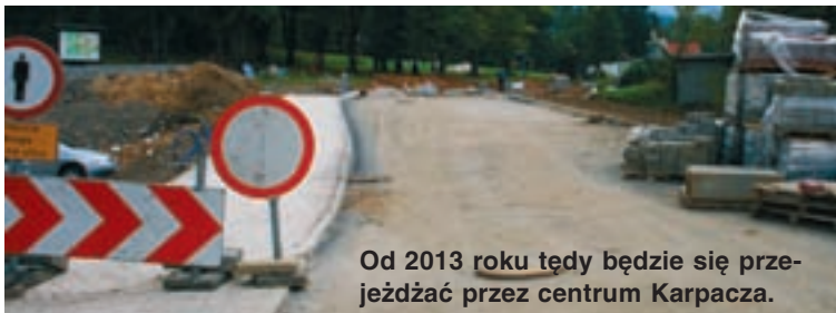
Od 2013 roku tędy będzie się przejeżdżać przez centrum Karpacza.

- Ludzie podchodzą do nas i pytają, dlaczego obwodnica jest znacznie węższa od ulicy Konstytucji 3 Maja?! - pytają radni Karpacza.