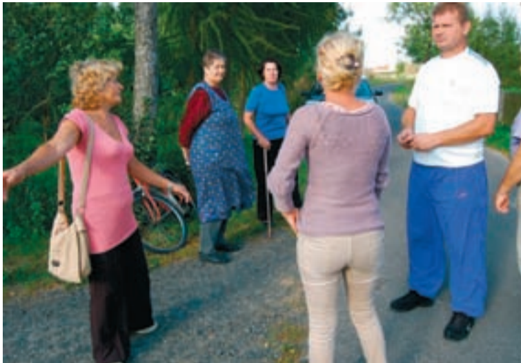
Mieszkańców Nawojowa nie interesuje, w jaki sposób Tepsa zamierza rozwiązać problem łączności. Płacą i chcą dzwonić.

E. Wyszyński, na podwórku którego stoi ów niedostępny słup, ma przykre