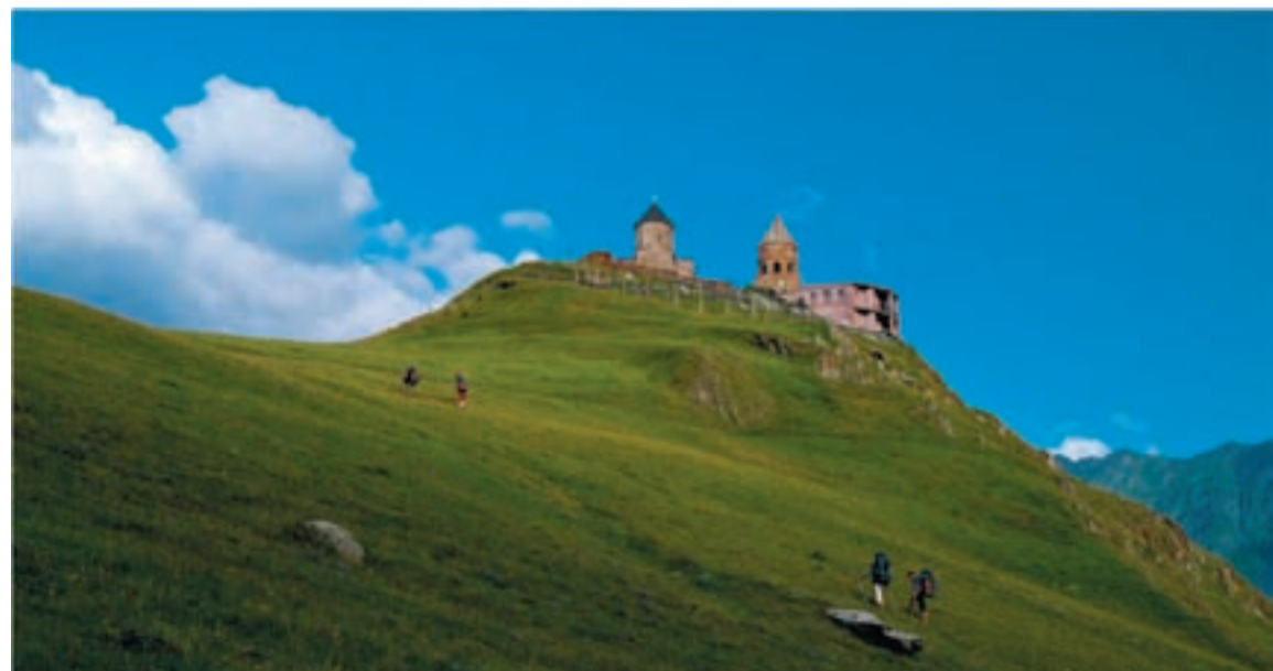
Gergeti Trinity Church (2170 m n.p.m). Początek drogi na Kazbek.

- Gruzja interesująca, góry fascynujące, ale... nie wiem, czy jeszcze tam wrócę - opowiada Remigiusz - Przeraził mnie upał na dole i „przesłodzeni ludzie”. Za wszelką cenę chcieli uszczęśliwić turystów. Ich gościnność nie była bezinteresowna.