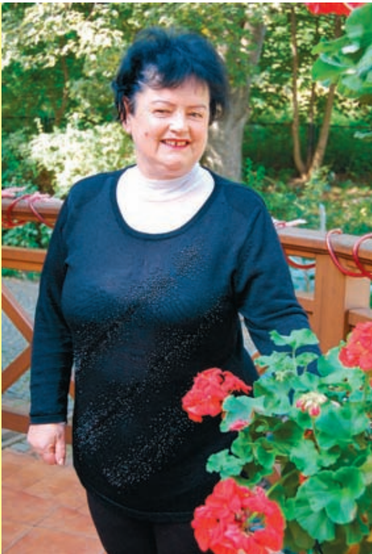
zerwana. Nadrabiam miną, pytam „ile płacę?” i słyszę: „ma pani gratis”. Uroczy Grek wysadził mnie w Atenach, idę na policję, a tam... Matka Boska na obrazku u komendanta wisi. Pomyślałam, że się dogadamy. I rzeczywiście. Po kilku godzinach poszukiwań komendant odnalazł moją wycieczkę. I tak grecki marynarz, komendant i Matka Boska pomogli mi wrócić do Marianny i do domu”.

„Mieszkałyśmy w hotelu, 50 km od Aten. Wybrałyśmy się na wycieczkę statkiem na trzy wyspy. Na jednej z wysp odłączyłam się od grupy, pochłonęły mnie zakupy i... spóźniłam się na statek dwie godziny. Bez znajomości języka, bez rzeczy i dokumentów, które zostawiłam na statku, nie wiedziałam, jak wrócić. Nie pamiętałam nawet nazwy hotelu, gdzie mieszkamy. I nagle widzę: w porcie stoi luksusowy statek o pięknej nazwie „Oazis”. Jeszcze bardziej spodobał mi się... marynarz. Po niemiecku rozmawiał jeszcze gorzej niż ja, ale zabrał mnie do Aten. Na pokładzie orkiestra gra, kelner przynosi smakołyki. Ja w kieszeni mam niewiele pieniędzy, a na dodatek nie można się dodzwonić do Polski, ponieważ właśnie w tym dniu Ateny nawiedziło trzęsienie ziemi i łączność była