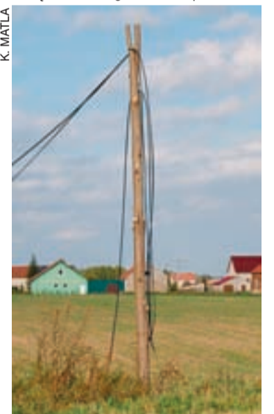
W tym miejscu kończy się łączność w Nawojowie. Jak długo jeszcze kable będą dyndać w powietrzu?

- Pan ten w 2006 r. podpisał z TP umowę, zgodnie z którą zgodził się na realizację zadania inwestycyjnego na swojej posesji - informuje M. Piskier. - W tej chwili mamy do czynienia z sytuacją patową: właściciel gruntu nie wpuszcza TP