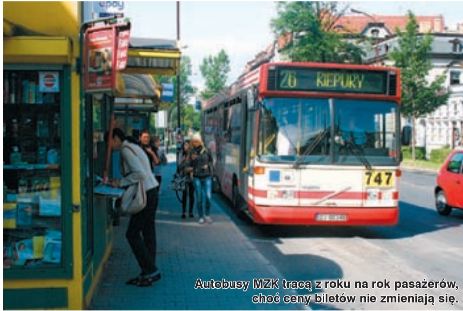
Autobusy MZK tracą z roku na rok pasażerów, choć ceny biletów nie zmieniają się.

W negocjacjach z władzami firmy załogę reprezentuje Związek Zawodowy Pracowników Komunikacji Miejskiej w RP oraz Solidarność. Razem zrzeszają niemal dwieście osób. Wszystkich pracowników w MZK jest 272. Ci, z którymi rozmawialiśmy, podkreślają, że koszty życia drastycznie rosną, w wielu branżach pracownicy otrzymują podwyżki, a oni od kilku lat zarabiają tyle samo.