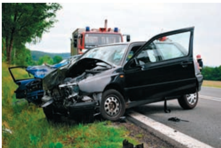
Mazda zderzyła się z volkswagenem, trzy osoby trafiły do szpitala.

- Kierujące mazdą i golfem, a także jeden z pasażerów, trafili do szpitala - mówi B. Kotowski. Było