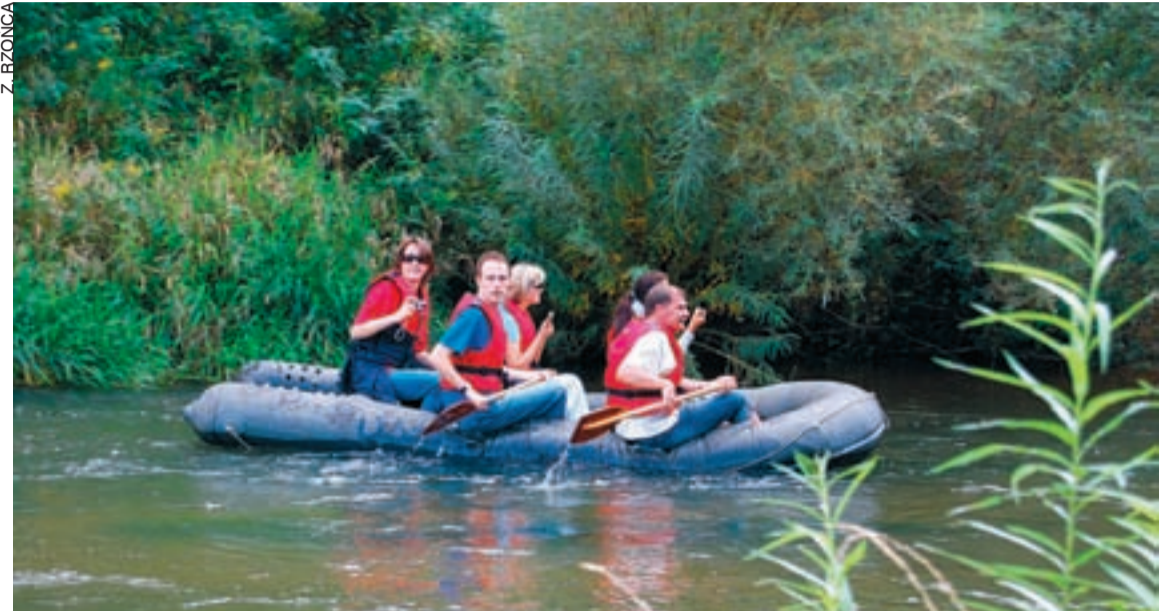
Jedną z mało znanych atrakcji turystycznych są spływy pontonowe po Kwisie.