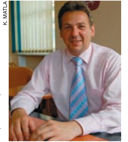
Burmistrz Lubania Arkadiusz Słowiński.

Przez najbliższe trzy lata nie powinna wzrosnąć stawka bazowa czynszu w lokalach komunalnych. W bieżącym roku, zarządzeniem burmistrza, wzrosła ona znacznie, aż o 40 proc. - po to, żeby zmotywować najemców do wykupu zajmowanych lokali. Cały czas trwa promocja, można wykupić mieszkanie za 1 proc. jego wartości. - Tam gdzie jest wspólnota, jest lepsze gospodarzenie - uważa burmistrz. Poza tym miasto stara się łagodzić skutki społeczne podwyżek cen mediów. Tegoroczna podwyżka wyniosła 0,2 proc. ponad prognozowaną inflację. Za 1 m sześć. wody mieszkańcy miasta płacą 2,85 zł brutto, a za 1 m sześć. ścieków 5,11 zł brutto (gospodarstwa domowe) oraz 7,35 zł brutto (pozostali odbiorcy).