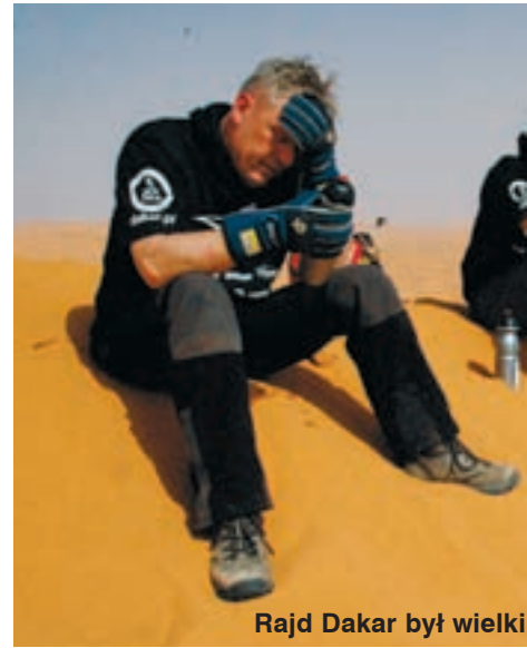
Rajd Dakar był wielki

Wyobrażał sobie, że będzie land roverami przemierzał bezdroża Ukrainy, Rumunii. Ale nie wiedząc o tym, przed 10 laty kupił land rovera do tzw. wycieczki ekstremalnej.