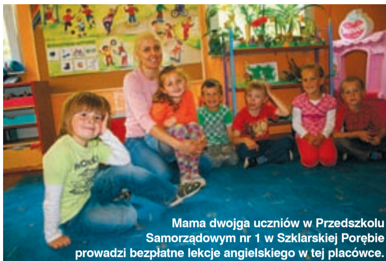
Mama dwojga uczniów w Przedszkolu Samorządowym nr 1 w Szklarskiej Porębie prowadzi bezpłatne lekcje angielskiego w tej placówce.

Przed rezygnacją z czesnego, do przedszkoli chodziło około 60 procent dzieci w mieście. Dziś jest to ponad