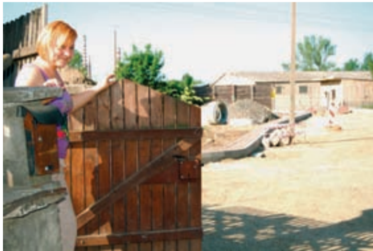
Jak Pani Ania otwiera furtkę, to zajmuje kawałek pasa drogi.

Droga choć powoli, to jednak powstaje. Codziennie kawałek. Budowlańcy dotarli właśnie do furtki w płocie