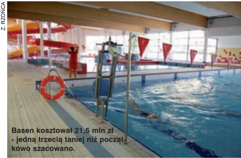
Basen kosztował 21,5 mln zł - jedną trzecią taniej niż początkowo szacowano.

- Postanowiliśmy więc poszukać ratowników na własną rękę - mówi prezes Tomczyk. - Chętnych znaleźliśmy we Wrocławiu.