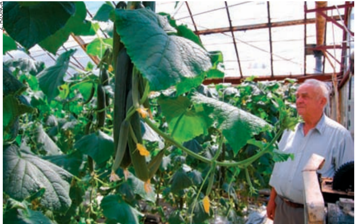
- Nasze ogórki są dorodne, pyszne i zdrowe - zapewnia Henryk Pawliński.