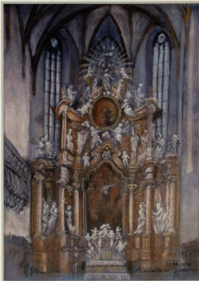
Jelenia Góra. Bazylika Mniejsza pw. Św. Erazma i Pankracego, ołtarz główny (21.09.2012)

2012 - Rumia, Wieluń, Załęcze, Krzeszów, Jelenia Góra x 3