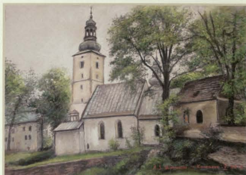
Komarno. Kościół pw. Jana Chrzciciela (maj 2012)