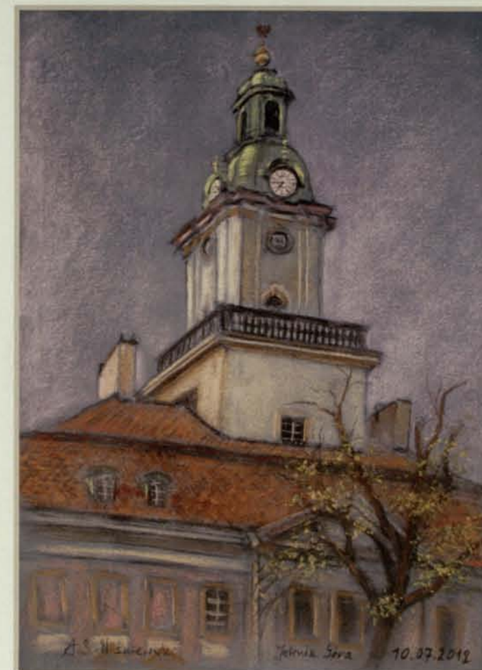
Jelenia Góra. Ratusz (10.07.2012)