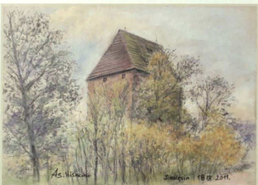
Siedlęcín. Mieszkalna wieża rycerska (18.09.2011)