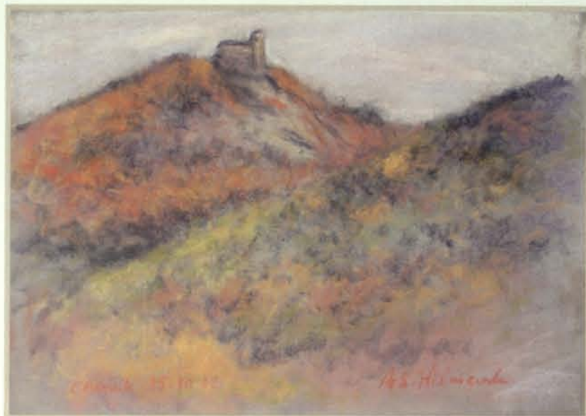
Jelenia Góra - Sobieszów. Zamek Chojnik (15.10.2012)