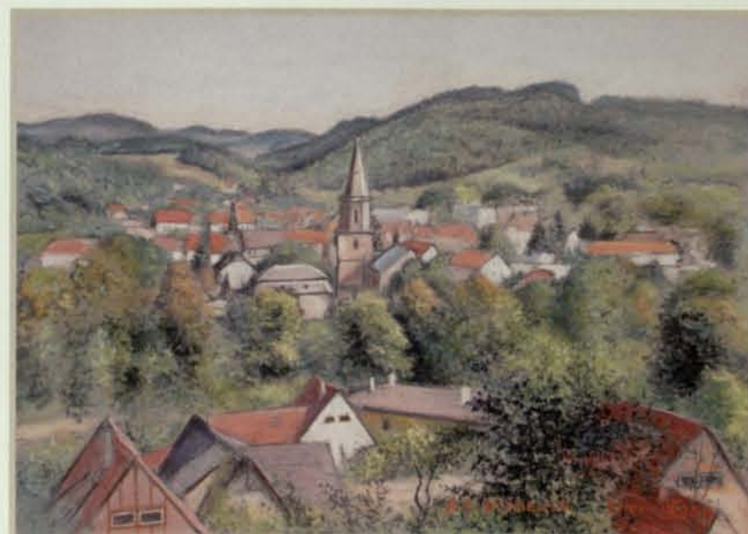
Wleń. Panorama miasta (wrzesień 2011)