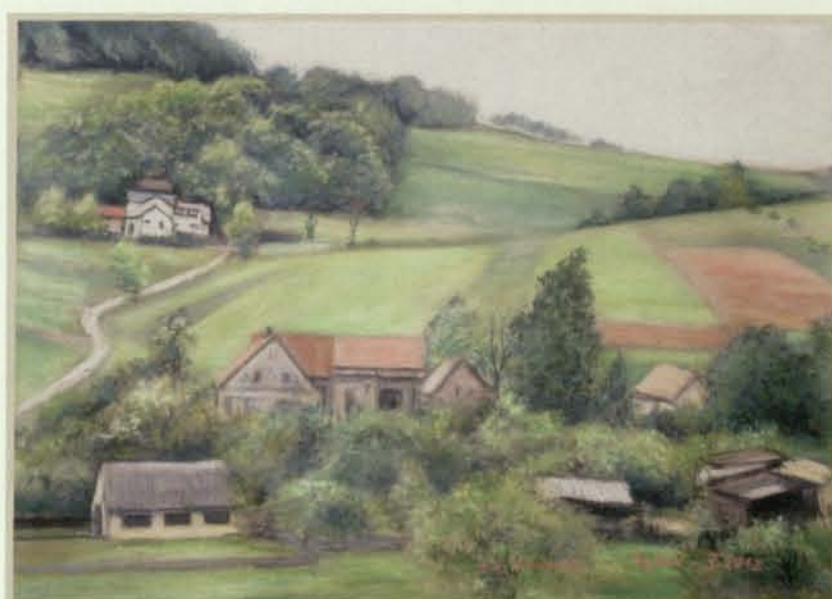
Mysłów (maj 2012)