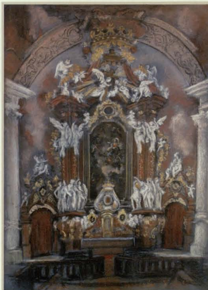
Krzeszów. Kościół Opacki pw. Łaski N.M.P., ołtarz główny (2-12.10.2012)