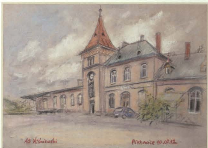
Piechowice. Dworzec kolejowy (10.07.2012)