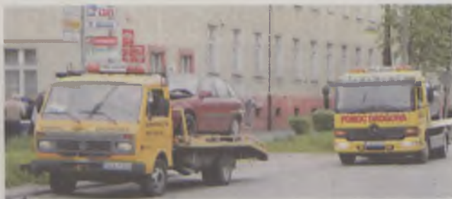
Pomoc drogowa wywozi stłuczone samochody