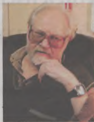
Autor projektów - Michał Marciniak-Kożuchowski

Lilie wypełniają środkową i górną część pola tarczy. Lilia jest ważnym akcentem w miejsce krzyża w znaku osobistym księcia Henryka I Brodatego (półksiężyc z krzyżem) oraz krzyża, jaki znalazł się w środku łuku półksiężycy, na piersi orła czarnego - księcia Henryka II Pobożnego. Kilka miejscowości w gminie J-L w czasie kształtowania się urbanistycznego i historycznego tego