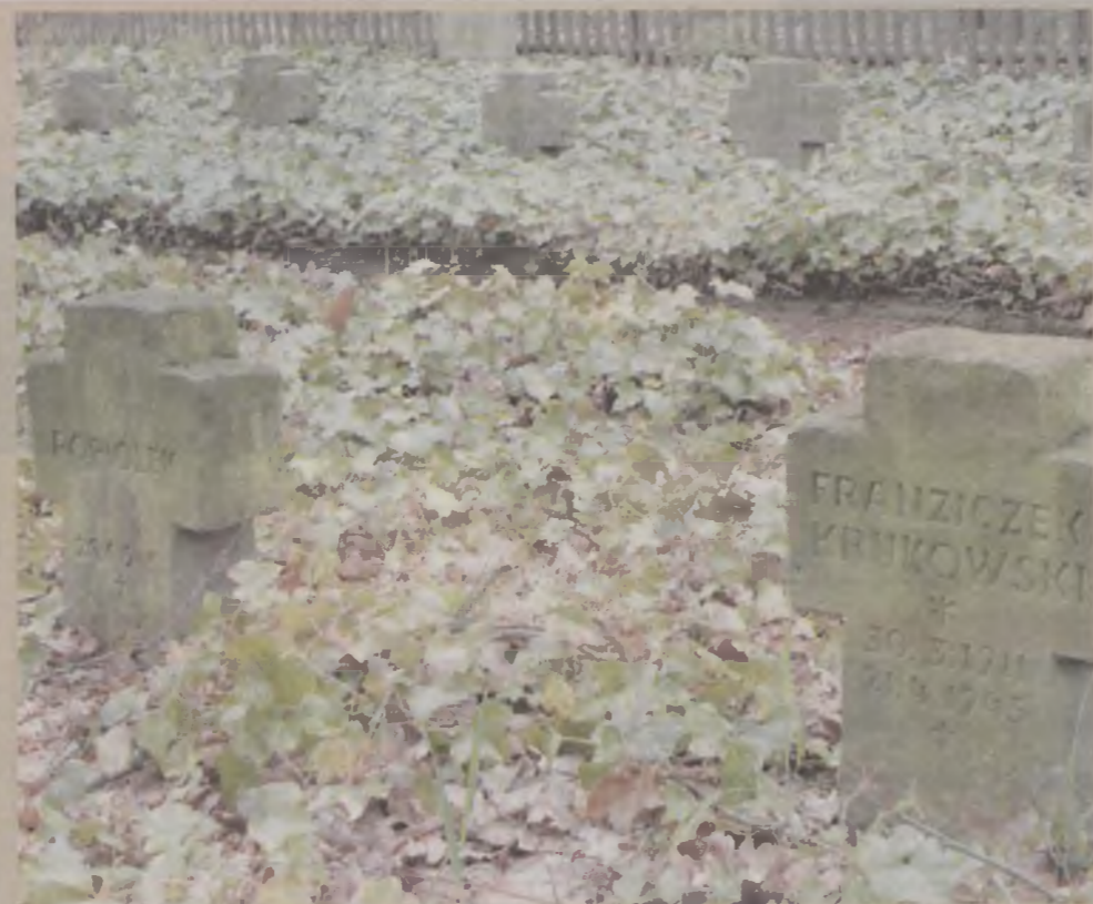
Kamienne krzyże na cmentarzu w Thuine znaczą ofiarę polskich żołnierzy