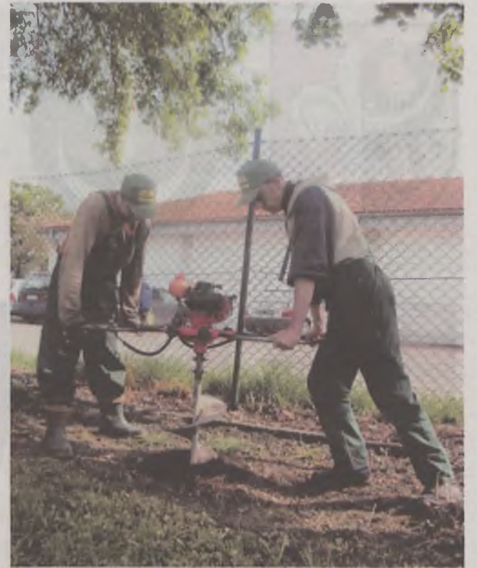
Pracownicy Zarządu Dróg Miejskich i Zieleni przygotowywali miejsca na sadzonki

TEKST I FOT.: MALWINA GADAWA malwina@gazeta.olawa.pl