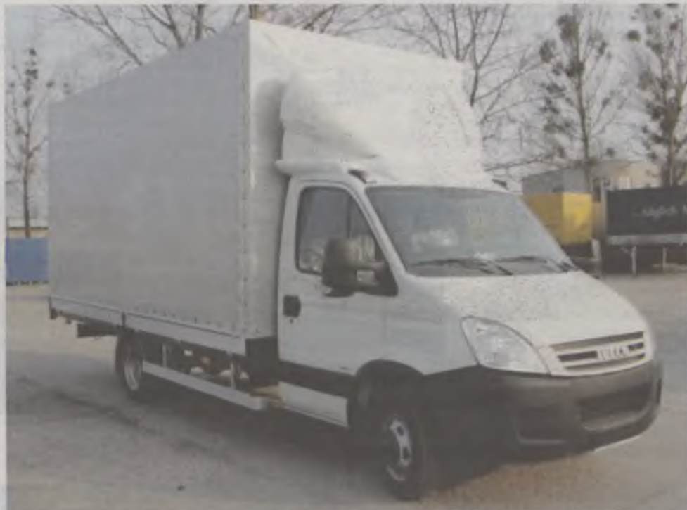
Taki samochód skradziono firmie „Ziarno”