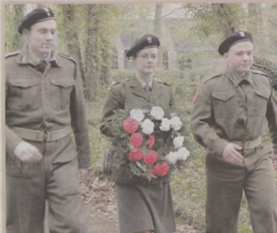
Składanie wieńców odbyło się przy zachowaniu pełnych honorów wojskowych