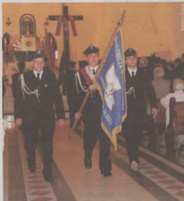
Nie zabrakło pocztów sztandarowych Ochotniczej Straży Pożarnej