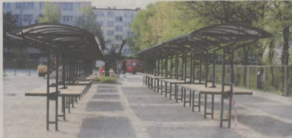
Nowe miejsce do handlowania czeka na kupców