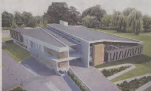
Tak wygląda makieta olawskiej krytej pływalni

* sali gimnastycznej, mogącej pełnić także rolę siłowni,