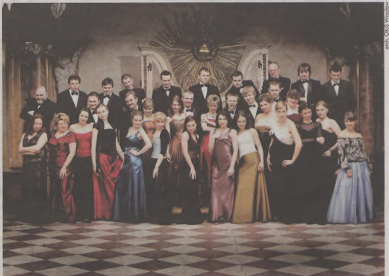
(MAG) Chór Filharmonii Wrocławskiej wystąpi 19 maja w kościele pw. św. Antoniego we Wrocławiu, ul. św. Antoniego 30