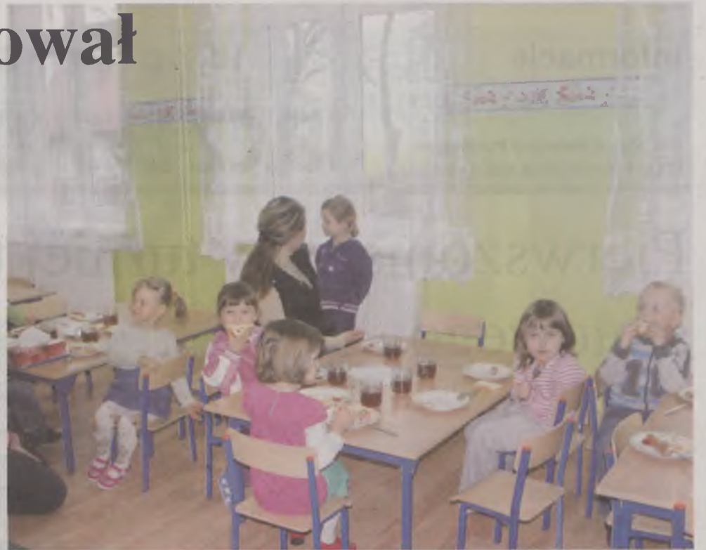
Pierwszy posiłek. Kiełbaski i soczek... pycha!