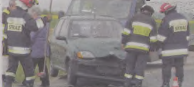
Na miejscu kolizji pracowali strażacy