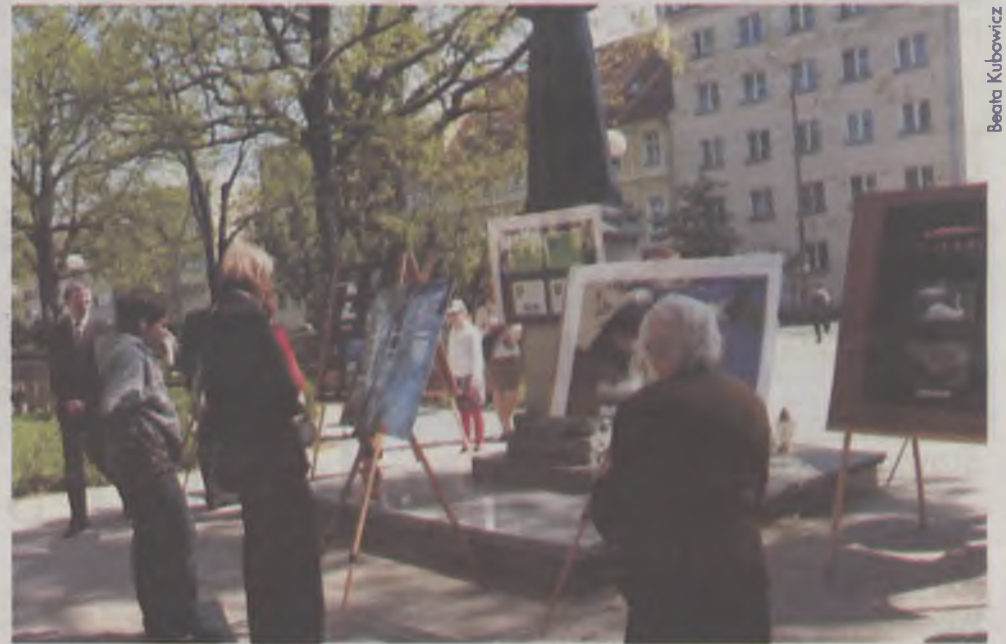
Wystawa zdjęć pod hasłem „Budzić nadzieję” stanęła wokół pomnika Jana Pawła II