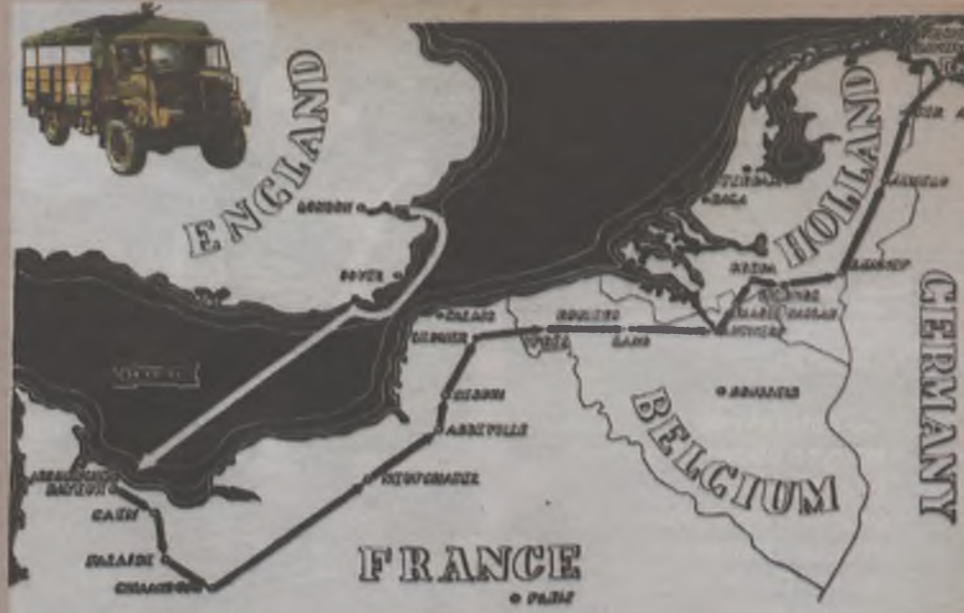
SZLAK BOJOWY PIERWSZEJ DYWIZJI PANCERNEJ GEN. ST. MACZKA

XAWERY PIŚNIAK xapi@gazeta-olawa.pl