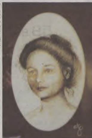
Jedna z prac, którą można obejrzeć w galerii "Oko"