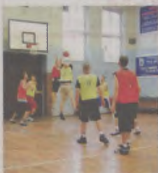
Walka w turnieju była emocjonująca