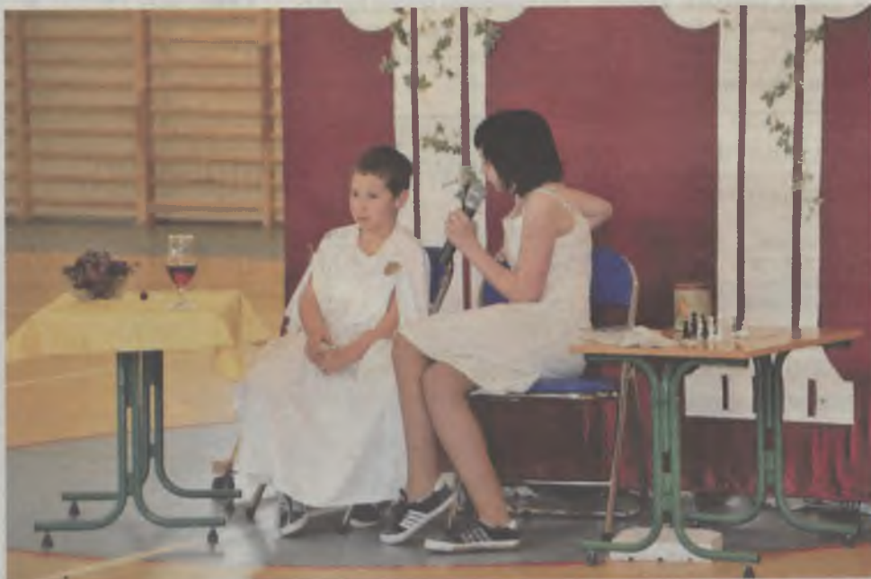
Uczniowskie przedstawienie teatralne nawiązywało do tematyki olimpijskiej

TEKST I FOT.: PIOTR WAŁĘCIAK pw@gazeta.olawa.pl