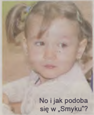
No i jak podoba się w „Smyku”?

Zajęcia rozpoczęło 15 przedszkolaków. W czasie