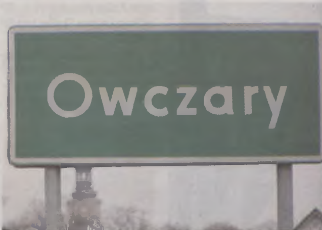
Owczary przed wojną nazywały się Tempelfeld

Nazwy niemieckie nie wymagają wyjaśnienia, mogą natomiast dziwić powojenne nazwy gmin, uwzględniające podział administracyjny powiatu z lat