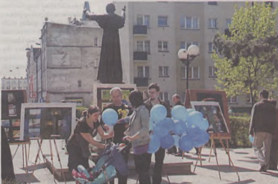
W zamian za datek, ofiarodawcy otrzymywali żonkile lub baloniki