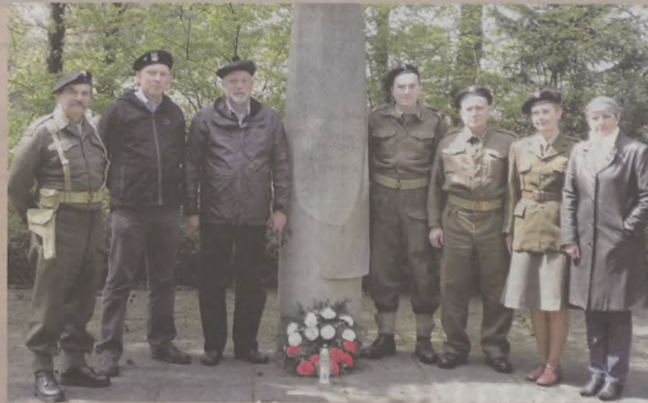
Uczestnicy wyprawy na cmentarzu polskich żołnierzy w Oberlangen