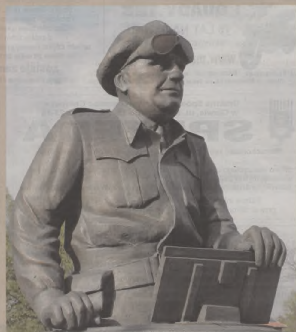
General Stanisław Maczek to jeden z największych polskich bohaterów II wojny światowej