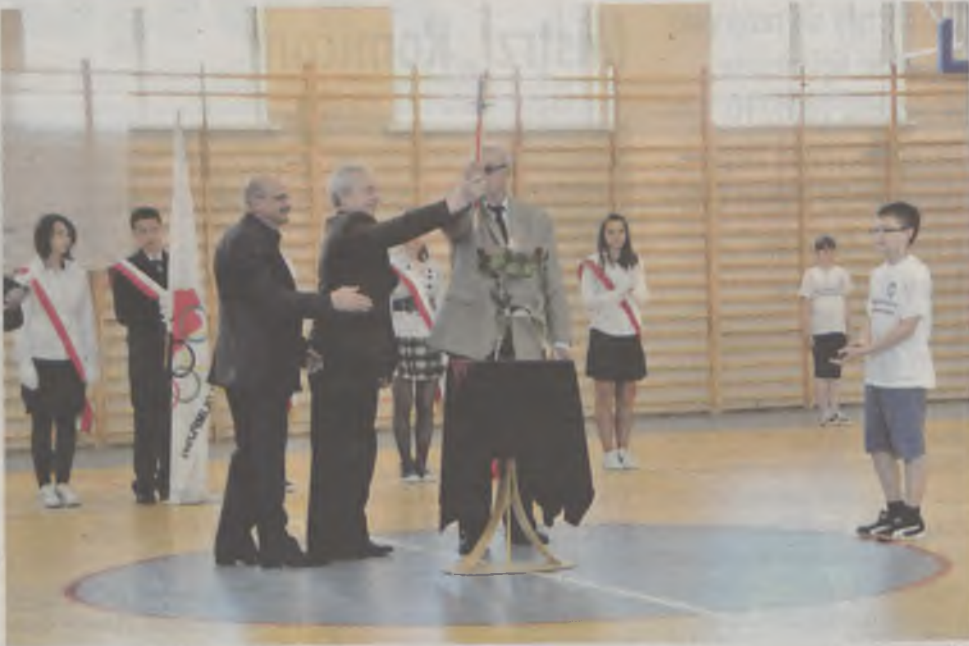
Zapalanie olimpijskiego znicza