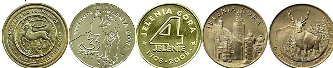
Zdjęcia monet z kolekcji Zofii Wąsik