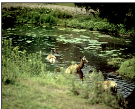
Łanie kąpią się w stawie

fauny, stanowi stałą część krajobrazu i tak jak niegdyś daje o sobie znać w mroźne jesienne wieczory głośnym rykiem i wspaniałymi godami (rykowiskiem), słyszany na turystycznych ścieżkach i pod schroniskami Karkonoszy, Izerów oraz Gór Kaczawskich. W czasie śnieżnej zimy jelenie można spotkać wokół naszego miasta. Według inż. F. Kolba: Jelenie, kiedy „budują” wieńce, bardzo chętnie zjadają mchy zwisające z gałęzi starych drzew, gdyż składniki w nich zawarte (fosfor), działają na rozwój ich poroża. Jeżeli mchu brakuje zmuszone są objadać gałązki młodych drzew świerka, olchy i brzozy. To jednak przynosi wielkie szkody dla gospodarki leśnej. Innym ulubionym żerem jeleni jest jemiola, którą zjadają z zachłannością, a zapach jej nie pozwala odejść z miejsca żerowania. Dlatego też jemiola używana jest jako wabik przy ocenie i podawaniu zwierzyńnie środków leczniczych.