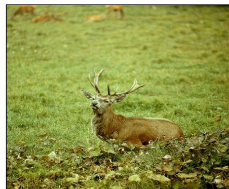
Jeleń na rykowisku