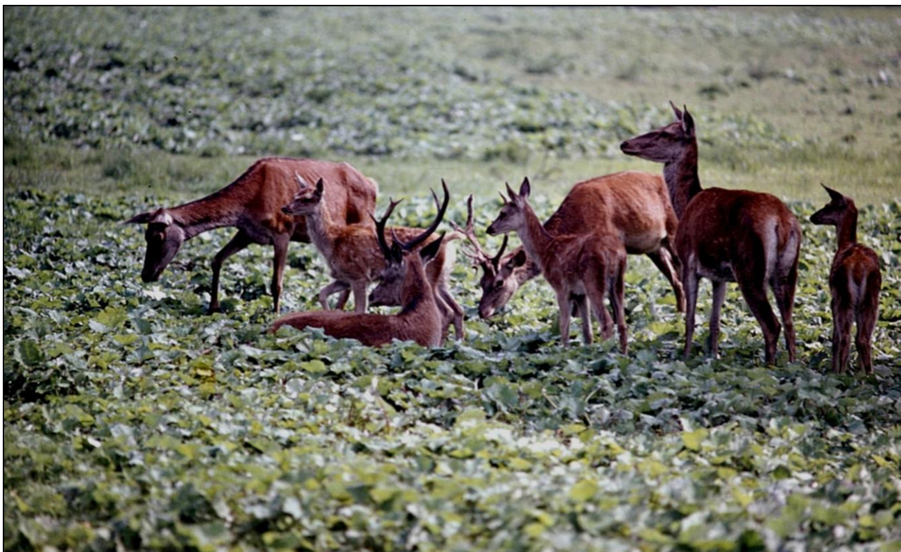
Chmara jeleni na „podkowie”, widziana z ambony wczesnym rankiem w 500 mm obiektywie

migawką i mimo, że odległość była ponad 100 m jelenie w obiektywie były wyraźne. Widocznie jednak wyczuły moją obecność, bo spokojnie, bez szmeru się oddaliły. Fotografie, które wówczas wykonałem pokazał „Łowiec Polski” i podziwiane były na kilku moich wystawach.