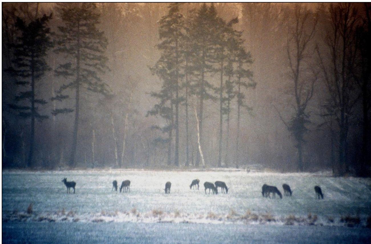
Jelenie ukazały się w nocy jak duchy, chmara zgęstniała w zimnym blasku księżyca.

Las stał się moim największym sprzymierzeńcem, w nim cisza i dzika zwierzyna była wielkim pragnieniem i miłością, a przy odrobinie szczęścia zakończona niepowtarzalnym trofeum. Jestem myśliwym, oprócz strzelby zawsze ze sobą noszę aparat fotograficzny i notatnik. Okryty maskującą siatką wybieram wizurki, które przekraczają leśni mieszkańcy. Zastygam w nich na długie godziny w oczekiwaniu na spotkanie i zdobycie tego jedyne trofeum, które może, lecz nie musi się zdarzyć, a może być dobrą fotografią, rysunkiem czy tylko pozostanie strzępem przyrody w moim pamiętniku.