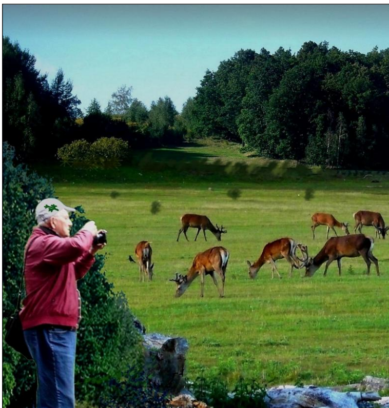
Wczesnym rankiem na łąkach można spotkać jelenie.

Jelenie żyły niegdyś w całej Europie. Znikły częściowo z terenów Francji, stan jeleni zmniejszył się do minimum w Anglii i Irlandii. Przestały istnieć w Rosji pozaeuropejskiej, nie obierały ostoi ze względu na ostry klimat. W Szwecji występują tylko nielicznie, rzadko w Szwajcarii. Po II wojnie światowej najliczniej zachowały się w Polsce, Niemczech, Austrii, Czechach, na Węgrzech i w Szkocji oraz na Bałkanach. Są to zwierzęta potrzebujące większych kompleksów leśnych, najbardziej lubią tereny pagórkowate z drzewostanem liściastym: dąbrowy i buczyny, gdzie owoce tych drzew są większe. Najokazalszy jest jeleni górski. Na międzynarodowej wystawie berlińskiej w 1937 r. największe trofeum pod względem poroża zdobył „jeleni karpacki”. Niemcy nadali mu miano szlachetnej zwierzyny.