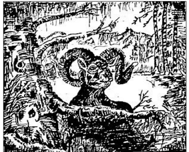
Tryk w Borach Przesieckich . Grafika: Zbigniew Adamski

Muflon ma silną, krepą budowę ciała o krótkiej szyi, biegi (nogi) mocne. Jest dobrze przystosowany do warunków w górzystym środowisku. Suknia jego latem jest ceglastobrązowa na grzbiecie ciemniejsza, gęba i brzuch oraz lustro są białe. Zimą sierść staje się kasztanowobrązowa. Stare sztuki mają białe siodło, a szyję zdobi czarna grzywa. Zwierzę zdobią rogi (ślimy), których nie zrzuca, odrastają mu one w nasadzie. Ślimy u tryka wygięte są do dołu, tworząc literę c, albo zakręcają się w koło. Owce nie mają rogów, żyją w kerdelach, którymi rządzi doświadczona starsza owca.