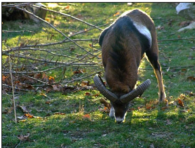
Dorosły tryk koło Zachelmia.