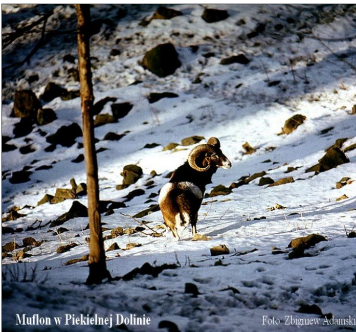
Muflon w Piekielnej Dolinie