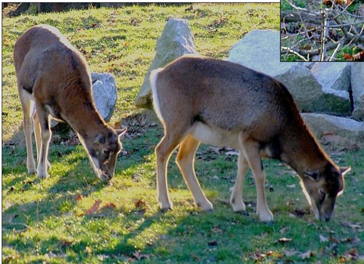
Owce żerowały najchętniej osobno.