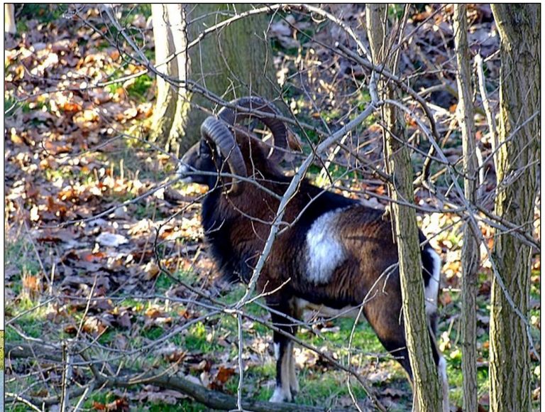
Muflon widziany ze ścieżki pod Chojnikiem

„Barany z Piekłnej Doliny. Przełęcz Żarska jest dobrze widoczna spod Chojnika. Jesienią lubiłem tu przebywać na półce skalnej i podglądać przyrodę. Naprzeciw miałem wyjątkowo piękny krajobraz, dostarczający sporą dawkę adrenaliny ze względu na spadziste zbocze skalne i barwne o tej porze roku lasy – złotem i miedzią zabarwione buki, żółte brzoźki i czarne jak otchłań pod światło bory świerkowe”. Fragment książki autora pt. „W KRÓLESTWIE DIANY” wydanej przez ZO PZŁ w Jeleniej Górze 2004 r.