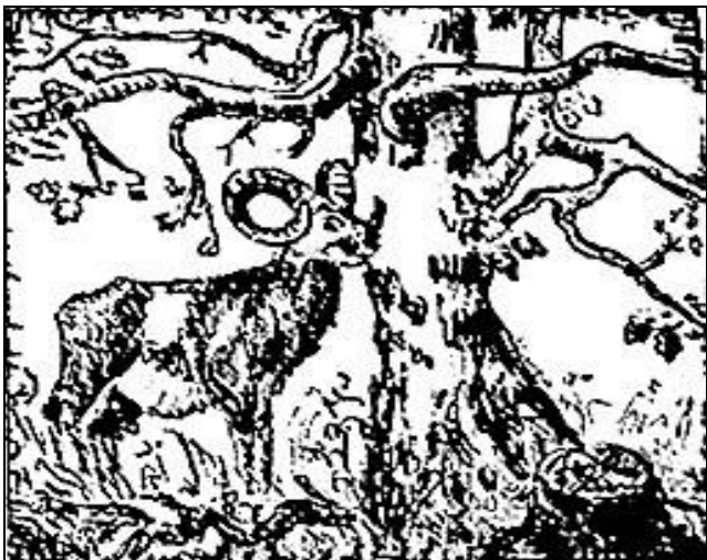
Muflon na górze Żar.