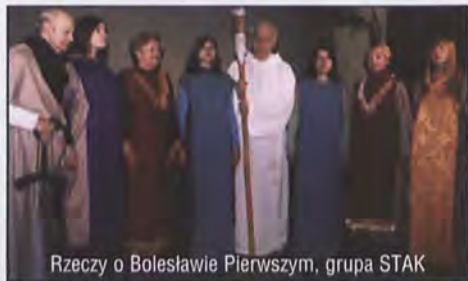
Rzeczy o Bolesławie Pierwszym, grupa STAK