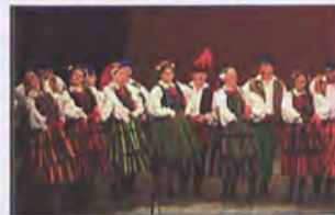
Jubileusz 50-lecie zespołu Wrocław