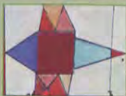
Jerzy Nowosielski Zima w Rosji, 1947