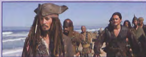
PIRACI Z KARAIBÓW: NA KRAŃCU ŚWIATA

szczegółowych informacji o projekcjach udzielamy telefonicznie w kasach kin oraz na stronie internetowej www.odra-film.wroc.pl