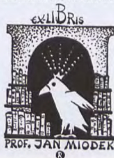
PROF. JAN MIODEK

Autor tworzy znaki książkowe od 1949 roku. Wykonał ich przeszło 900, eksponował je na ponad 150 wystawach w kraju i za granicą. Wystawę można oglądać do 15 czerwca br. w witrzynach biblioteki Biblioteka nr 27, ul. Łokietka 13