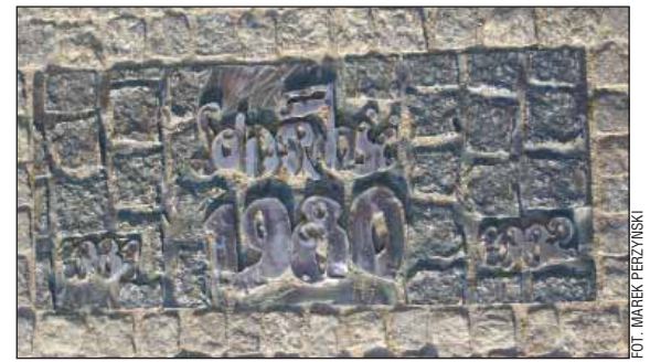
Historyczna ścieżka Wrocławia, płyta upamiętniająca powstanie NSZZ „Solidarność”

HISTORYCZNA ŚCIEŻKA WROCŁAWIA , 19 płyt z brązu (wraz z tablicą tytułową), upamiętniających kluczowe wydarzenia w historii stolicy Dolnego Śląska – od utworzenia biskupstwa w 1000 r. przez m.in. powstanie Uniwersytetu Wrocławskiego i NSZZ „Solidarność” po mistrzostwa Europy w piłce nożnej Euro 2012. Podczas rewitalizacji pl. Nankera zostały wmontowane w chodnik wzdłuż klasztoru sióstr urszulanek, poczynawszy od strony ul. Uniwersyteckiej, a udostępnione