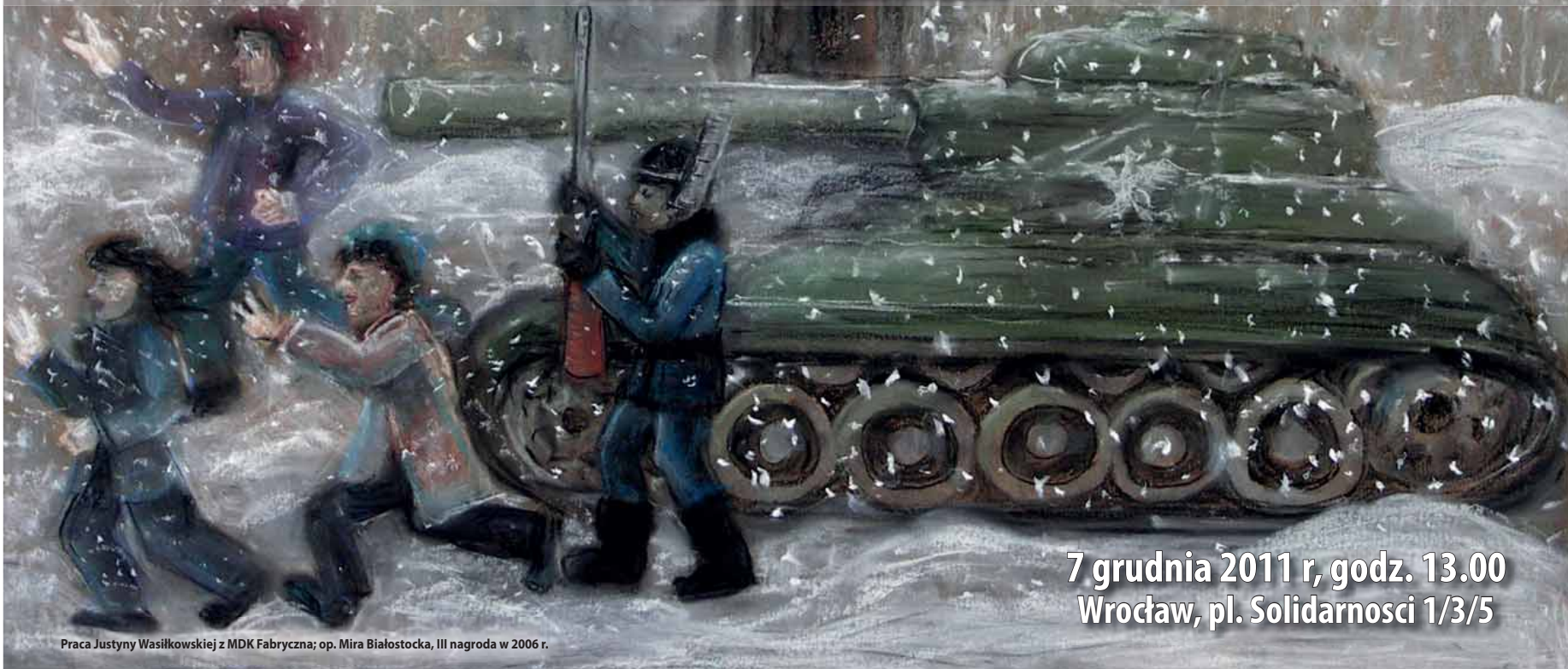
Praca Justyny Wasilkowskiej z MDK Fabryczna; op. Mira Białostocka, III nagroda w 2006 r.

7 grudnia 2011 r, godz. 13.00 Wrocław, pl. Solidarnosci 1/3/5