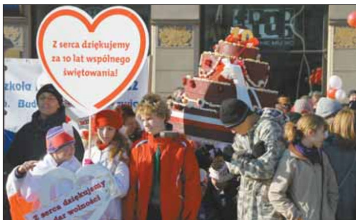
FOT. PAWEŁ CHABIŃSKI