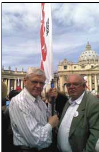
FOT. KZ MOZ POLAR-WHIRLPOOL

gdyż od 3 godziny w nocy do 9 godziny rano „przebijaliśmy się” w okropnym ścisku w kierunku placu. Było tak dużo ludzi, że lekkie potknięcie