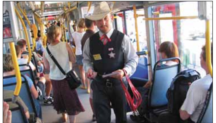
▶ Zorganizowani mają lepiej