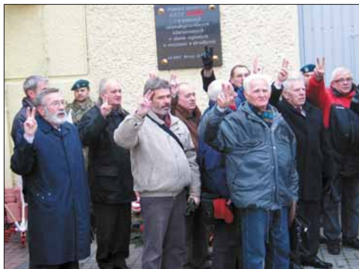
Byli internowani pod więzienną bramą.

Po mszy w asyście orkiestry uczestnicy tamtych wydarzeń przeszli przez miasto pod Zakład Karny. Za sprawą Grupy Rekonstrukcji Historycznej Twierdza Wrocław można było w jakimś stopniu odczuć atmosferę wydarzeń sprzed niemal 30 lat. Milicyjne gaziki oraz wóz bojowy,