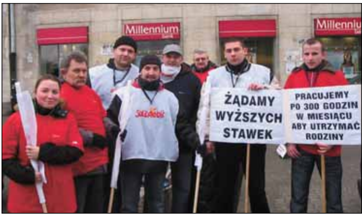
◀ Pikieta pracowników ochrony pod bankiem Millennium