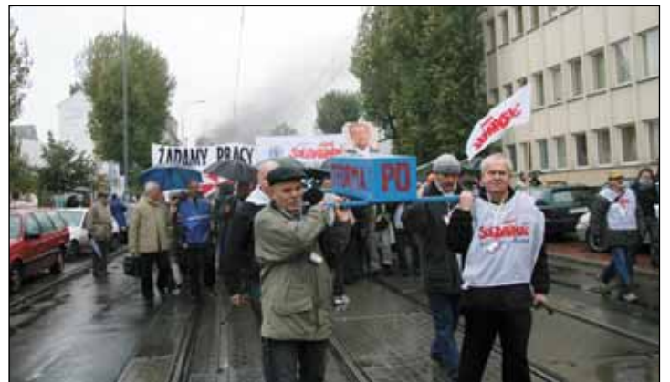
▶ Manifestacja w Poznaniu