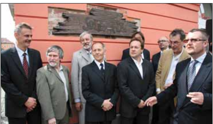
◀ Odsłonięcie tablicy upamiętniającej działalność podziemnego Radia Solidarność