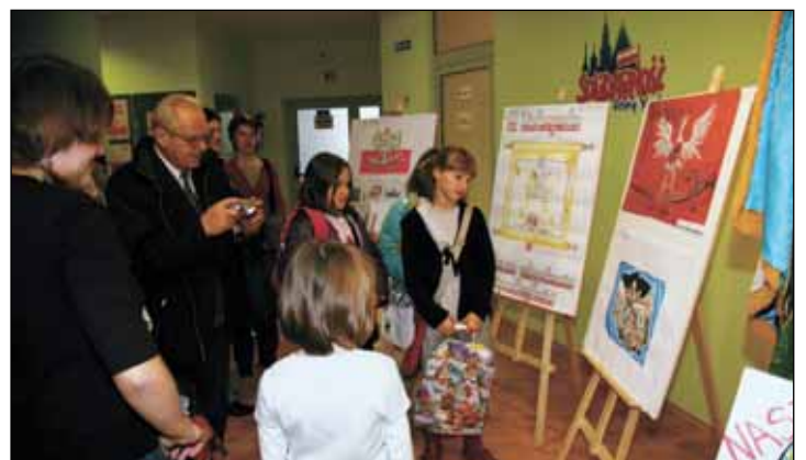
▶ Mój dom, moje miasto, moja Ojczyzna