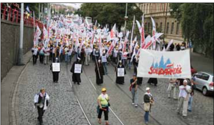
◀ Manifestacja w Pradze