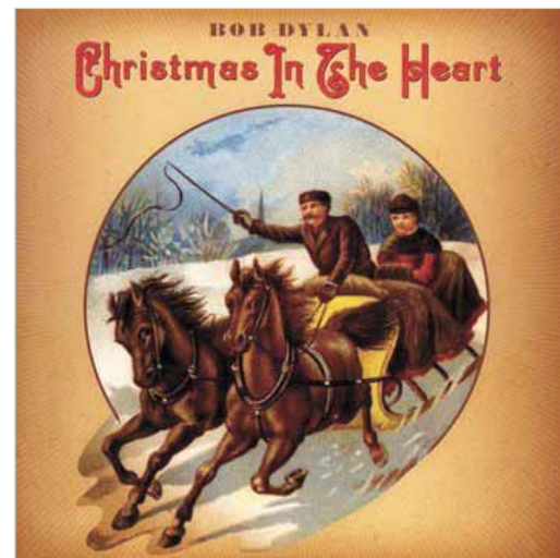
Bob Dylan, Christmas In The Heart Sony Music, Listopad 2009

Marzy mi się, pewnie podobnie jak innym tutaj piszącym, interaktywne wydanie „Dolnośląskiej Solidarności”. Mogłoby ono przypominać rozmawiające ze sobą obrazy na ścianie nad łóżkiem kinowej „Amelii”. Właśnie w jednym z takich miejsc, które można