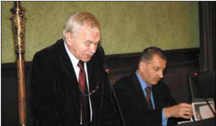
◀ Debata antykrzysowa we wrocławskim Ratuszu