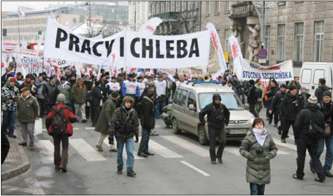
Do Warszawy przyjechali związkowcy z całej Polski.

Sytuacja w PKP Przewozy Regionalne, czy zmiana ustawy Karta Nauczyciela to niektóre tematy, o których dyskutowano podczas ostatniego posiedzenia Komisji Krajowej, która odbyła się w Kielcach w dniach 24-25 listopada.