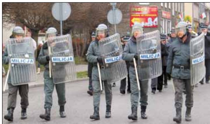
Organizatorzy zadbali o odtworzenie atmosfery sprzed 28 lat.