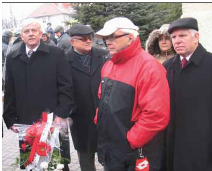
Delegacja brzeskiej „Solidarności” na uroczystościach w Grodkowie.