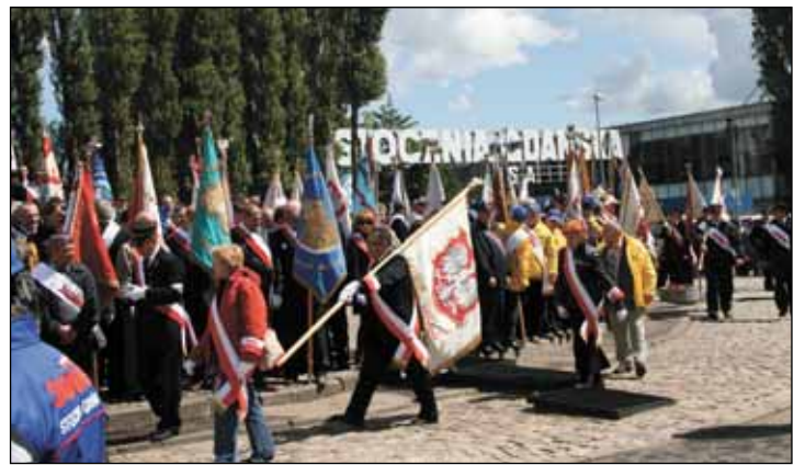
▶ Msza rocznicowa w Gdańsku (4 czerwca 2009)