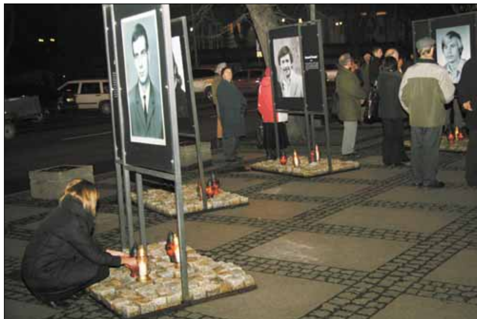
Pod fotografiami ofiar stanu wojennego zapalono znicze.