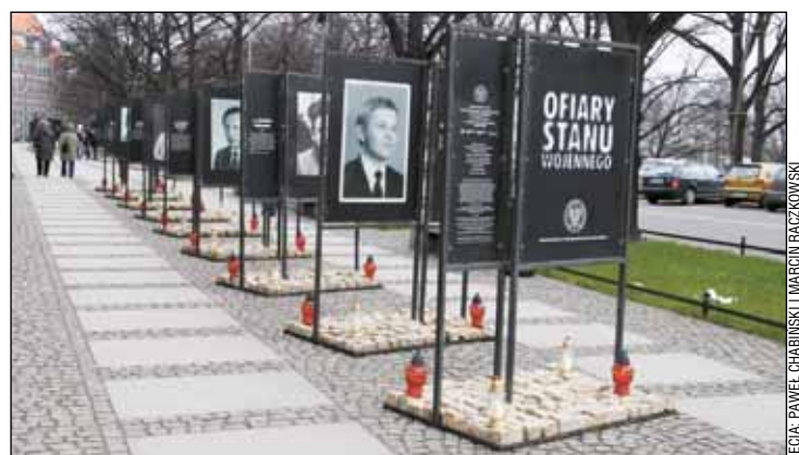
▶ Wystawa poświęcona ofiarom stanu wojennego