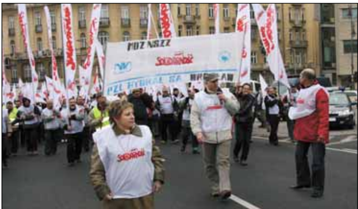
◀ Protest „zbrojeniówki” w Warszawie