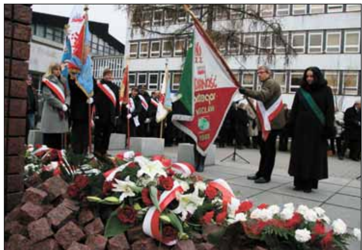
Na uroczystość licznie przybyły poczty sztandarowe organizacji związkowych