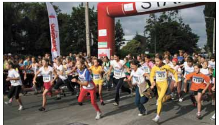
▶ Bieg Solidarności