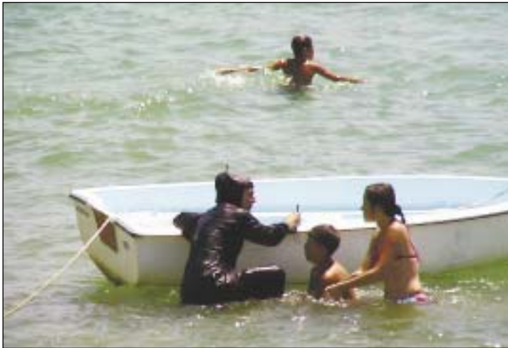
„Turecka Syrena”. Młoda muzumanka podczas kąpieli w morzu.

ja córka nazwała je „tureckimi syrenami”), najogólniej mówiąc, utrudniających pływanie. Młodzi ludzie obojga płci pracowali na straganach w restauracjach, kafejkach i otwartych na oścież biurach, a co parę godzin towarzyszył im śpiew muezina, nawołującego do modlitwy w pobliskim meczecie. Z wyjątkiem kilku starców nikt na owe nawoływania nie reagował. Dla nas, przybyszów jakże z innego świa-