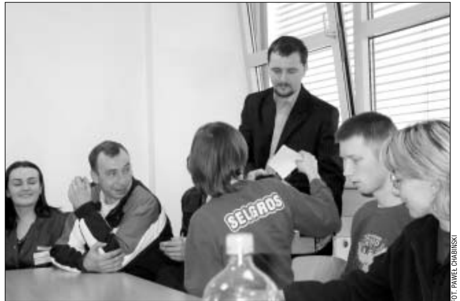
Wybory związkowe w Selgrosie.

• w firmie ochroniarzkiej SO-LID z Warszawy wynajęty przez pracodawcę prawnik 12 lutego 2007 r. zmuszał pracowników do wypisania się ze związku zawodowego. W obecności prawnika pracownicy mieli podpisać oświadczenia, że rezygnują z członkostwa w związku zawodowym. Na miejscu pojawiła się ekipa telewizyjna. W tej sytuacji prawnik uciekł;