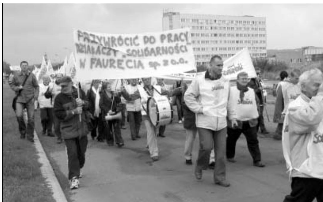
Manifestacja przed Faurecia Wałbrzych, październik 2007 r.