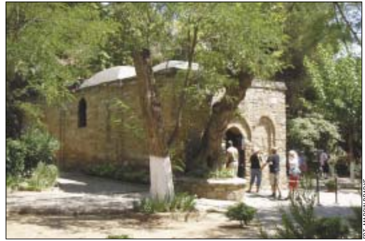
Meryemana, czyli domek Matki Bożej. Tu, wg tradycji, dokonało się Wniebowzięcie MB.

W wędrówkach po Turcji, egejskiej warto też odwiedzić Bodrum. Godne obejrzenia są: amfiteatr, port, a nade wszystko – zamek górujący nad portem, a w nim Muzeum Archeologii Podwodnej. Takiego zbioru antycznych amfor nigdy wcześniej nie widziałem... Podróżowaliśmy tzw. „dolmusem”. Dolmusz to taki miniautobus, taka turecka „nyska”. Dystans z Turgutreis do Bodrum (ok. 25 km) pokonujemy mniej więcej w czasie od pół godziny do czterdziestu minut (w zależności od ruchu na trasie). Dolmusem podróżują wszyscy – starzy, młodzi, ci „europejscy” i ci bardziej „islamscy” – istny przekrój społeczeństwa. Bilet kosztuje trzy liry sześćdziesiąt kuruszy (ok. 1,70