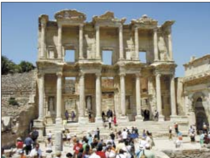
Efez. Biblioteka Celsusa.

Po pierwsze – Efez – około 180 kilometrów od Bodrum, jakieś trzy godziny jazdy autobusem. Zwiedzając to nieprawdopodobnie i gigantyczne wykopalisko (do tej pory odsłonięto ledwie siedem procent antycznego miasta), nie sposób się nie zgodzić z bohaterami „Mojego wiel-