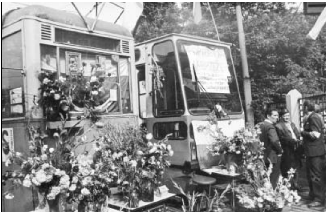
Zajeźdnia tramwajowa przy ul. Słowiańskiej we Wrocławiu w czasie sierpniowych strajków.

województwa wrocławskiego Janusza Owczarka.