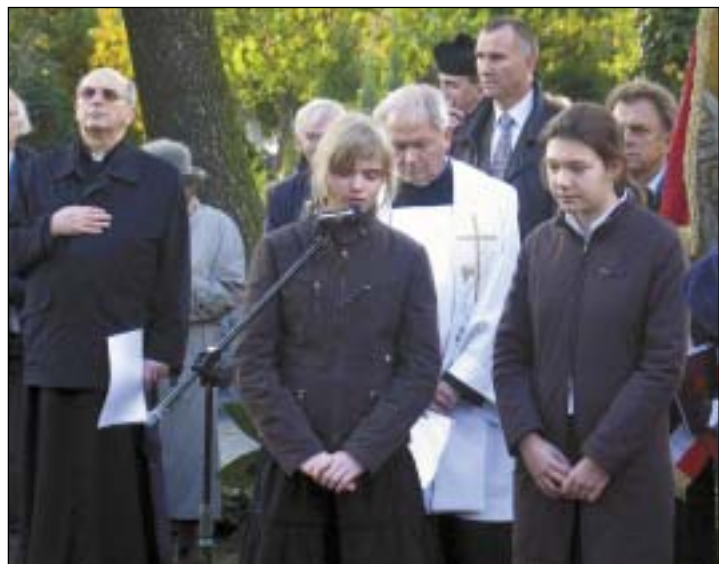
W uroczystościach wzięła udział także młodzież.