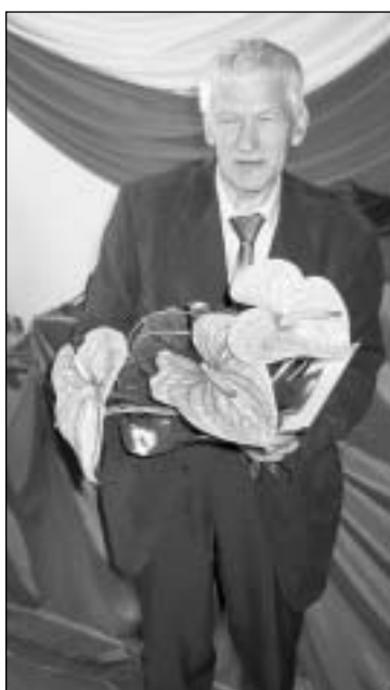
Kornel Morawiecki – twórca Solidarności Walczącej.