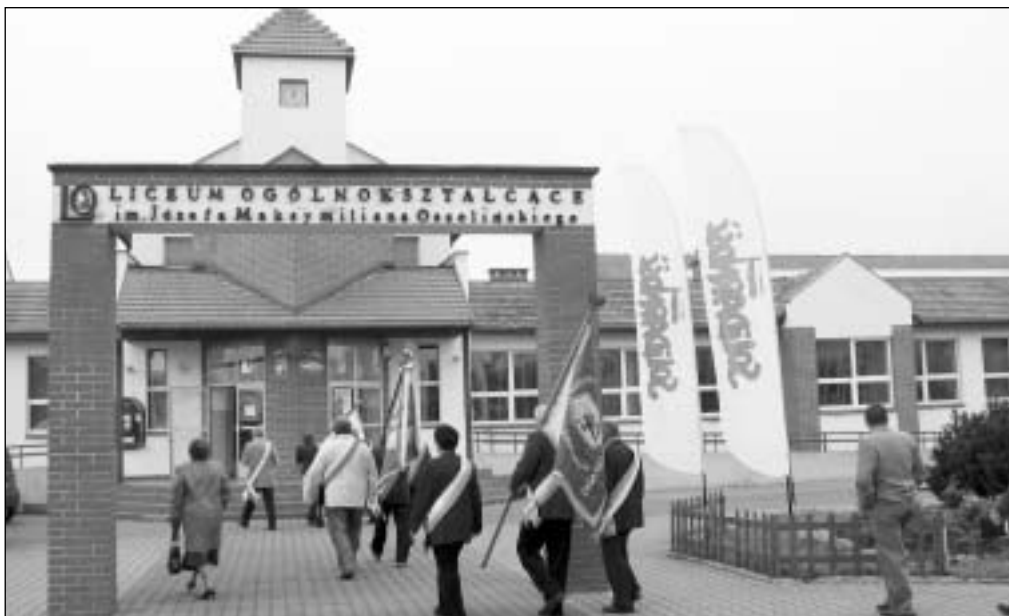
Obrady toczyły się w auli LO im. J.M. Ossolińskiego w Brzegu Dolnym.

Przyjęcie m.in. uchwały programowej, stanowiska w sprawie planu prywatyzacji służby zdrowia, podwyżek płac w oświacie oraz wyłonienie dwóch nowych członków Zarządu Regionu, a także uhonorowanie medalem „Zasłużony dla Solidarności” Kornela Morawieckiego, to efekt XIX Walnego Zebrania Delegatów Regionu NSZZ „Solidarność” Dolny Śląsk, który odbył się w sobotę 6 października w Brzegu Dolnym