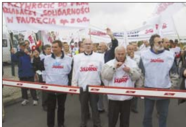
Pochód zatrzymał się przed bramą zakładu.

dziernika br. w Wałbrzychu i we wspólnym pochodzie wyruszyło pod zakład „Faurecia”. Powodem tego spotkania było wyrzucenie