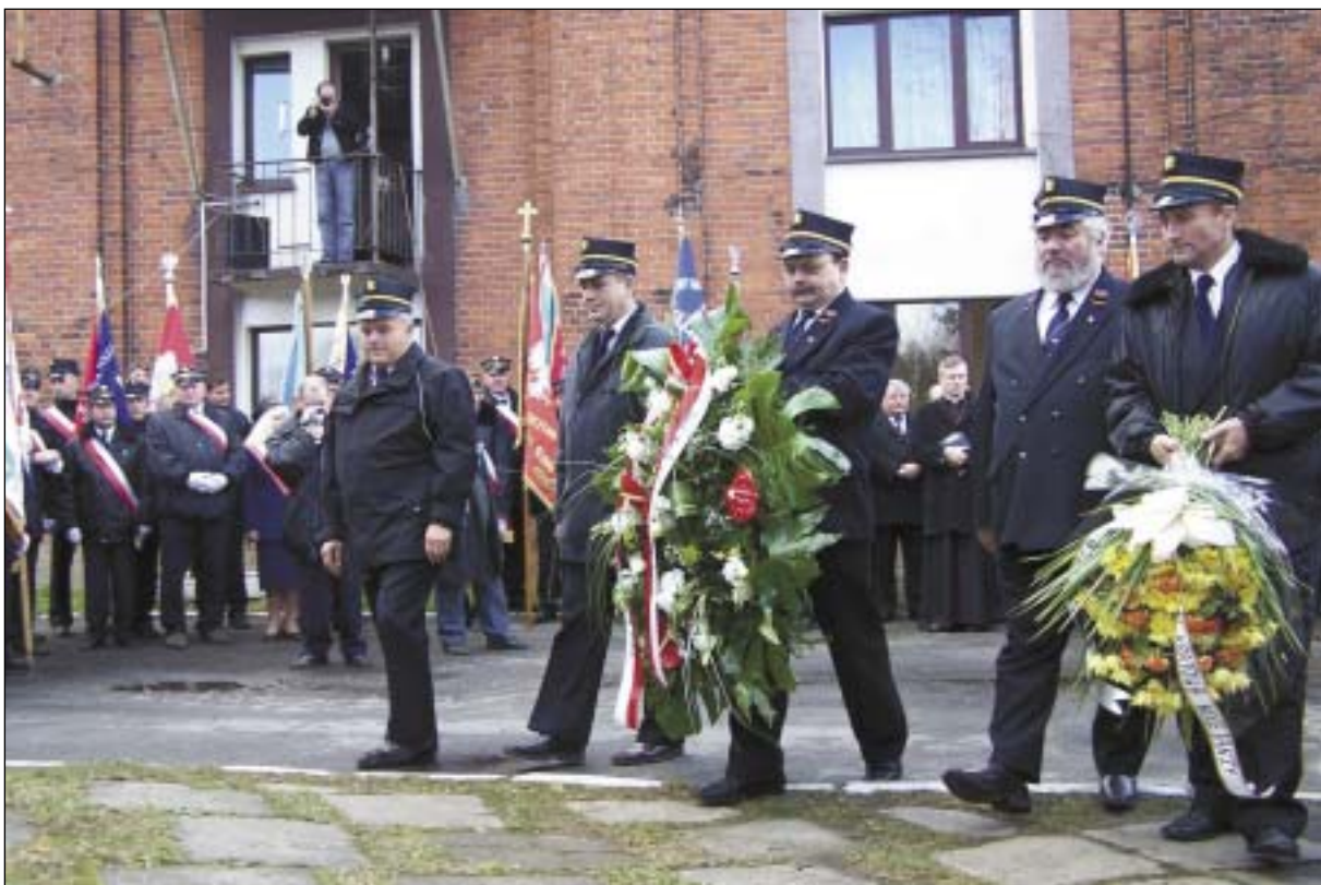
Składanie kwiatów pod pomnikiem św. Katarzyny Aleksandryjskiej – patronki kolejarzy.