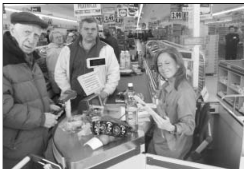
Już 1 i 11 listopada pracownicy sklepów będą mieli wolne.

Legnica 30 sierpnia 2007r. wywiad nieautoryzowany