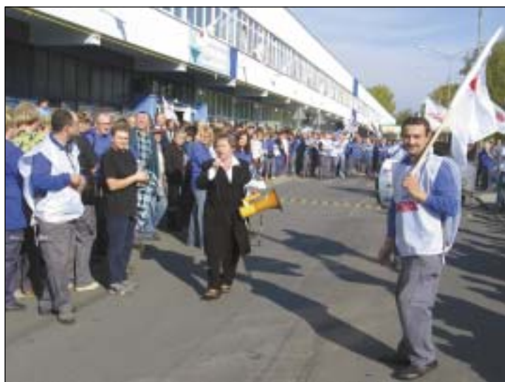
Strajkujący wyszli przed budynek zakładu.

kowań oraz niedopełnienia obowiązku wynikającego z Ustawy o rozwiązywaniu sporów zbiorowych Komisja Międzyzakładowa postanowiła złożyć zawiadomienie o popełnieniu przestępstwa