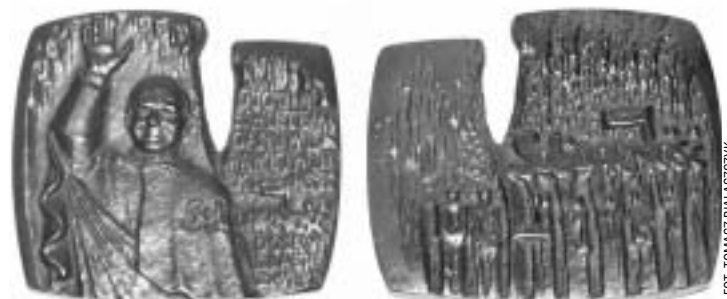
Pamiątkowy medal wręczony Ojcu Świętemu we Wrocławiu

składają Koleżanki i Koledzy z NSZZ „Solidarność” ARCHIMEDES SA