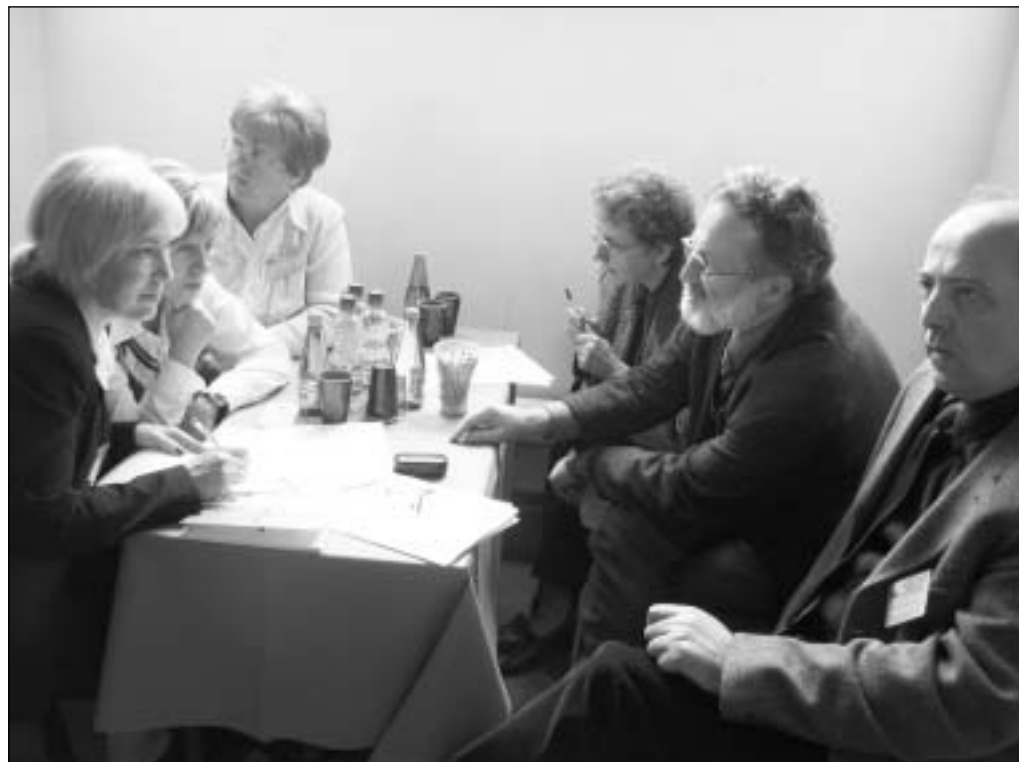
Członkowie komisji uchwał i wniosków.

W deklaracji programowej nawiązującej do dokumentu z ostatniego KZD w Legnicy delegaci uznali za sprawę priorytetową regularne uczestnictwo w szkoleniach działaczy wszystkich szczebli, systematyczną pracę na rzecz rozwoju Związku. W deklaracji zobowiązano także Zarząd Regionu do podjęcia starań w celu utworzenia Związkowego Centrum Szkolenia Kadr oraz