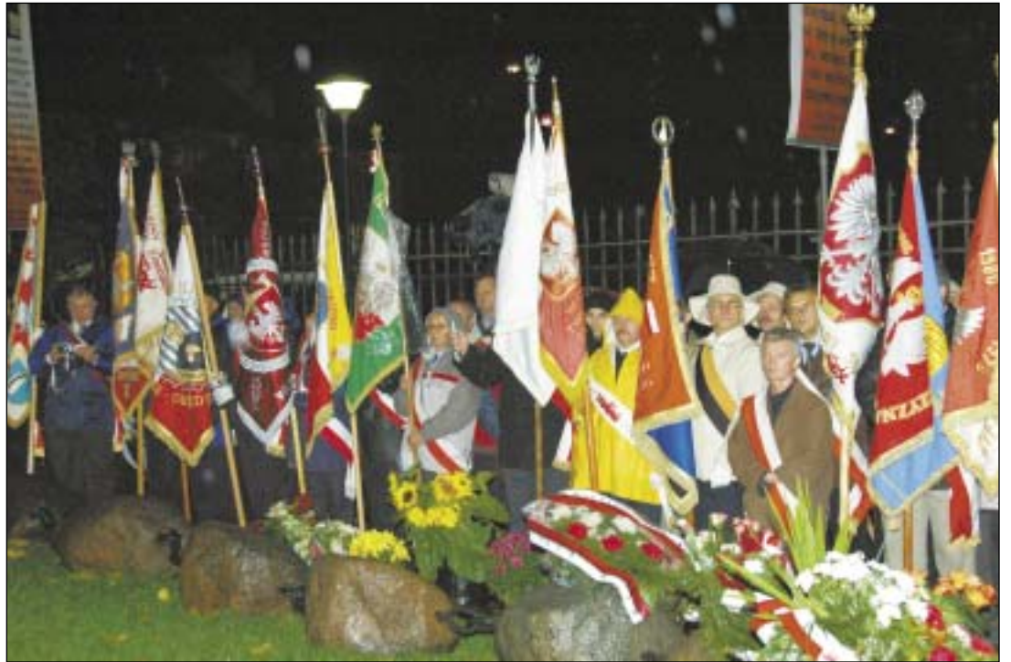
Związkowe poczty sztandarowe przy grobie ks. Jerzego Popiełuszki.

We Wrocławiu 18 października br. w kościele pod wezwaniem Świętej Rodziny przy ulicy Monte Cassino z udziałem człon-