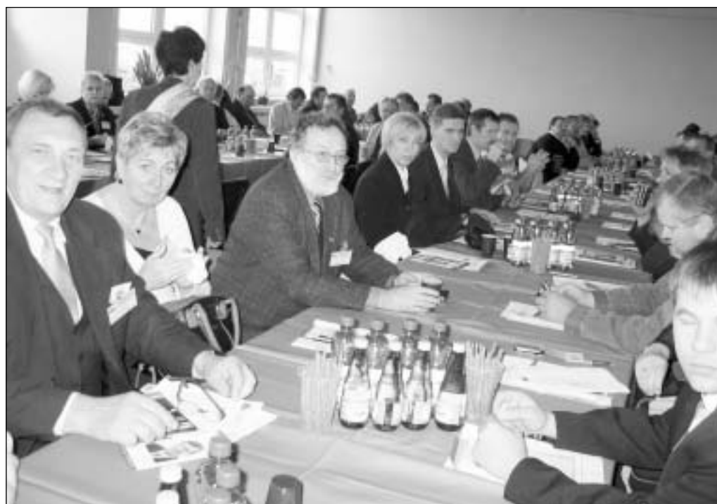
Delegaci z Wałbrzycha.