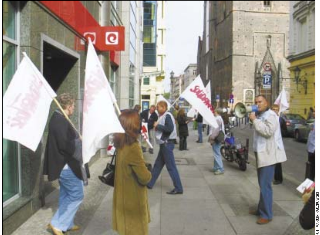
We Wrocławiu związkowcy pikietowali oddział banku przy ul. Kielbaśniczej.

P rzez dwa dni przed siedzibami Euro Banku w Warszawie, Poznaniu i Wrocławiu odbywały się pikiety wspierające pracowników Ekotrade w walce o godne zarobki i poszanowanie praw pracowniczych. Dlatego związkowcy postanowili zwrócić uwagę klientów Ekotrade na warunki, w jakich zatrudniani są pracownicy strzegący ich bezpieczeństwa. Jednym z największych klientów tej firmy jest Euro Bank. Godzinna akcja informacyjna w poniedziałek 8 października br. pod jednym z wrocławskich oddziałów Euro Banku dotyczyła warunków pracy jakie firma ochroniarska Ekotrade proponuje pracownikom ochrony. – Jesteśmy tu po to, aby zaprotestować przeciw skandalicznie niskim płacom i brakowi zapłaty za godziny nadliczbowe – mó-