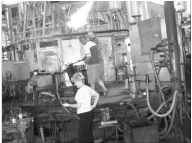
W lipcu temperatura dochodziła tu do 60°C

Od kilku lat załoga w imię ratowania zakładu godziła się na obniżki pensji, ale determinacja ma swoje granice, dlatego zakładowa „S” planuje na 18 października br. manifestację pod zakładem. – Chcemy pokazać, że nie ma zgody na ratowanie zakładu jedynie poprzez zwalnianie ludzi. To jest najprostsze rozwiązanie. Próbowaliśmy rozma-