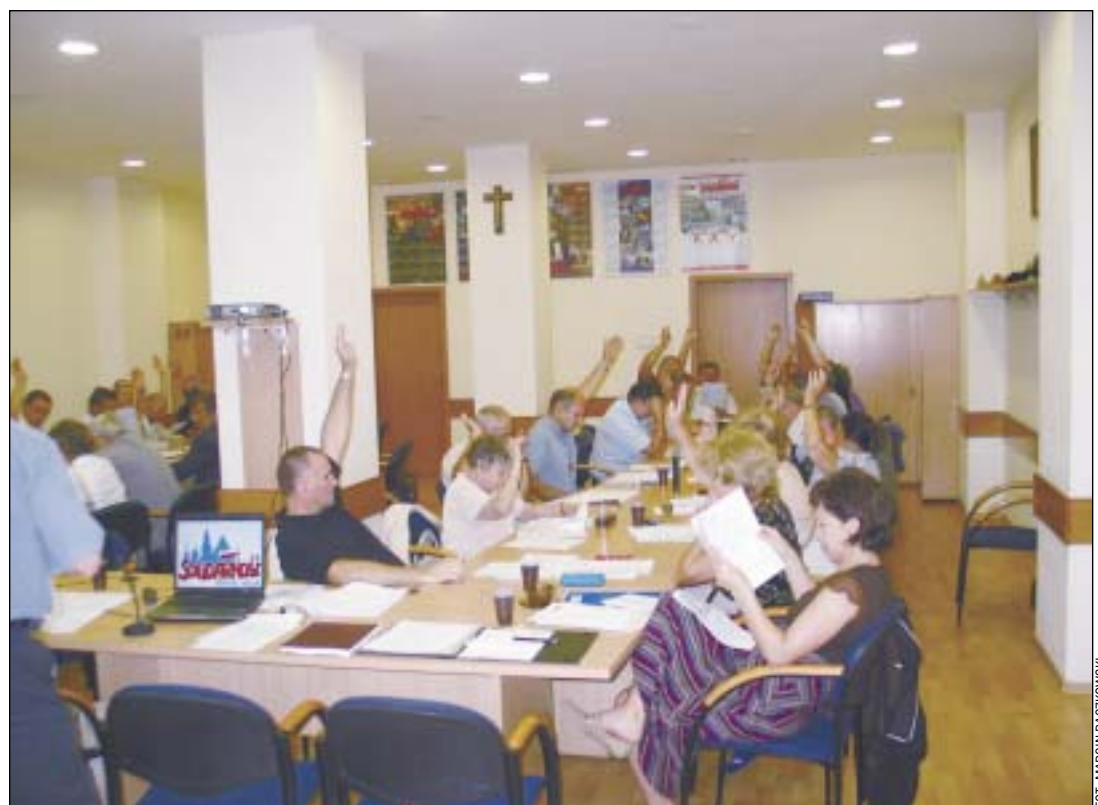
Głosowanie nad regulaminem Rady Oddziału.