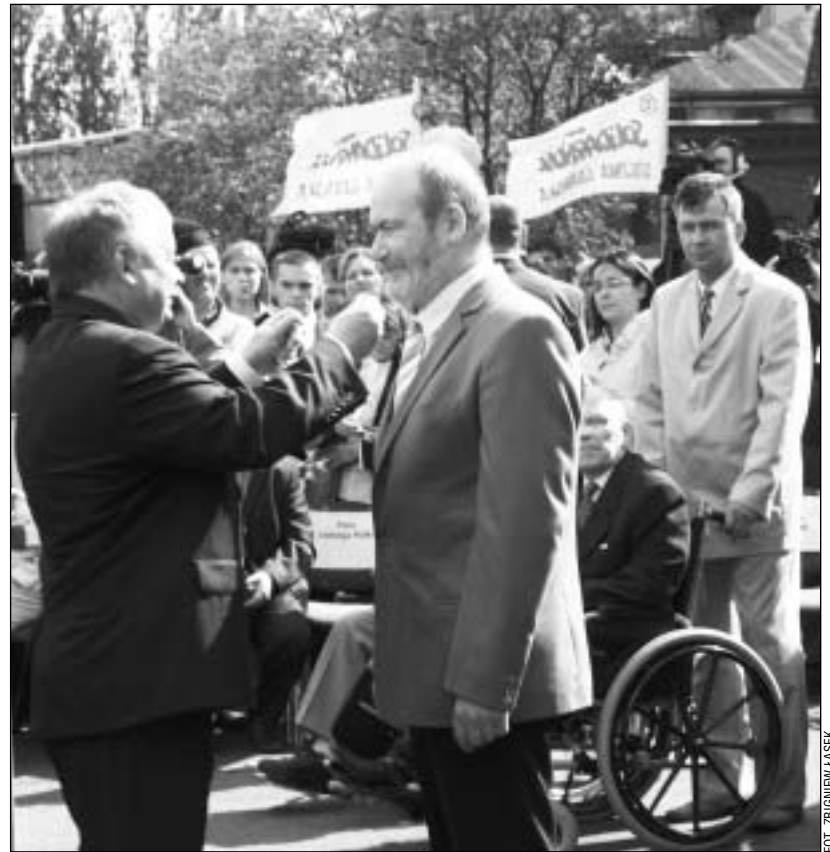
Eugeniusz Szumiejko odbiera odznaczenie z rąk prezydenta Lecha Kaczyńskiego.

Prezydent zapowiedział, że będzie sukcesywnie nadawał odznaczenia osobom, które na to swoją życiową postawą zasłużyły.