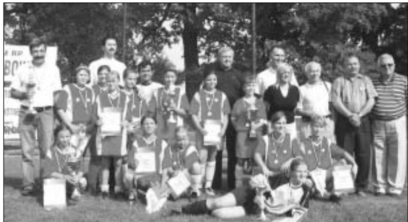
Zwycięska drużyna UKS „Harcek” Żarów:

cek” Żarów, LUKS „Ziemia Lubiąska”, UKS Wołów, UKS Bielutów. W meczu finałowym zwycięstwo odniósł zespół Żarowa, który pokonał Lubin 2:0.