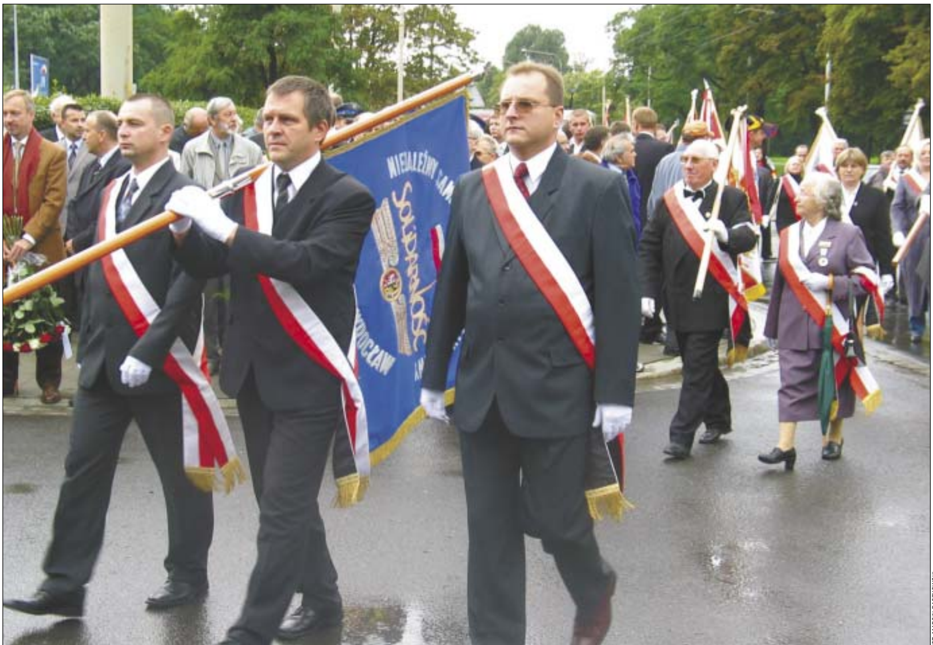
Poczet sztandarowy „S” MPK Wrocław