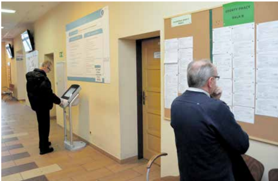
Jak się okazuje internet nie zastąpi wizyty w Urzędzie Pracy

teli Indii – o 1,9 tys. do 8,8 tys. osób, a także obywateli Gruzji – o 1,3 tys. do 2,9 tys. i Wietnamu – o 0,7 tys. do 12,4 tys. Większość obcokrajowców posiada zezwolenia na pobyt czasowy związany z wykonywaniem pracy. Obsługujemy proces rejestracji oświadczeń o powierzeniu zatrudnienia cudzoziemcom. Głównie dotyczy to obywateli Ukrainy.