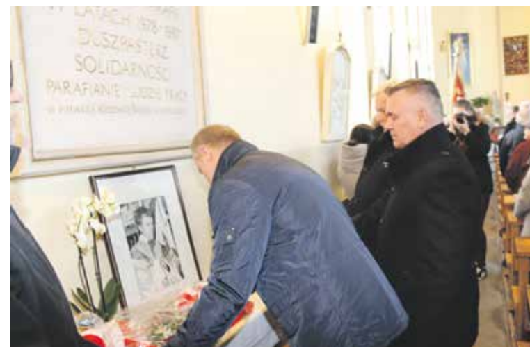
Wiązanka kwiatów pod tablicą upamiętniającą ojca Adama Wiktora