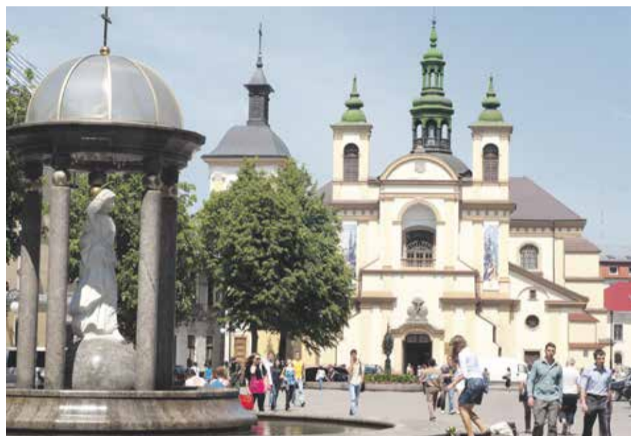
Niegdyś najważniejsza świątynia w Stanisławowie – kolegiata pw. Najświętszej Maryi Panny oraz świętych: Stanisława i Andrzeja.

świadoma trudnej przeszłości, której autorem były bandy UPA. Odczuwa smutek i z tego powodu, i dlatego, że w Polsce ktoś wciąż jej to wypomina, jakby to ona była sprawczynią morderstw.