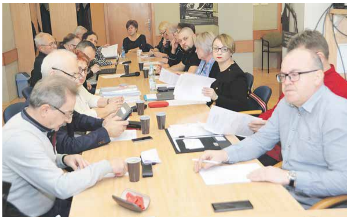
Podczas posiedzenia działacze podjęli m.in. uchwały ws. powołania zarządów komisarycznych w kilku organizacjach.