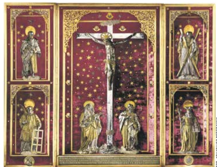
Fragment ołtarza Jerina