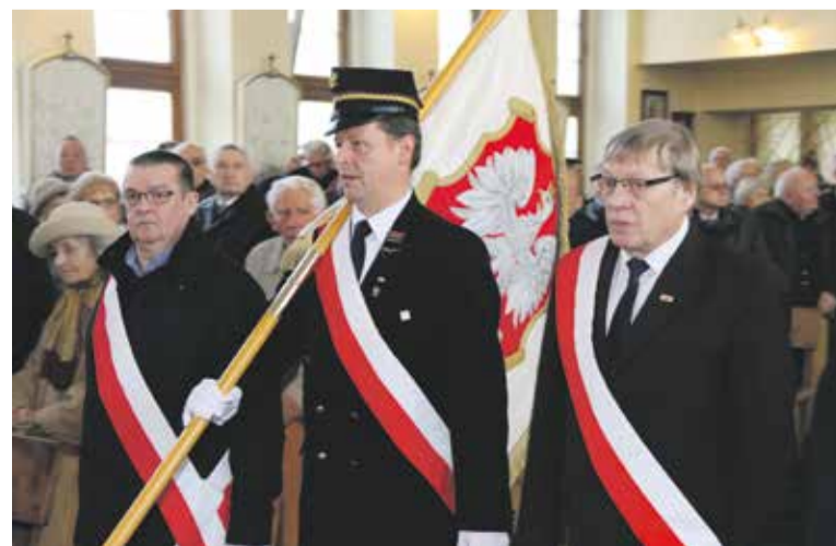
Uroczystość zgromadziła liczne delegacje ze sztandarami związkowymi