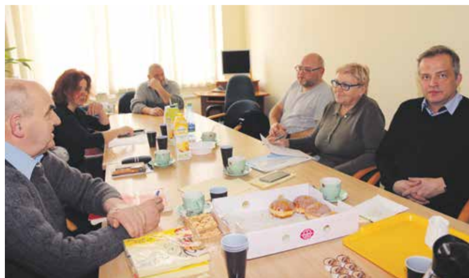
Rada Krajowej Sekcji Pracowników Pomocy Społecznej

„To zróżnicowanie płac to strzał w kolano rządu, a system opieki pielęgniarstwa został postawiony pod murem i rozstrzelany. Kto się