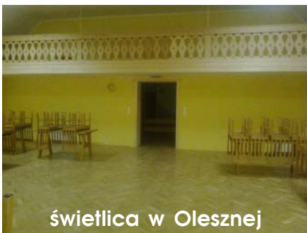
świątelnia w Olesznej