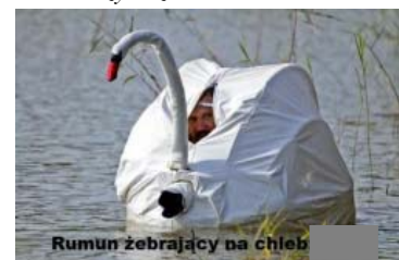
Rumun zebrający na chleb

– Nie – powiedział ordynator – normalna oso- ba pociągnęłaby za korek. Chce pan pokój z widokiem czy bez?