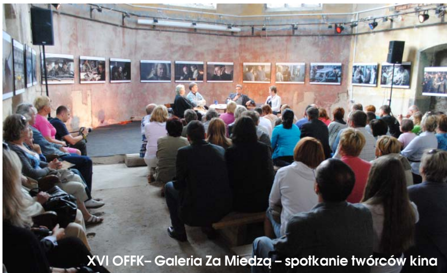
XVI OFFK – Galeria Za Miedzą – spotkanie twórców kina