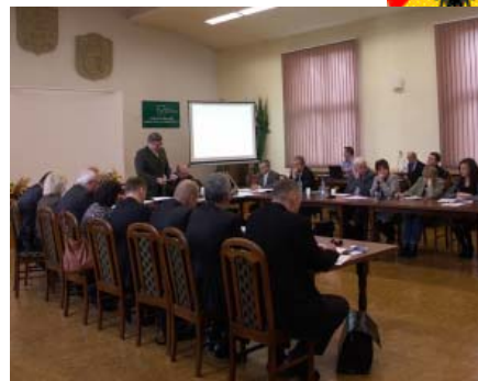
Sesja Rady Powiatu