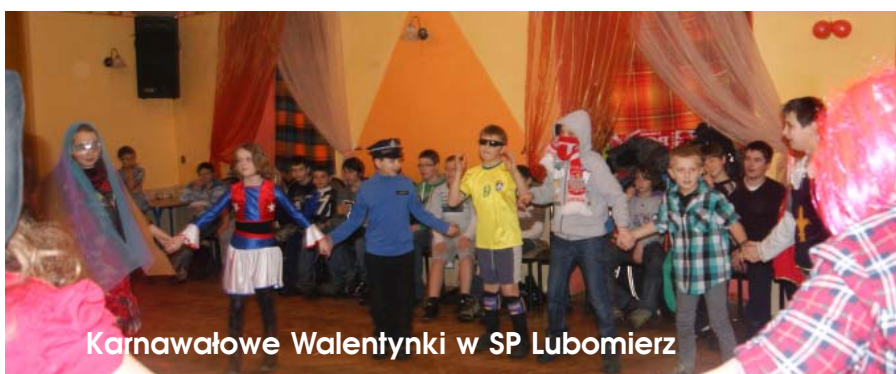
Karnawałowe Walentynki w SP Lubomierz