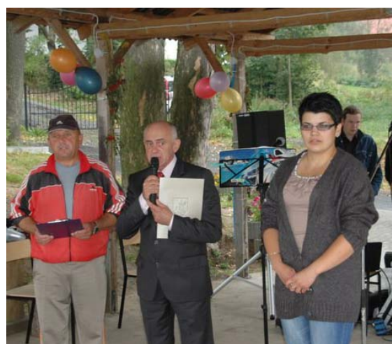
Dożynki w Radoniowie