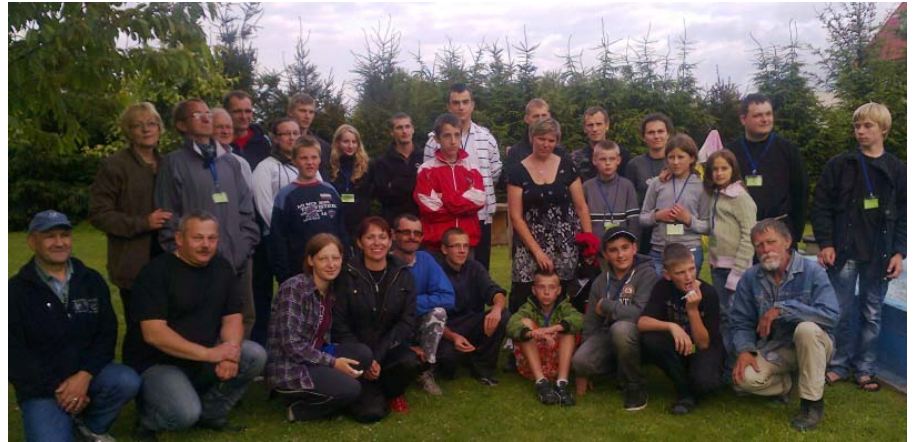
OSP Oleszna Podgórska