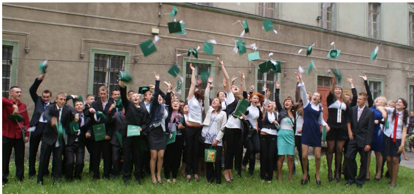
Klasy trzecie lubomierskiego Gimnazjum żegnają szkołę