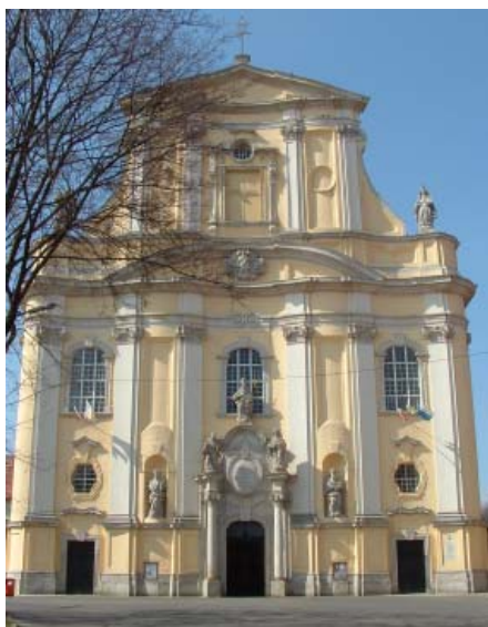
Kościół pod wezwaniem Wniebowzięcia Najświętszej Marii Panny i Św. Maternusa (dokończenie z poprzedniego numeru)

Zupełnie odmienny charakter ma stiukowa dekoracja nad prezbiterium. To Gloria z Okiem Opatrzności u szczytu, a poniżej jej znajdują się postacie dwunastu Apostołów i w narożnikach czterej Wielcy Doktorowie Kościoła.