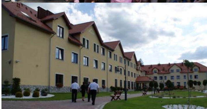
Jolly Med Klinika Zdrowia i Urody w Popielówku